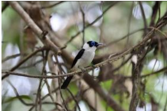
Frilled Monarch, Brown River, LS

Om 4.00h vertrokken we met ontbijt- en lunchpakketten om op tijd in de mangrove te