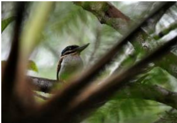
Hook-billed Kingfisher, Varirata, LS

6.00h op voor een dagje Varirata, samen met Daniel. Eerst het picknick gebied verkend waar een Northern Scrub-Robin riep op een van de trails. Na een half uur intensief proberen verlieten we de plek zonder resultaat. De rest van de ochtend liepen we een trail bij de Barred Owlet-Nightjar, Na een wat rustige start druppelden de soorten uiteindelijk toch goed binnen: Chestnut-breasted Fantail en Olive Flycatcher lieten zich mooi zien en even later zagen we zelfs Variable Dwarf Kingfisher! Het mooiste werd tot het laatst bewaard met