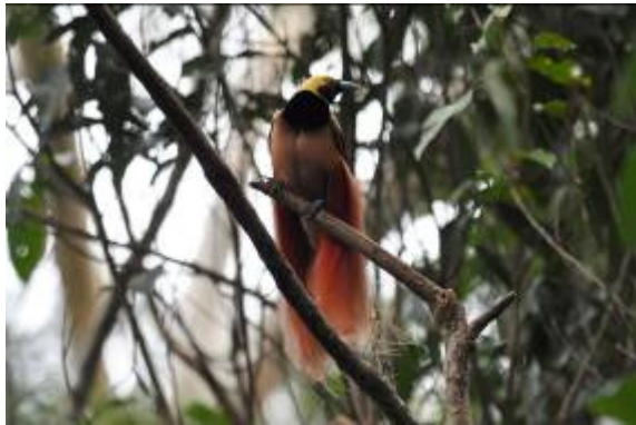
Raggiana Bird-of-Paradise, Varirata, LS

boom voor de ingang van het hotel werden al de eerste soorten gezien: Yellow-tinted Honey-eater, Willie Wagtail en Fawn-breasted Bowerbird. Vervolgens vertrokken naar Varirata NP, op c 45 minuten rijden van Port Moresby, waar we de rest van de dag hebben doorgebracht. Varirata is een bosrijke omgeving afgewisseld met meer open gebieden. Het ligt op c 800 m hoogte. Onderweg zagen we Blue-winged Kookaburra, Black-backed Butcherbird, Rainbow Lorikeet, Eglectus Parrot en Rainbow Bee-eater. Bij aankomst in het park werden we al getraceerd op de eerste flocks met Black Cuckooshrike, Hooded Pitohui, Filled Monarch en een prachtige Yellow-billed Kingfisher. Verderop vond Daniel zelfs 3 schitterende Marbled Frogmouth waar we lang van hebben kunnen