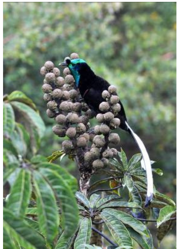
Ribbon-tailed Astrapia, Kumul Lodge, LS

Vroeg op en vervolgens een uur rijden naar de plek van de Lesser Bird-of-Paradise (1800m). Om de mannetjes te zien baltsen moet je hier net voor zonsopgang zijn en inderdaad, bij de eerste schemer kwamen de eerste vogels al in beeld. Aanvankelijk nogal diep in de bomen maar later fraai een mannetje vrij in de boom. Andere soorten hier waren Brush Cuckoo, Black-headed Whistler, Ornate Honey-eater, Red-headed Myzomela en Hooded Munia. Vervolgens op de terugweg een korte stop voor Yellow-breasted Bowerbird (3 gezien, wel wat ver) en enkele Long-tailed Shrikes. De volgende stop was voor de Magnificent Bird-of-Paradise, maar dan natuurlijk wel een fraai mannetje! Het duurde een tijd voordat we een mannetje te zien kregen maar die liet zich dan ook wel mooi en vrij lang zien. Het was zelfs de eerste keer dat dit door onze gids gezien was! Ook hier waren White-bellied Cuckooshrike en Tawny Grassbird, Voor de lunch nog een kort stukje trail gelopen rondom