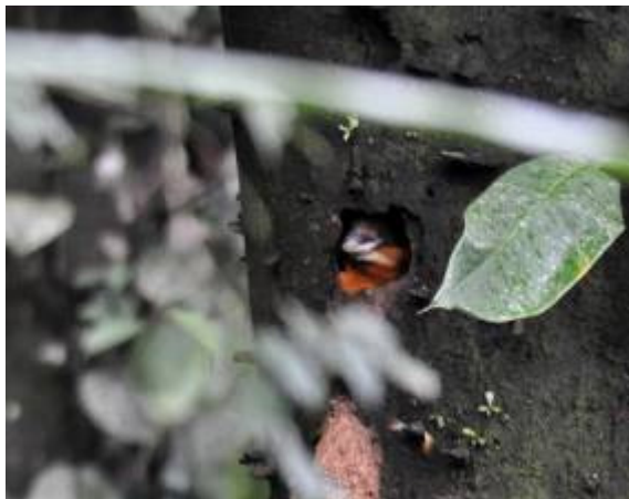
Shovel-billed Kingfisher, Tabubil, LS

gefotografeerd kon worden en continu bekeken kon worden door de telescoop! Echt ongelooflijk! Vervolgens vloog de vogel van het