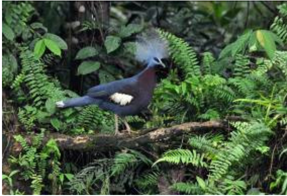
Southern Crowned Pigeon, Ekame River, LS

hadden we een nieuwe metgezel aan boord. Helaas was door de val de vogel gewond geraakt aan zijn poten waardoor ie niet kon staan. Het echte hoogtepunt van de boottrip kwam toen Kees een wilde Southern Crowned