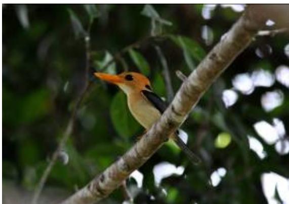
Yellow-billed Kingfisher, Varirata, LS

genieten. Pink-spotted en Wompoo Fruit-Dove waren hier eveneens fraai te zien. Daarna werd de lek van de Raggiana Bird-of-Paradise bezocht met schitterende baltsende mannetjes! Even later kon zelfs de Eastern Riflebird worden bijgeschreven waardoor we na dag 1 al op 2 soorten paradijsvogels zaten! Het bier smaakte daarom ook goed tijdens het diner. Daarna was het vroeg slapen want het was een lange dag.