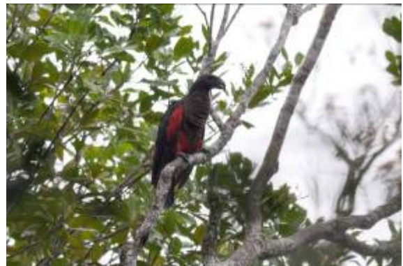
Vulturine Parrot, Kwatu Lodge, LS

's Morgens vroeg een poging gedaan voor Southern Cassowary, er stond een schuilhut met op c 40 meter afstand een voedertafel met fruit en noten e.d. Een uur gewacht in de hut, maar niks gezien dus besloten we de trail te lopen voor Hook-billed Kingfisher. Helaas...weer alleen gehoord...Wel zagen we hier Black-sided Robin, Puff-backed Meliphaga, een fraai open zittende Vulturine Parrot, Little Paradise-Kingfisher en Yellow-breasted Boatbill.