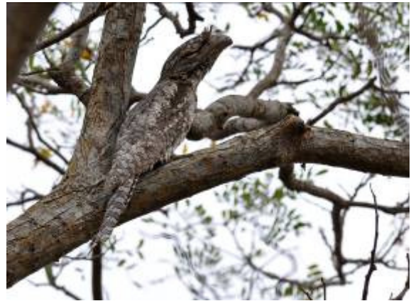
Papuan Frogmouth, PAU, LS

De laatste dag in Papoea! De ochtend werd besteed op het terrein van de Pacific Adventist University (kortweg PAU). Dit zeer ruim opgezette terrein is parkachtig met vijvers, enkele kleine moerassen, velden en veel oude bomen. En de vogels lieten zich hier voor de verandering eens goed zien en rustig bekijken! Nieuwe soorten hier waren Papuan Frogmouth (4 vogels en allen erg fraai te zien), Chestnut-breasted Munia, Black Bittern en Rufous-banded Honeyeater. Andere interessante soorten waren Australasian Grebe, Little Black en Little Pied Cormorants, Pied, Intermediate en Little Egret, Rufous Night-Heron, Australian