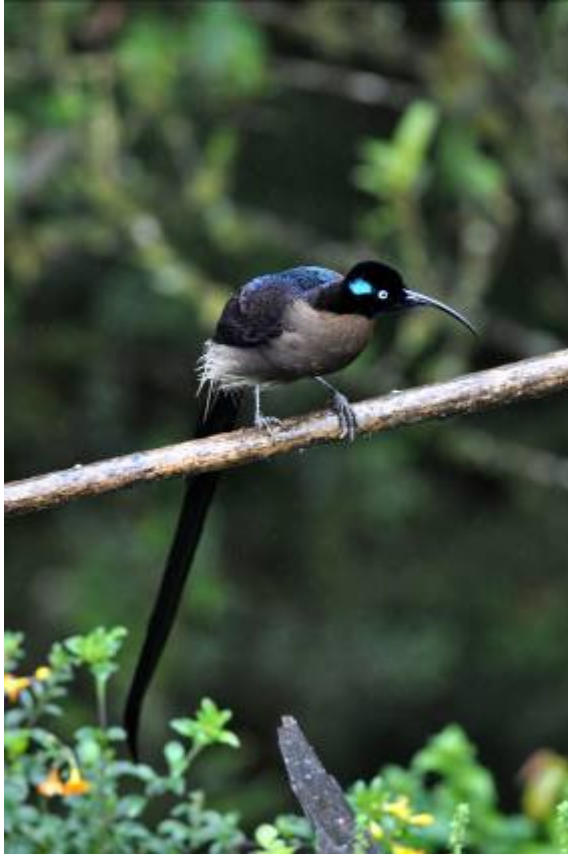
Brown Sicklebill (man), Kumul Lodge, LS

Dove, White-bibbed Fruit-Dove, Papuan en Yellow-billed Lorikeet, Island Leaf-warbler, Black Fantail, Brown-breasted Gerygone, Buff-faced en Large Scrubwren, Red-collared Myzomela, Yellow-browed Melidectes, Mid-mountain en Streaked Berrypecker, Lawes Parotia (vrouw) en Hooded Munia. Op de terugweg stopten we langs de weg voor Tit Berrypecker die we na enig zoeken op afstand konden zien. Hier zat ook een Little Shrike-Thrush. Voor de lunch nog een trail gelopen rond de lodge met Black-throated Robin en Canary Flycatcher als resultaat. 's Middags reden we naar Max's Trail voor de King-of-saxony Bird-of-Paradise. Een schitterende trail door prachtig nevelwoud, de boomstammen waren bedekt met epiphyten en korstmossen. Het was wel een stuk klimmen maar na c 1,5 uur zagen we de eerste fraaie adulte man King-of-saxony Bird-of-Paradise zingend boven in een boom. Andere hoogtepunten hier waren Lesser Melampitta (door deel van de groep gezien), Spotted Jewel-babbler (gehoord), Papuan en Yellow-billed Lorikeet, Tit Berrypecker, Wattled Ploughbill (vrouw) en Blue-capped Ifrita, Terug bij de lodge was het natuurlijk weer een drukte van belang bij de voedertafel met de bekende soorten. Een poging voor de Dusky Woodcock in de avondschemer leverde helaas niks op, morgen opnieuw proberen.