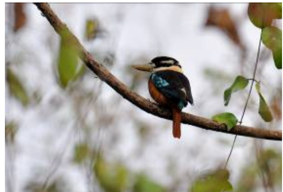
Rufous-bellied Kookaburra, Brown River, LS

Whistling Ducks, Green Pygmy Goose, Little Pied en Little Black Cormorants, Dusky Moorhen, Australian Darter, Silver-eared Honey-eater en Australian Reed Warbler. Verder richting Brown River werd het landschap meer bosachtig met een grote verscheidenheid aan soorten: Variable Hawk, Pacific Baza, Golden- en Yellow-faced Myna en Forest Kingfisher konden allen fraai vanuit de bus worden gezien. De lunch werd genuttigd in de verkoelende schaduw van een boom langs de Brown River, het was nu echt warm geworden. Tijdens de lunch werden nog een paar leuke soorten gezien: een White-bellied Whistler liet zich fraai bekijken in een boom en een Azure Kingfisher vloog tot tweemaal toe langs over de rivier. Met hernieuwde energie gingen we op zoek naar enkele specialiteiten van het bos. Op de eerste plek duurde het niet lang voordat een schitterende Common Paradise-Kingfisher zich aan iedereen liet zien. Het duurde ook niet lang voordat we weg werden gestuurd, het bleek een stuk priveland te zijn. De rest van de dag werd doorgebracht langs de weg met fraai regenwoud aan beide zijden. De diversiteit en