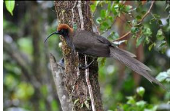
Brown Sicklebill (vrouw), Kumul Lodge, LS

Ribbon-tailed Astrapia, Smoky Honey-eater, Brehms Tiger-Parrot, Belfords Meledictes,