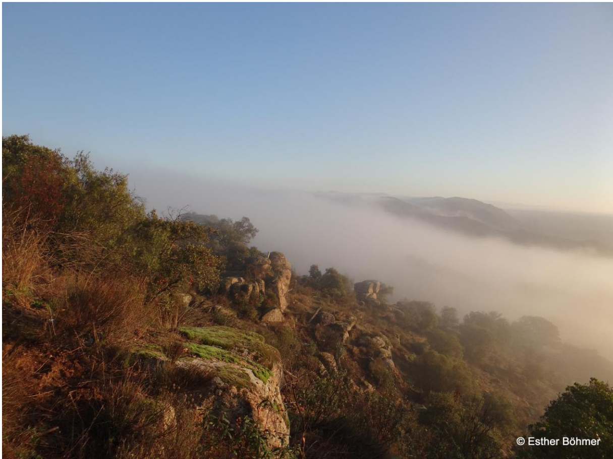
Sierra de Andújar in de mist