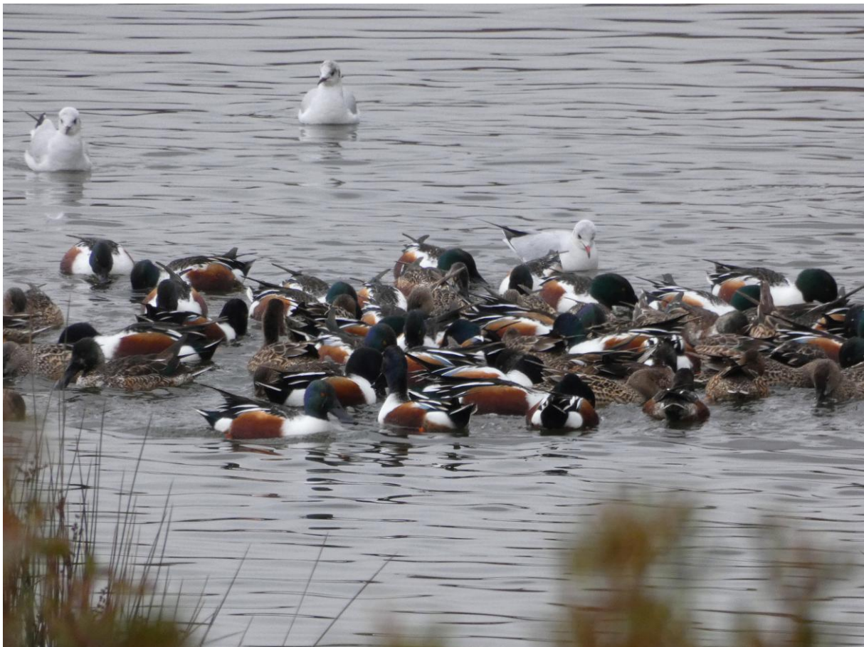
Slobeenden op een kluitje