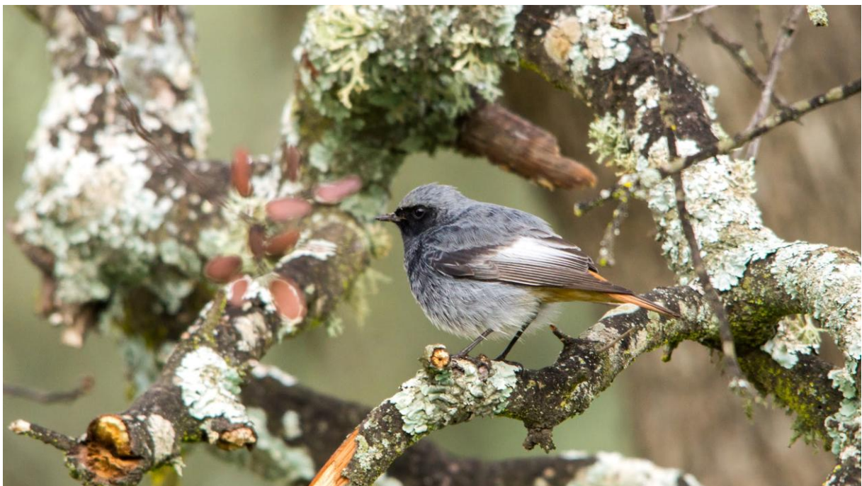
Zwarte Roodstaart