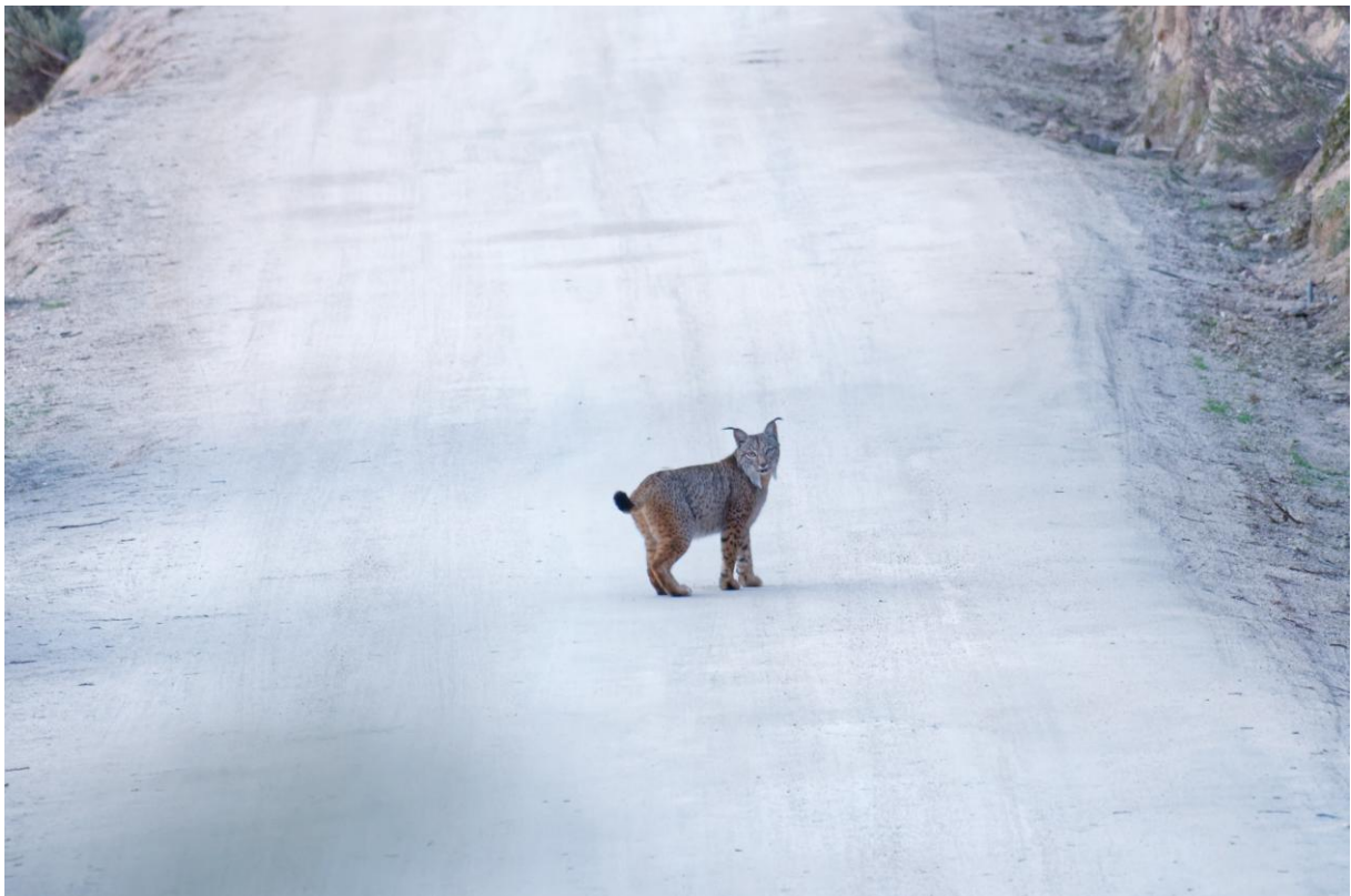
Weer een Pardellynx!!!