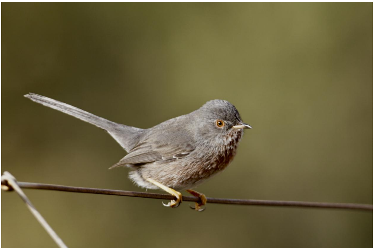
Provencaalse Grasmus