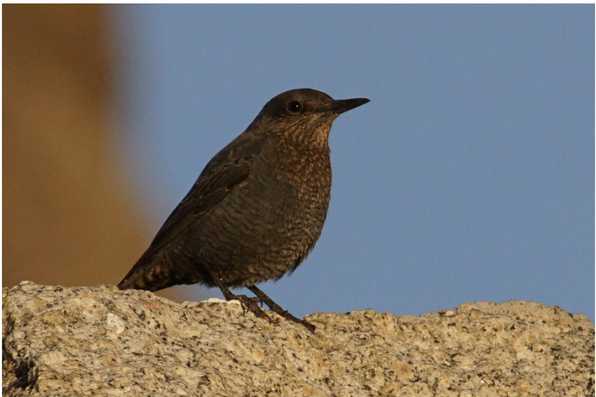
Blauwe Rotslijster