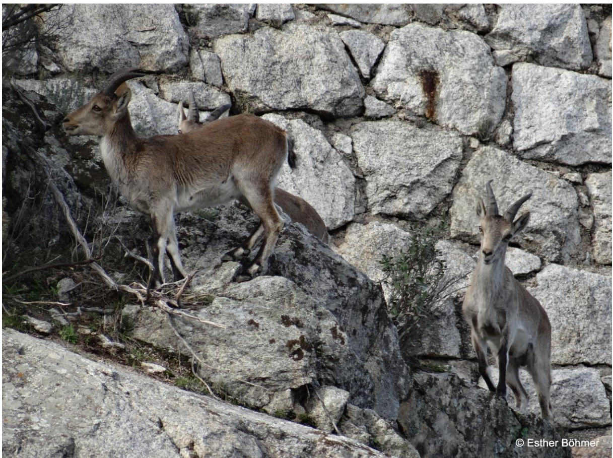
Spaanse Steenbok