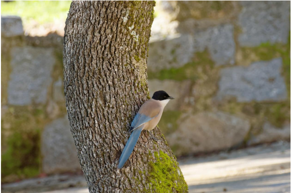
Blauwe Ekster