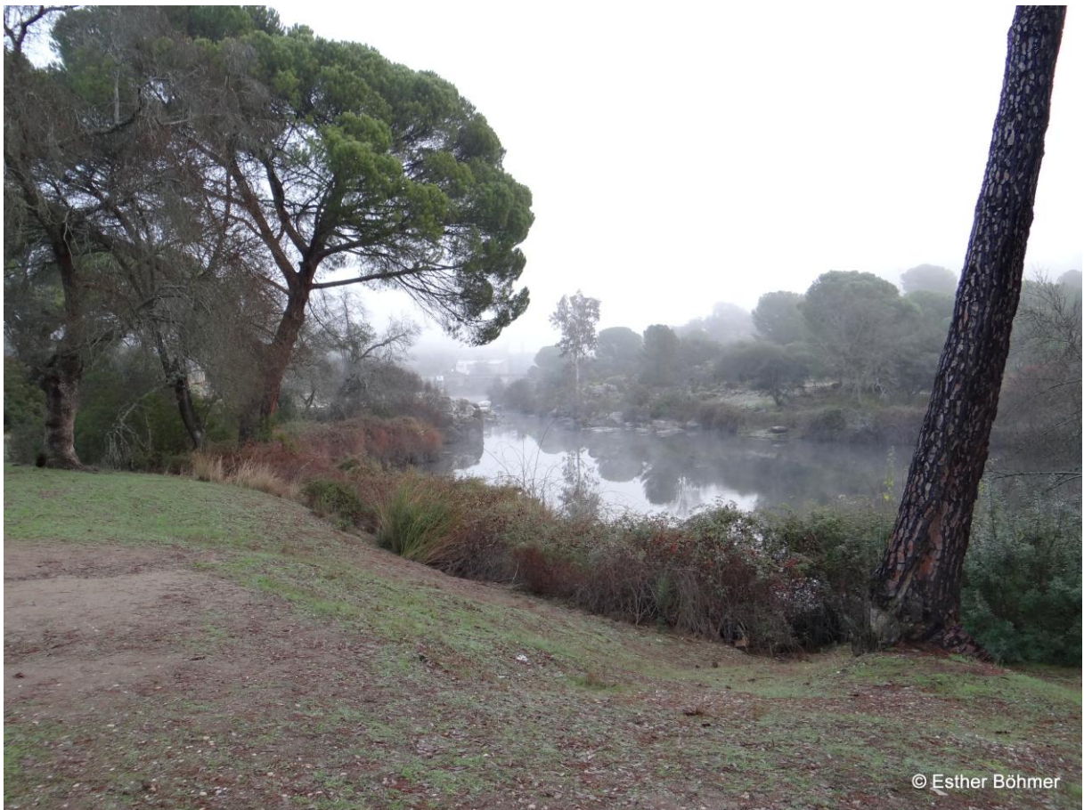
Jándula-rivier bij zonsopkomst