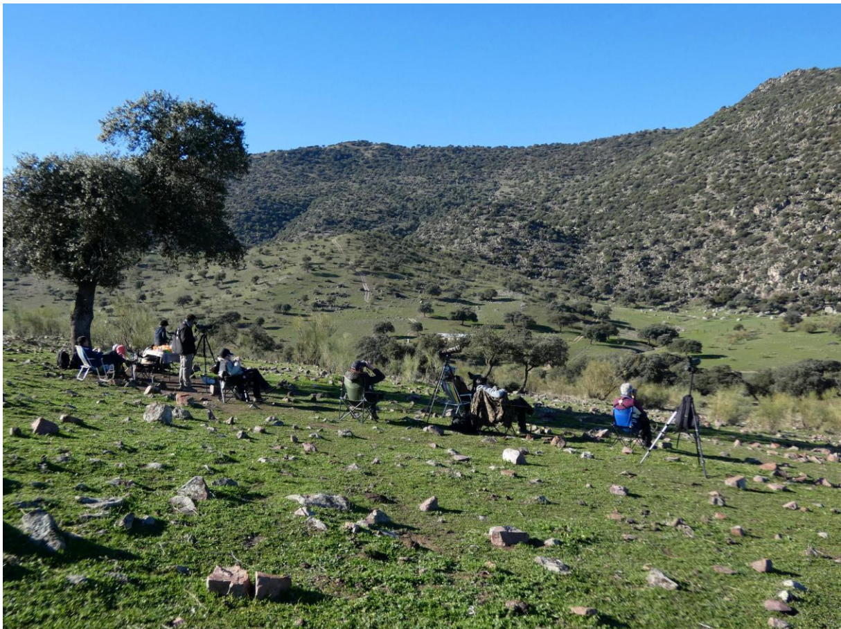
Zoeken en speuren in het zonnetje