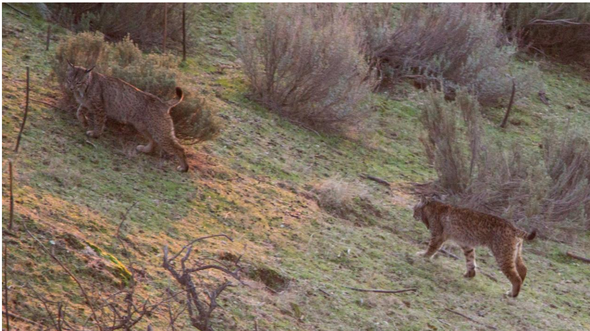
Pardellynx aan de wandel