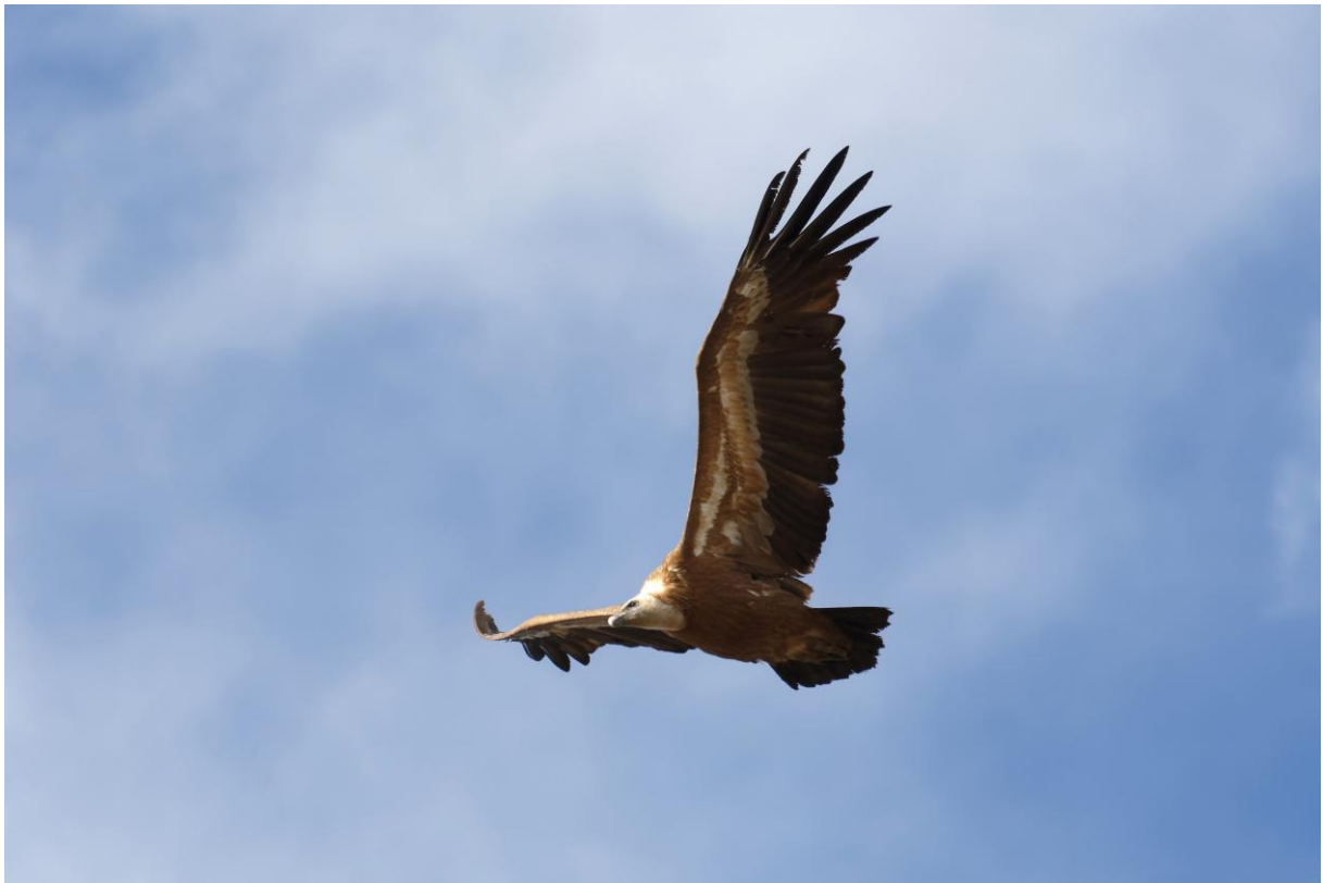
Vale Gier