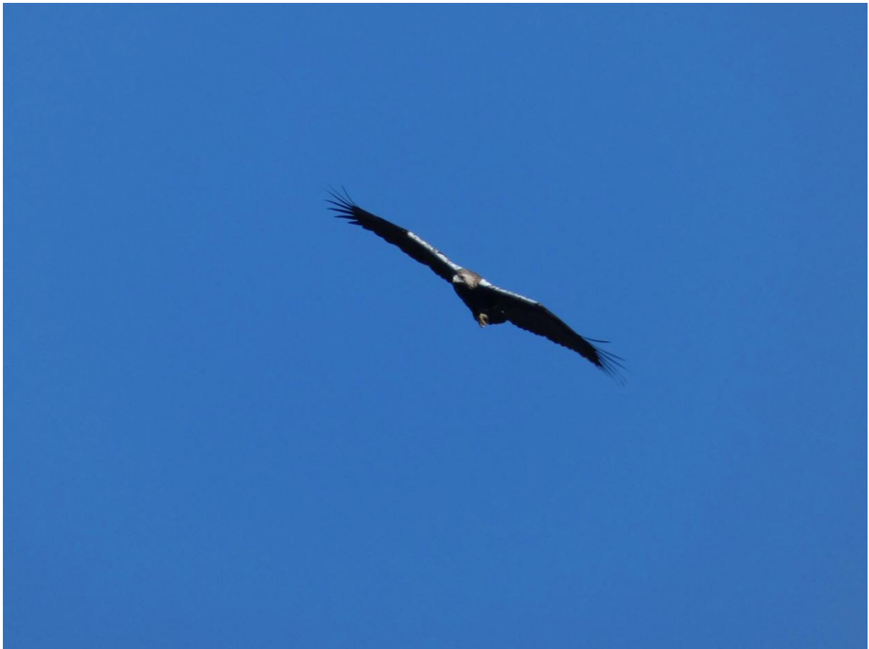
Spaanse Keizerarend