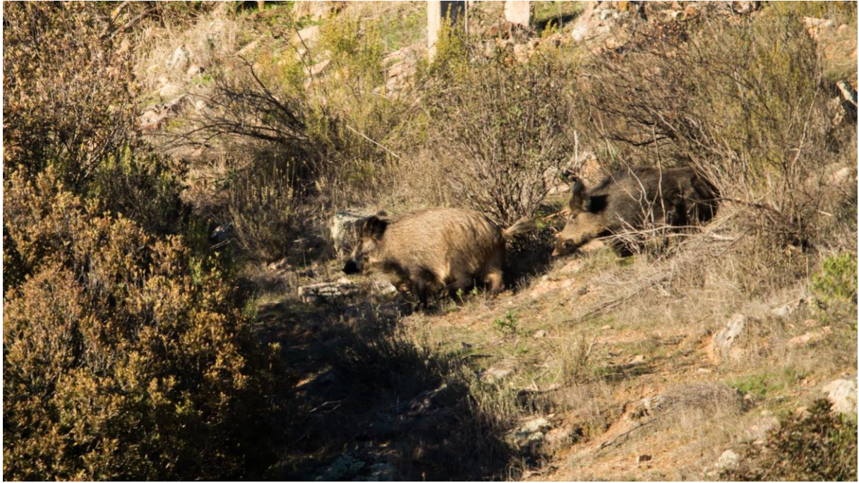
Wild Zwijn