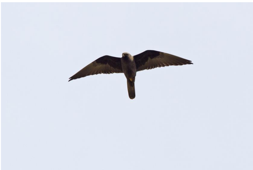
Eleonora's Valk | Sigri | Lesbos | Griekenland | 28 april 2019