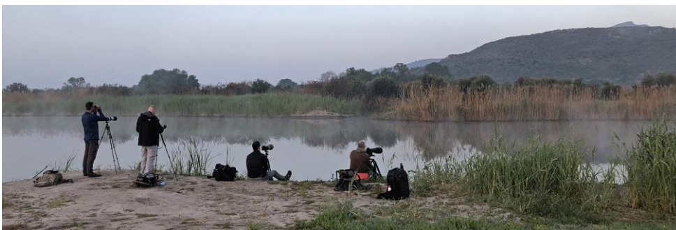
Ochtendglorie bij Metochi | Lesbos | 29 april 2019