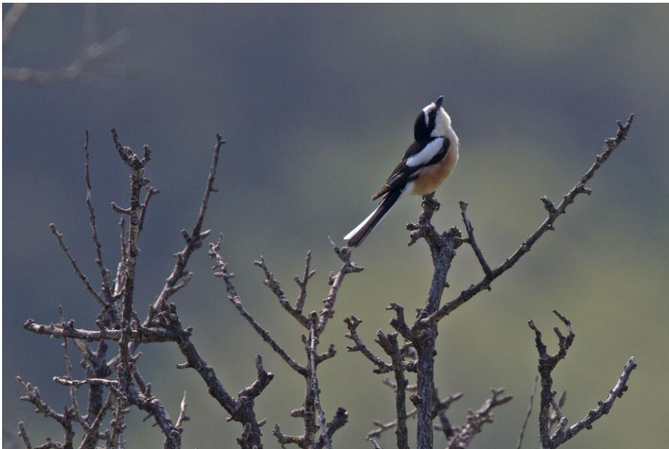
Maskerklauwier | Eftalou | Lesbos | Griekenland | 27 april 2019 | Foto: Harvey van Diek