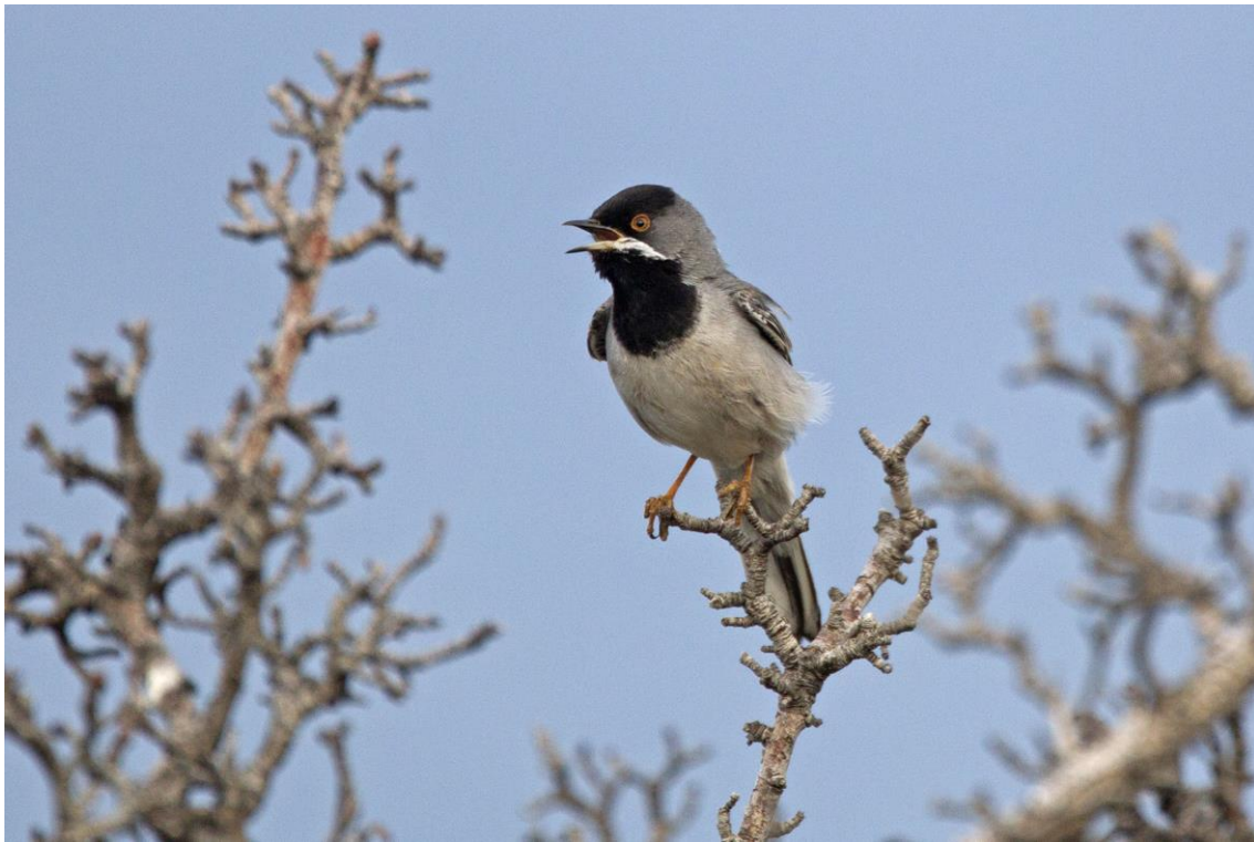
Ruppels Grasmus | Kavaki | Lesbos | Griekenland | 1 mei 2019