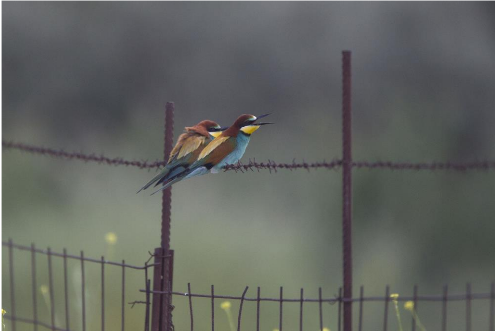
Bijeneters | Zoutpannen | Lesbos | Griekenland | 1 mei 2019 | Foto: Harvey van Diek