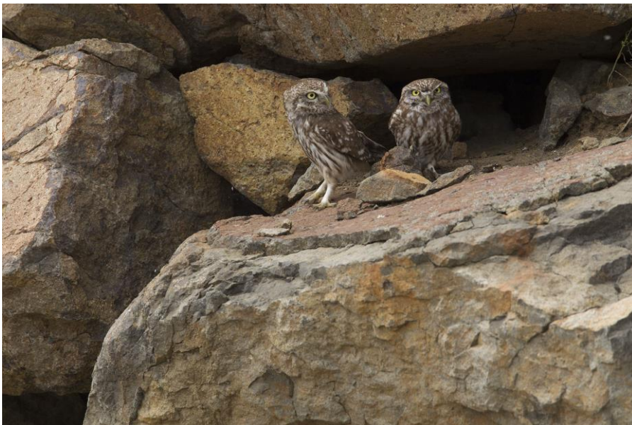
Steenuil | Mandamadus | Lesbos | Griekenland | 1 mei 2019 | Foto: Harvey van Diek

De dag sluiten we af bij de zoutpannen. Hier zijn o.a. Lepelaar en Breedbekstrandloper gemeld, maar die zitten in een verboden gebied, dus daar willen we niet in. Twee schitterende Roodpootvalken vliegen vlak langs en laten zich minutenlang heel goed bekeken. Het wordt nog beter als een van de deelnemers vanuit de auto een Sporenkievit in de zoutpannen ontdekt. Wat een soort! Helaas duikt hij vrij snel achter een randje, zodat niet iedereen hem ziet. Het avondeten bestaat uit banaan en chips (Pringles) en een van de deelnemers weet te vertellen hoe Pringles gemaakt worden (en niet voor de eerste keer). Hilariteit bij de anderen. Een ouzo bij thuiskomst ('zonder ijs want dan krijg je meer', weet een van de andere deelnemers te vertellen) smaakt voortreffelijk.