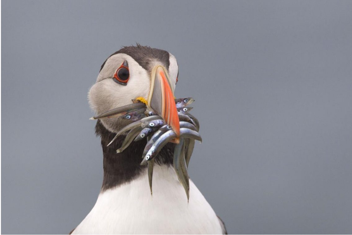
Papegaaiduiker | The Farne Islands | 18 juni 2019