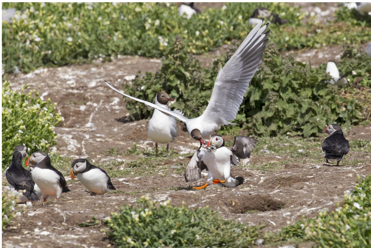
Brutale rakkers die Kokmeeuwen | Inner Farne | Engeland | 18 juni 2019 | Foto: Harvey van Diek

Met een klein wandelclubje maken we in de omgeving van het hotel nog een avondwandeling. Wat een mooi avondlicht! De Ringmus en Roodborst zijn nieuw voor de lijst.