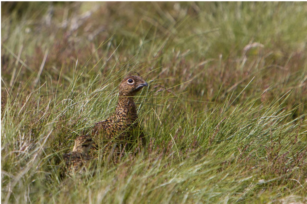
Een vrouwtje Schots Sneeuwhoen met jong | Lammermuir Hills | Schotland | 20 juni 2019

Na de lunch rijden we naar Lammermuir Hills op zoek naar het Schots Sneeuwhoen. Eenmaal op de juiste plek aangekomen is het een kwestie van speuren naar kopjes boven het heideveld uit. Al snel wordt de eerste gevonden en volgen er nog veel meer. Het waait stevig in dit open landschap dus de truien en jassen blijven aan. Regelmatig zien we ook jonge Schots Sneeuwhoenders die stiekem proberen weg te sluipen. Gelukkig ook nog jodelende Wulpen en een Watersnip. Onderweg naar huis pikken we nog een verdwaalde Kalkoen in een weiland op. Lachen! Weer terug in het hotel geniet bijna iedereen van een overheerlijke lasagne met salade en een biertje. Het is de laatste avond dus tijd om de soort van de trip te bespreken. Bijna iedereen vindt toch de Papegaaiduikers met visjes in de snavel het hoogtepunt van deze trip. En ze zijn natuurlijk ook helemaal geweldig!