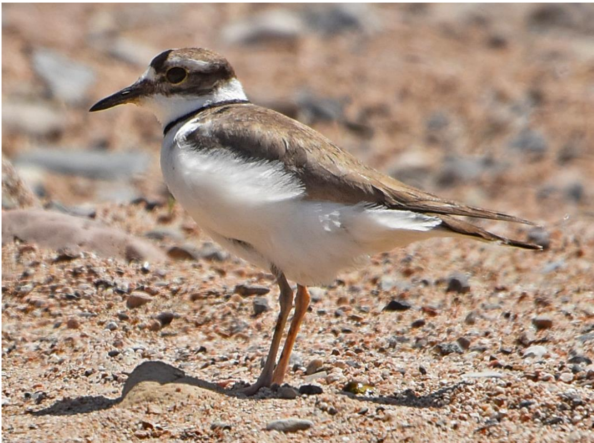
Long-billed Plover De Quinlong River herbergt de soort nog steeds, maar voor hoe lang...?