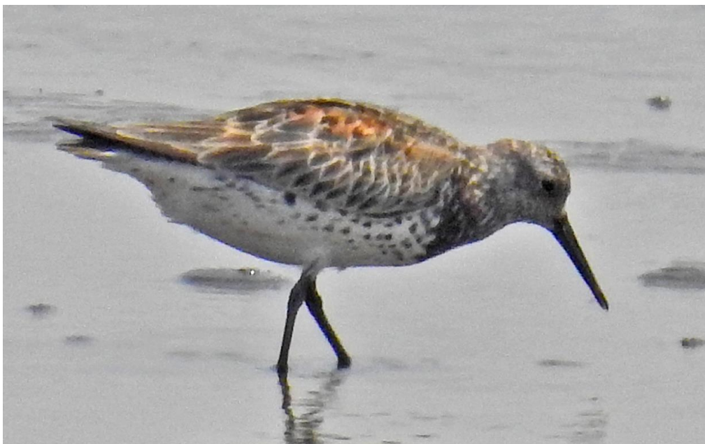
Grote Kanoet

Net voor Binhaizen (onze eerste overnachtingslocatie) vonden we de min of meer verwachte Oriental Storks, die hier verrassend genoeg met meerdere paren broeden op hoogspanningsmasten. Na het inchecken bij het hotel en lunch wilde we eerst de grote plas bezoeken voor de eenden, die elk moment weg zouden kunnen trekken. Gelukkig zaten er, naast een reeks andere eendensoorten nog 20 Siberische Talingen en 20 Bronskopeenden. Daarnaast maakte we hier kennis met een aantal algemene soorten als Dwerggors, Maskergors en Graszanger (die heel anders klinkt dan de onze!). Andere hoogtepunten van de dag waren 100+ Poelruiter, 2 Grey-headed Lapwings, Black-capped Kingfisher, onze eerste Goudlijster, een massa Bladkoningen en 2 Pallas Rietgorzen.