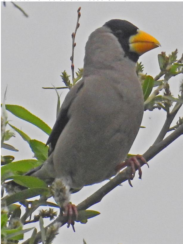
Japanese Grosbeak

Leuke aantallen verwachte soorten, 1-2 Boskoekoeken, 2 Goudlijsters, een overvliegende Petsjora Pieper, 2 Mongoolse Piepers, maar liefst 5 Japanse Grosbeaks in een groep met een Chinese Grosbeak en de eerste Rosse Gorzen.