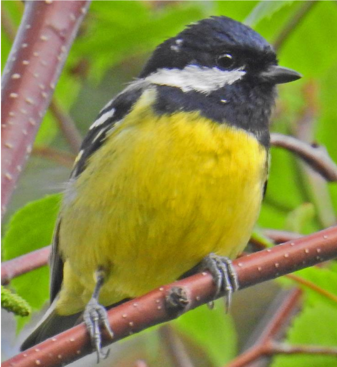
Yellow-bellied Tit