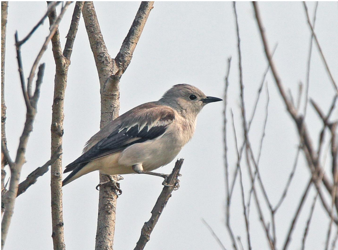
Daurische Spreeuw vrouw