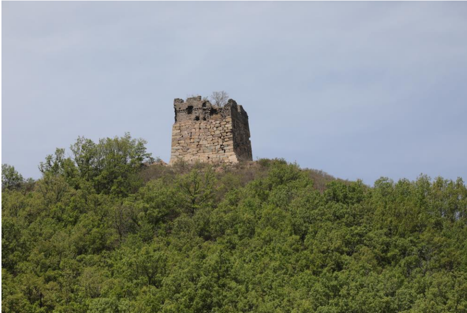
Wachtoren, onderdeel van de Chinese Muur