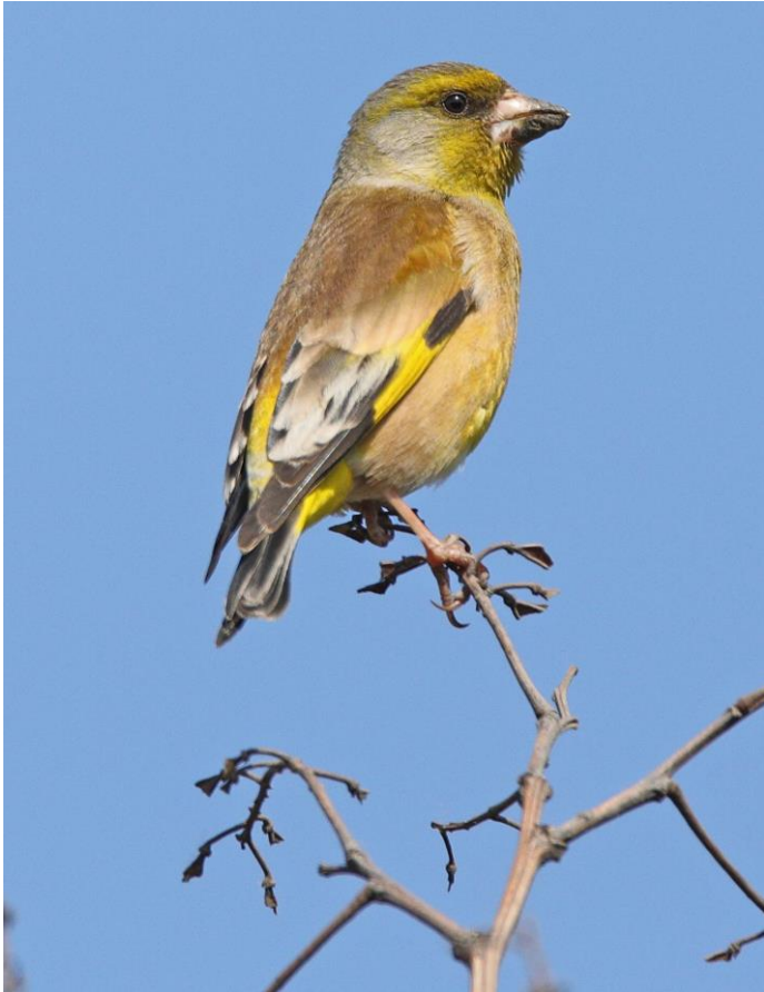
Oriental Greenfinch man