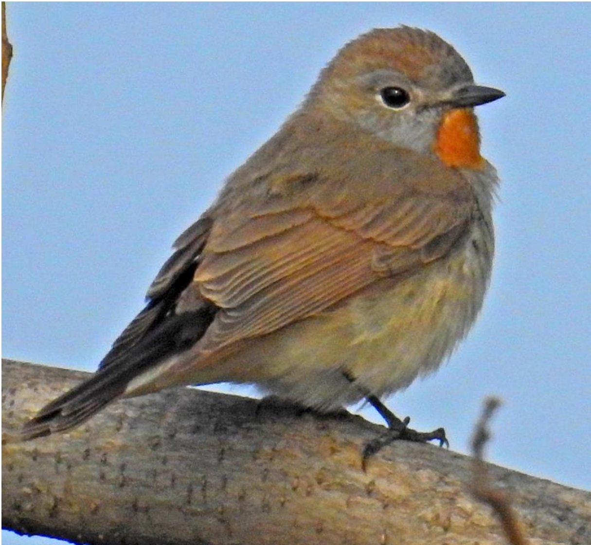
Taigavliegenvanger adult man De algemeenste vliegenvanger op deze reis, met Bruine als goede 2 e .

Geen echte fall, maar afgelopen nacht is er goede aankomst geweest. We zagen ongeveer 40 Vale Lijsters, 3 Daurische Spreeuwen, een Grey-backed Thrush en een Bruine Lijster in de gully, ongeveer 40 Yellow-rumped Flycatchers, ongeveer 30 Taigavliegenvangers, 50+ Blauwe Nachtegalen, de eerste Chinese Karekiet, ongeveer 10 Swinhoes Boszangers, veel Pale-legged Leaf Warblers, Bruine Vliegenvangers en zeer veel Bruine Boszangers.