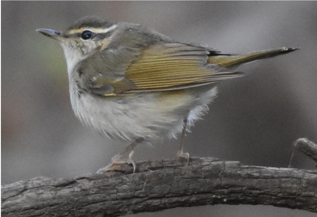
Pale-legged leaf-warbler Een algemene 'Phyllo' op Happy Island.