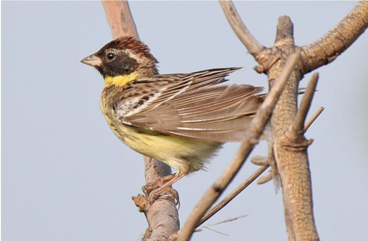
Wilgengors 2 e kj man

In de laatste 20 jaar is meer dan 95% van de Wereldpopulatie van deze soort 'verdwenen' (gevangen voor consumptie in China). Van recent nog een algemene soort, nu met uitsterven bedreigt ... Happy Island en omgeving is waarschijnlijk de makkelijkste en meest zekere plek om de soort nog te zien.