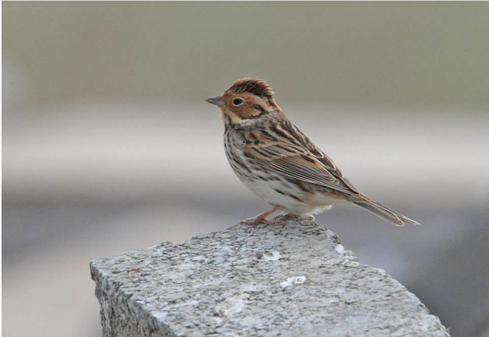
Dwerggors Gelukkig nog een algemene soort tijdens deze reis.