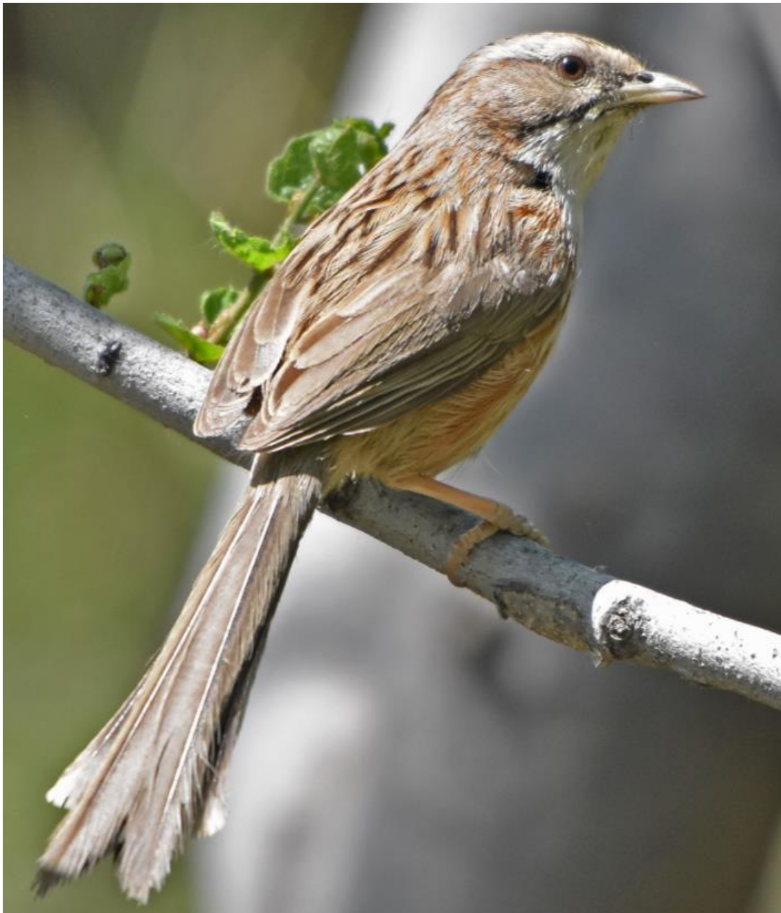
Chinese Hill Warbler

Een endemische soort van Oost-China die niet altijd gemakkelijk te vinden is, maar ook dit jaar weer prima in beeld kwam.