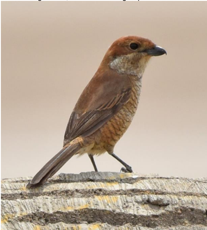
Bull-headed Shrike, 2 e kj vrouw

Het gebied 'Stone River' (een eiland in de delta van de rivier, direct aan de kust) moet het ook hebben van aankomst, dus ook hier geen grote aantallen en soorten. 2 Taigastrandlopers iets dieper landinwaarts in de feitelijke Stone River was een leuke vondst en misschien een betrouwbare plek in de toekomst. Misschien wel het meest spectaculair waren de honderden Witwangsterns die boven de rivier foerageerden, soms in dichte groepen.