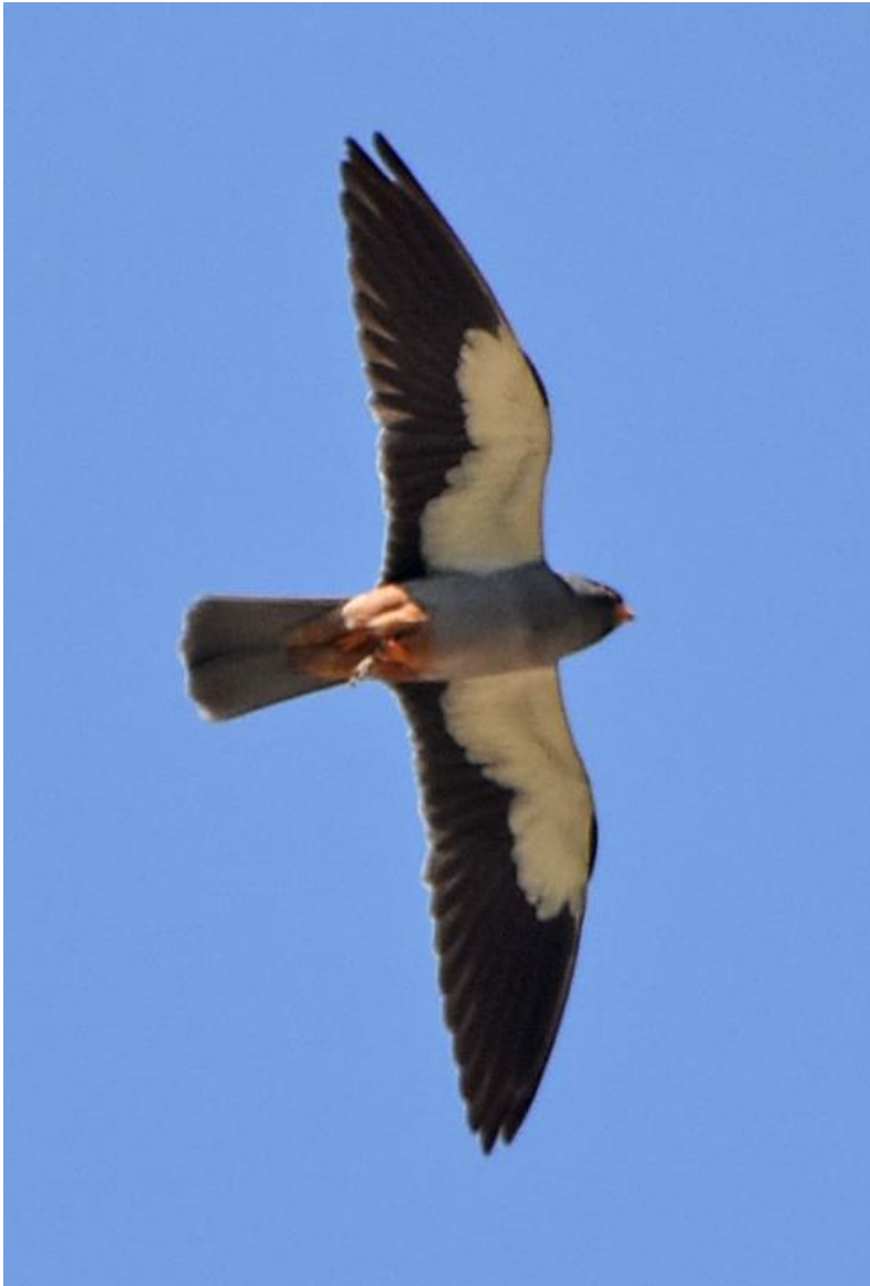
Amoervalk adult man