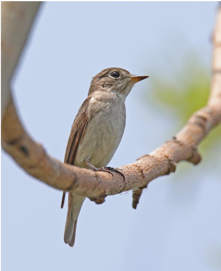
Bruine Vliegenvanger

Hoteltuin: 2 Chinese Grosbeaks; Seven Miles Sea: 3 Chinese Egrets, 1 Woestijnplevier naast tientallen Mongoolse; Tang he woods: Goudlijster; Magic Woods: Grey-faced Buzzard overvliegend, 2 Wilgengorzen; Happy Island: Mugimaki Flycatcher, 3 Geelbrauwgorzen in een groep Dwerggorzen.