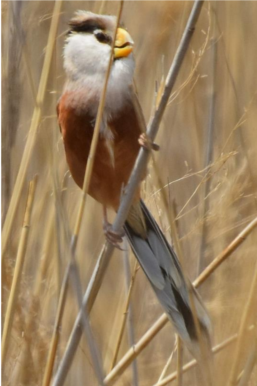
Reed Parrotbill

Een vroeg vertrek naar de mudflats; hoogwater was 6 uur. Ongelofelijke aantallen steltlopers bevinden zich dan langs de seawall w.o. duizenden Grote Kanoeten. Specialiteiten als Relict Gull, Asiatic Dowichter en Nordmann's Greenhanks lieten zich relatief eenvoudig vinden. Relict Gull was nog aanwezig met honderden ex, allen 2 e kj en een enkele 3 e kj. De adulte zijn door naar hun uiterst beperkt broedgebied in het binnenland. Reed Parrotbills lieten zich uitstekend zien op meerdere plekken in het Nanpu gebied. Op de 2 dagen rond Nanpu zagen we 30 soorten steltlopers! Andere van vele hoogtepunten waren een handvol Oosterse Vorkstaartplevieren, een Large Hawk-Cuckoo, Northern Brown Hawk-owl, een zuivere Naumanns Lijster, een vrouw Elisea's Flycatcher en een Pied Harrier. Na een zeer succesvol begin van onze trip vertrokken we in de middag naar Beidaihe.