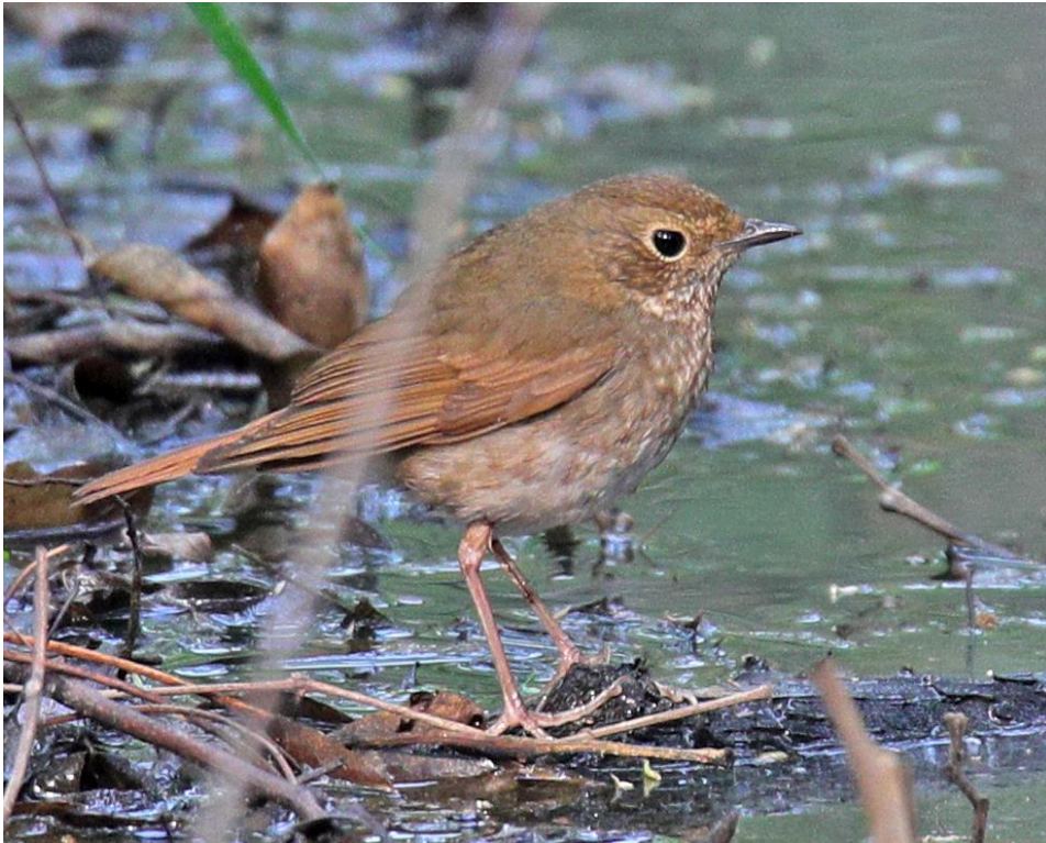
Rufous-tailed Robin

In de WP een extreme dwaalgast; op Happy Island een trouwe gast in de 'gully'.