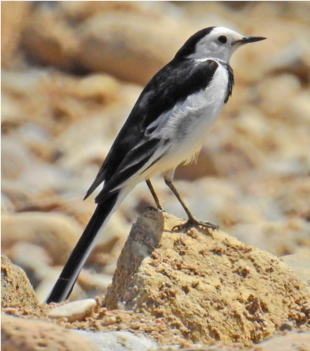
Amoerkwikstaart man

De typische soorten van Quinlong River kregen we allemaal te zien, afgezien van Ibisbill die er nog slechts incidenteel wordt waargenomen maar er niet meer broedt. 3 Mangrove Reigers, een Great Crested Kingfisher, 2 paar Long-billed Plovers met jongen, 2 Hill Pigeons, een Godlewski's Bunting, meerdere Weidegorzen, een Zwarte Ooievaar, een Steenarend, Amoervalken w.o. een nest bij onze lunchplek, Alpenkraaien, Rotszwaluw en ocularis Witte Kwikstaart. Op de terugweg hebben we de sandflats weer bezocht; er lag een dood White-breasted Waterhen, verder weer een Siberische Strandloper, Roodkeelstrandlopers en 3 Breedbekstrandlopers.