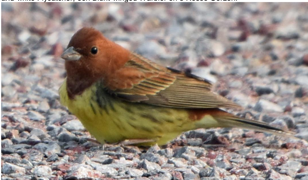
Rosse Gors adult man

Hoogtepunten vandaag 4 Asiatic Dowitchers, 2 Black-capped Kingfishers, een Japanse Pestvogel, een Bruine Lijster (schaars dit jaar), 4 Roodkeelnachtegalen (hoogste dagaantal), een vrouw Blue-and-white Flycatcher, een Blunt-winged Warbler en 3 Rosse Gorzen.