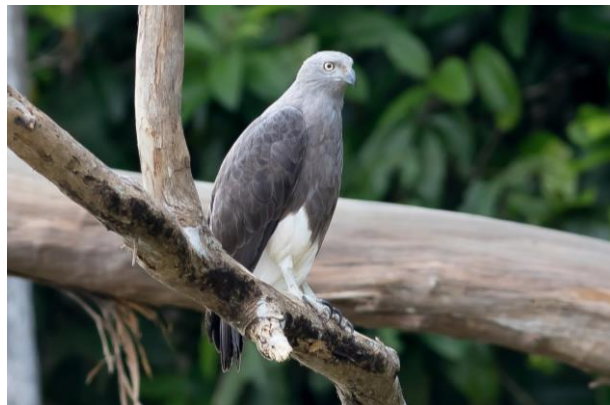
Storm's Stork & Lesser Fish Eagle, WM