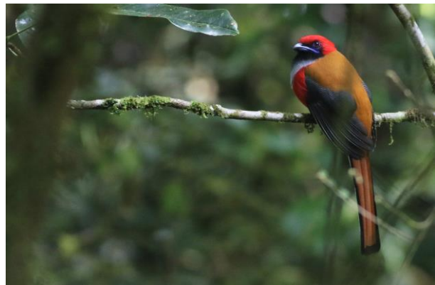
(Kijken naar) Whitehead's Trogon , SR