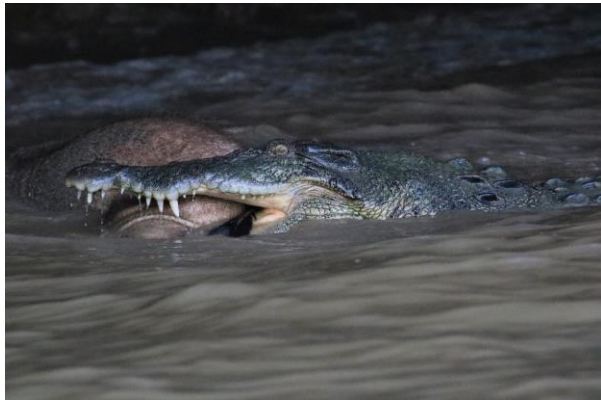
Chestnut-necklaced Partridge & Salt Water Crocodile, SR