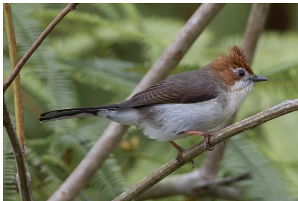
Whitehead's Spiderhunter & Chestnut-crested Yuhina, SR en WM