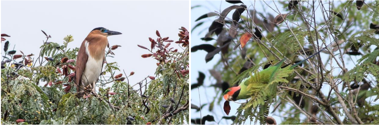
Nankeen Night Heron & Long-tailed Parakeet, WM en SR

We hebben nog wat tijd en besluiten een kijkje te nemen bij wat rijstvelden net buiten de stad. De soort die je hier mag verwachten is snel gevonden: een Striated Grassbird zit volop te zingen en laat zich in de scoop goed bekijken. Vanaf het moment dat we uit het busje stappen vliegen de Bosruiters ons om de oren, zeker 20+. Dan vliegt er plots ook een Yellow Bittern boven ons hoofd en vlak voor vertrek vindt Sjoerd tijdens een laatste scan een Oriental Reed Warbler die zich nog even leuk laat zien. Dan valt de avond en vertrekken we richting ons hotel. We besluiten in het hotel te dineren en dat blijkt helemaal geen slechte keus! Voor de eerste keer wordt er gelijst, en gaan we snel slapen voor onze vroege vlucht naar Sandakan de volgende ochtend.