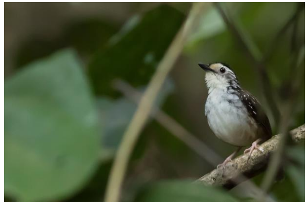
Blue-headed Pitta & Striped Wren-Babbler, SR & WM