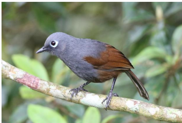
Whitehead's Broadbill & Sunda Laughingthrush, SR