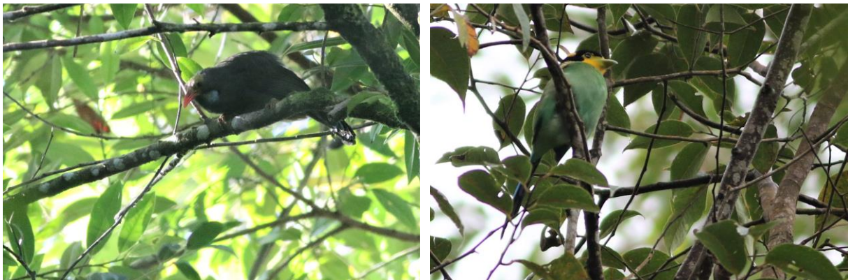
Bare-headed Laughingthrush & Long-tailed Broadbill, SR

Zo'n drie uur later arriveren we in de Crocker Range. Deze bergketen ligt wat lager dan Kinabalu NP, waardoor er soorten zitten die niet op de berg zitten. Mountain Barbet is niet één van die soorten, maar op de berg hoor je deze soort alleen maar laag in het dal zingen. Als we uitstappen horen we deze soort en het duurt niet lang voor we hem in beeld hebben. Helaas is het inmiddels wel hard gaan regenen en dat blijft een beetje het beeld deze dag hier. Het mag de pret echter niet drukken, want in de tuin van het Rafflesia informatiecentrum vermaken we ons uitstekend met soorten als Black-and-crimson Oriole, Bornean Bulbul en Brown Barbet. Voor de lunch pakken we nog even een mooi groepje Long-tailed Broadbills mee en horen we alvast Bornean Barbet zingen. Tijd voor lunch!