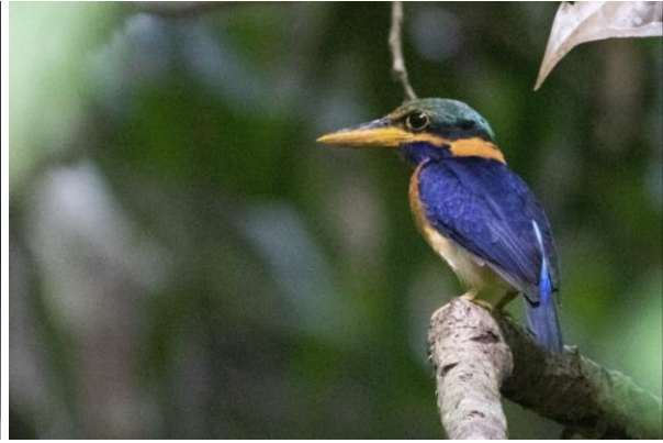
Yellow-eared Spiderhunter & Rufous-collared Kingfisher, SR