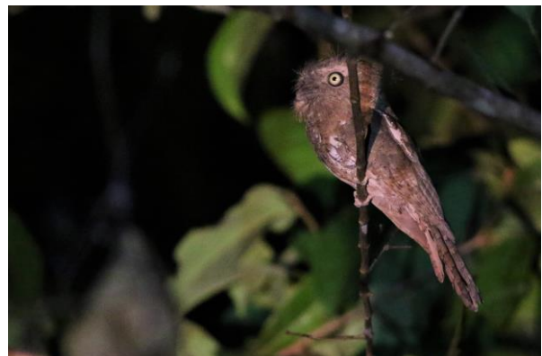
Bornean Blue Flycatcher & Blyth's Frogmouth, WM & SR