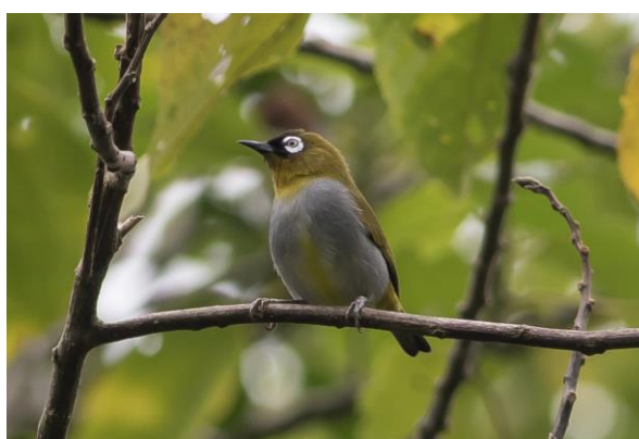
Mountain Blackeye en Black-capped White-eye, SR en WM