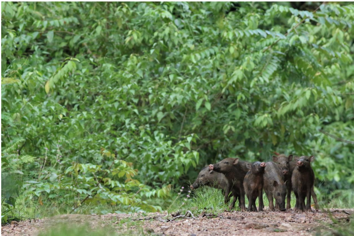
Beardid Pigs in Tabin, SR