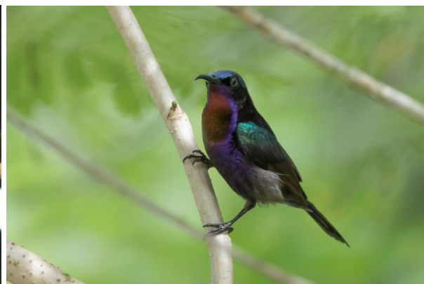
Bornean Bristlehead & Copper-throated Sunbird, SR en WM