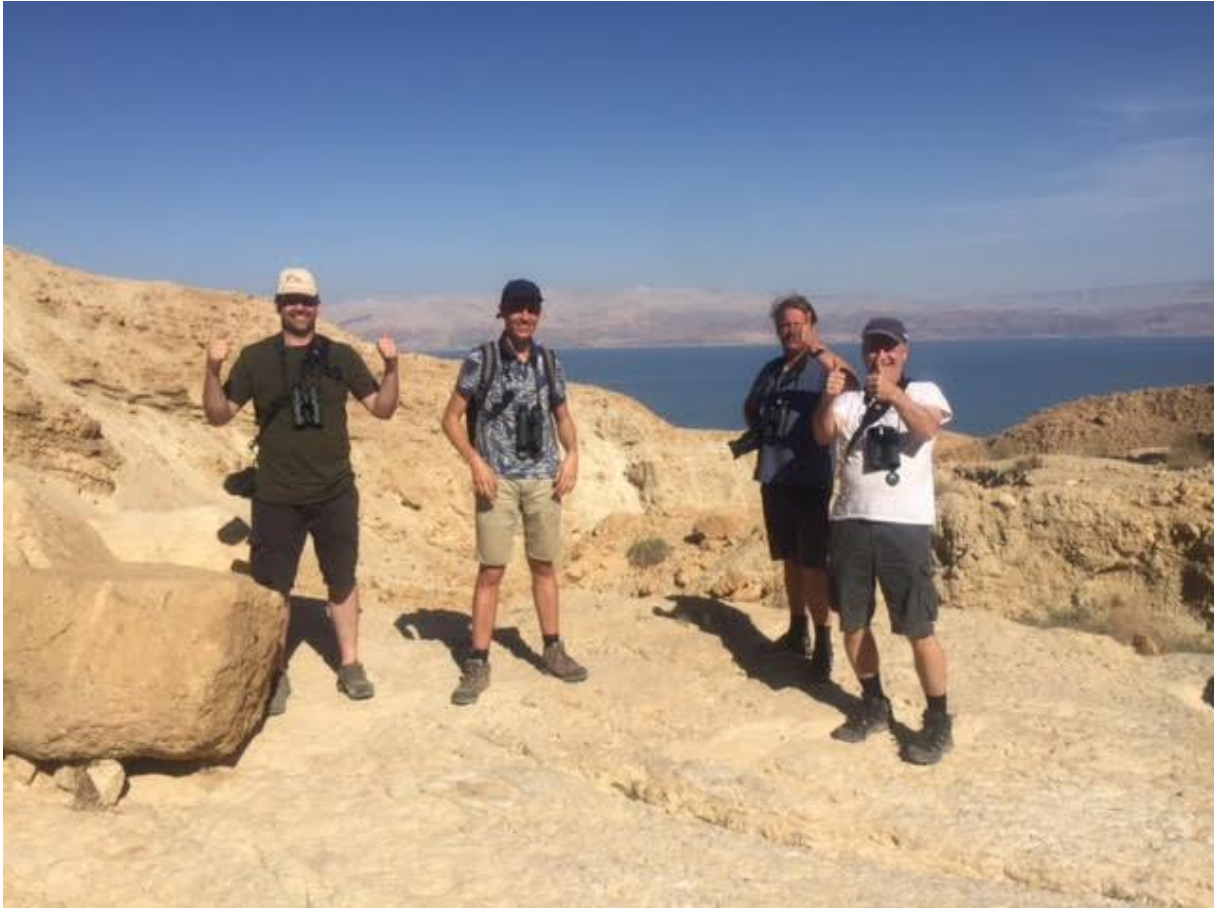
Gelukkig na het zien van Sinairoodmus!

Tevreden gaan we richting ons hotel in Arad, een provinciaal stadje een stukje landinwaarts en met een frisser klimaat. We genieten van ons laatste avondeten samen, en smeden plannen om er een lange avond van te maken. Een half uurtje later zijn we weer op weg richting Dode Zee, waar een Palestijnse Bosuil zijn kaken stijf op elkaar houdt helaas, maar waar we bij een kibbutz maar even moeten rondrijden voordat we onze eerste Nubische Nachtzwaluwen al horen. We proberen eerst de vogels te voet te vinden in zijn tamariskhabitat. Dit wil niet, en daarna proberen we het met de auto op een zandpad, waar we verschillende individuen mooi zijn, met een individu dat langdurig naast de wagen poseert. Dit is een uiterst zeldzame soort in het West-Palearctisch gebied, met slechts nog ongeveer 40 vogels, waarvan we die avond minstens de helft horen of zien. Een mooie afsluiter van de laatste avond van de reis!