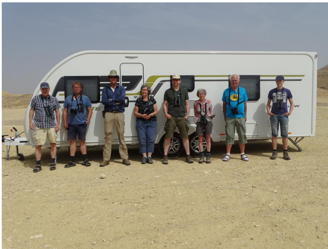
Uit de wind en in de zon