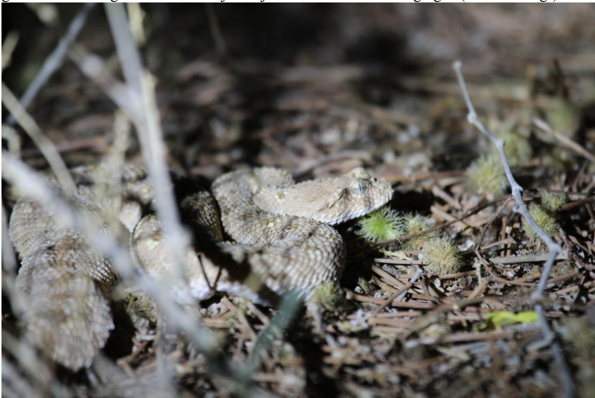
Arabische Hoornadder

Langzaam wordt het donker en we gaan nog even een kijkje nemen bij de cirkelvelden van Yotvata, waar we o.a. nog drie Bergkalanderleeuweriken zien. We wachten totdat het helemaal donker is, en lopen wat rond over een zandweg rond de velden. Plots horen we een luid gesis, we dachten in eerste instantie dat er een irrigatielijn was gebroken, maar het bleek een Arabische hoornadder te zijn, die waarschijnlijk uit de omringende zandduinen was gekomen om in de velden te jagen naar prooi. De schubben van de soort maken een sissend geluid als deze tegen elkaar aanwrijven tijdens kronkelende bewegingen ('sidewinding').