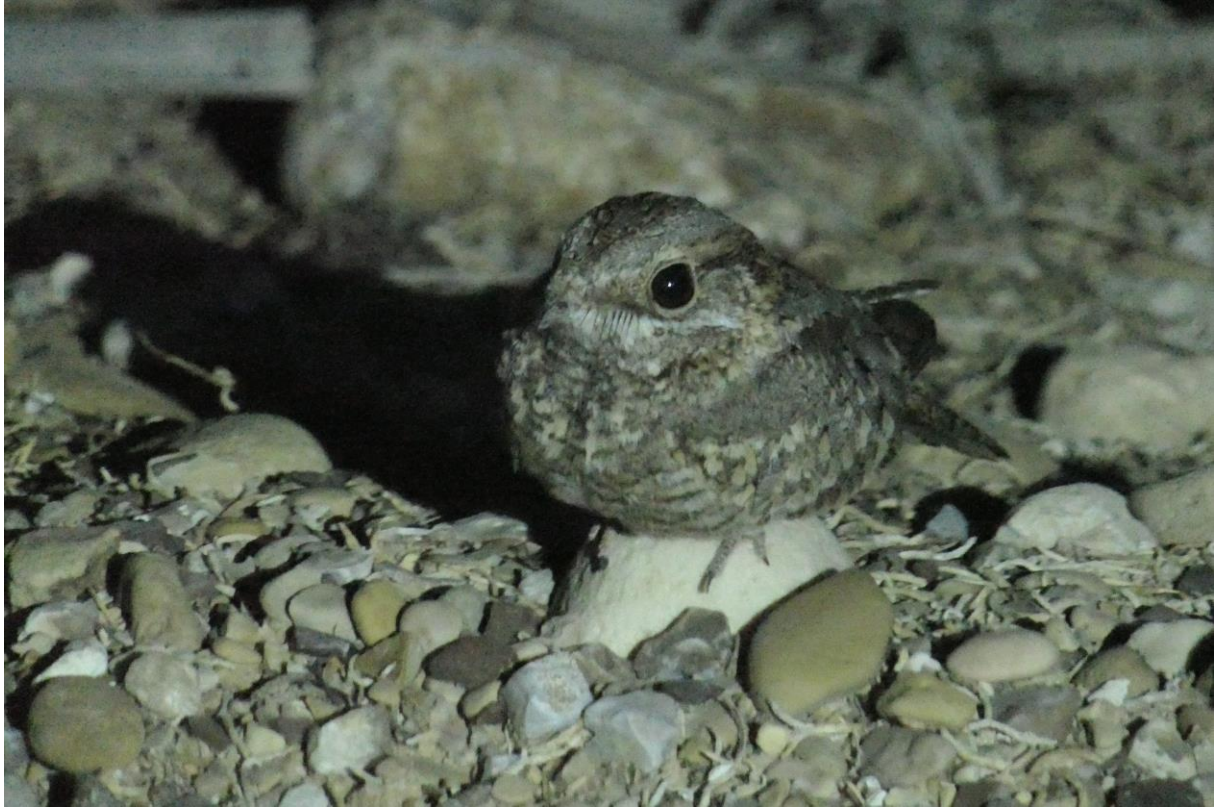
Nubische Nachtzwaluw