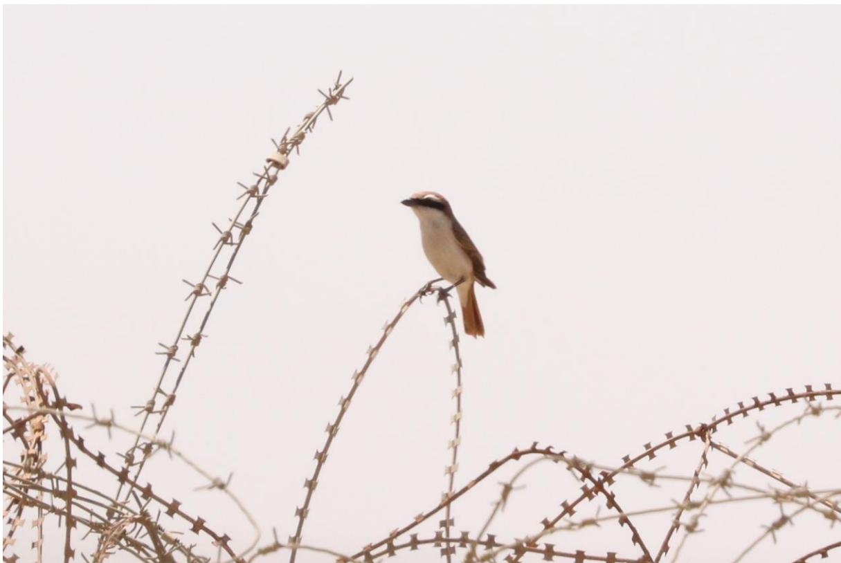
Turkestaanse Klauwier, foto: Joost Vogelzang

paartje Maquiszangers dat zich ontzettend mooi op een rotshelling liet zien. Groepjes Woestijnzandhoenders vliegen voorbij en laten zich nu wel prima bekijken. Daarna brak het festijn pas echt los, want we vonden een groep leeuweriken, met veel Temminck's strandleeuweriken en enkele zingende Rosse Woestijnleeuweriken. De leeuweriken lieten zich prachtig van dichtbij fotograferen. Dit was niet het geval met een overvliegende Diksnavelleeuwerik, die zich alleen liet horen. Het kon de pret niet drukken, want ondertussen kwam er dwars door de woestijn een grote zwarte wagen op ons afgereden, met daarin Hadoram Shirihai, de bekendste Israelische ornitholoog himself, en Guy Kirwan, die ons tipten over een Turkestaanse Klauwier die even verderop zat te zingen.