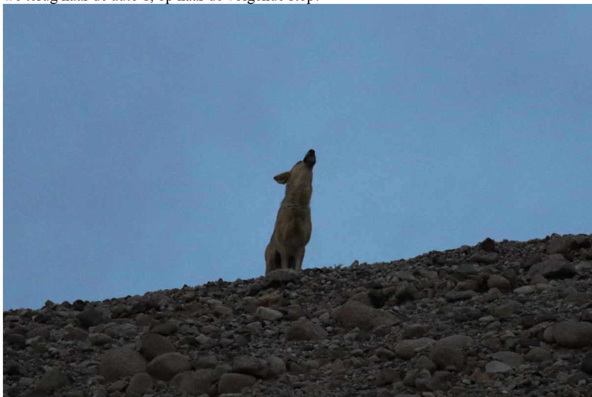
Gouden Jakhals, foto: Joost Vogelzang

Na verschillende keren plekken te hebben bezocht waar Gestreepte Gors was gezien, hadden we de soort nog niet. Deze ochtend bezochten we een relatief onbekende wadi ten noorden van Eilat. Dit bleek een goede keuze! We lopen langzaam door de wadi naar boven. Het eerste dat opvalt is een grote hoeveelheid Arabische Zandpatrijzen, we zien er ongeveer 15, waaronder een stel dat de daad der daden verricht enkele meters voor ons! We stoten ook een tweetal Grielen op, die luid roepend een eind verderop weer landen, om niet meer gezien te worden. Na een half uurtje zoeken horen we uit een zijtak van de wadi een interessante zangvogel; even de telescoop erop, en we zien een prachtige man Gestreepte Gors! De vogel is behoorlijk schuw, zoals de meeste van zijn soortgenoten, en verdwijnt al snel over een rotshelling. Een zoektocht levert alleen nog een Blauwe Rotslijster op, maar tevreden keren we terug naar de auto's, op naar de volgende stop!