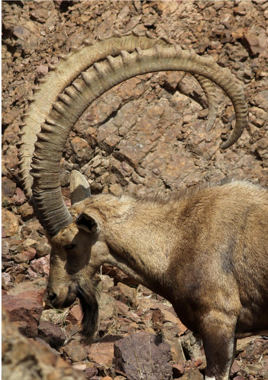
Man Nubische Steenbok, foto: Joost Vogelzang

Dik tevreden over onze ochtend reizen we door naar het monument van Ben Gurion, dat aan de rand van een enorme kloof staat. Rond het monument vele bosjes die leuke treksoorten kunnen opleveren. Het was redelijk rustig, maar we zagen wel onze eerste van vele Zwartstaarten en Woestijnleeuweriken en een mannetje Palestijnse Honingzuiger probeerde de show te stelen. Aan de rand van de kloof zagen we Nubische Steenbokken, en tussen de steenbokken vloog een prachtige man Rouwtapuit van rotsblok tot rotsblok, terwijl Tristrams Spreeuwen de kloof overstaken. Tussen de roofvogels die over de kloof vlogen vonden we Arendbuizerd en twee Aasgieren. Een uitstapje naar de andere kant van de kloof werd bovendien beloond met een prachtige waarneming van Havikarenden die samen met Vale Gieren in de rotswanden nestelen. Ook de lucht wordt in de gaten gehouden, wat een groep trekkende roofvogels oplevert met ertussen Steppearend, Dwergarend en de eerste van vele Steppebuizerden.