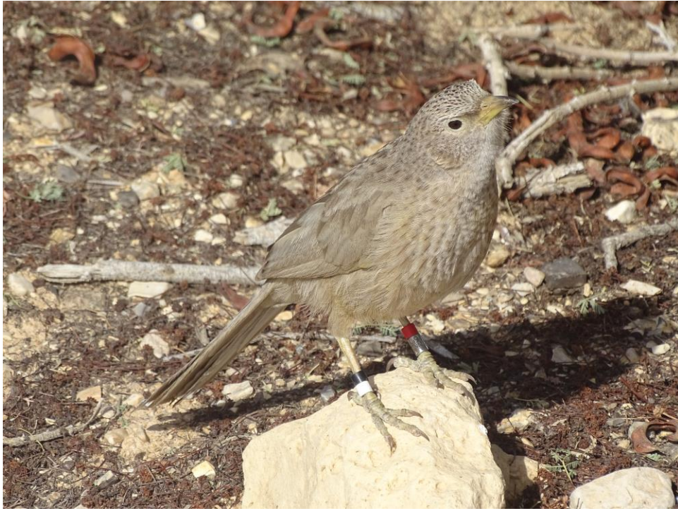
Arabische Babbelaar