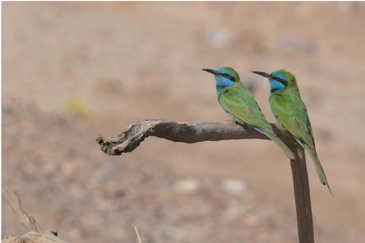
Kleine Groene Bijeneter, foto: Walter Appels

gaat vissen en langdurig voor de foto poseert.