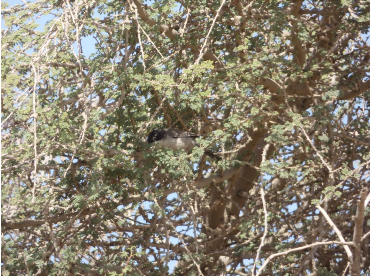
Arabische Zwartkop

We moeten verder en stoppen bij de Dode Zee in een gebied met tamarisken. Hier vinden we enkele vliegerige Moabmussen, die zich met moeite goed laten zien. Ook horen we uit een kanaal een enorm kabaal komen en even later staan we oog in oog met een prachtige zingende Indische Karekiet. In het Engels heet de soort Clamorous Reed-Warbler, wat letterlijk zoiets betekent als Rumoerige Rietzanger!