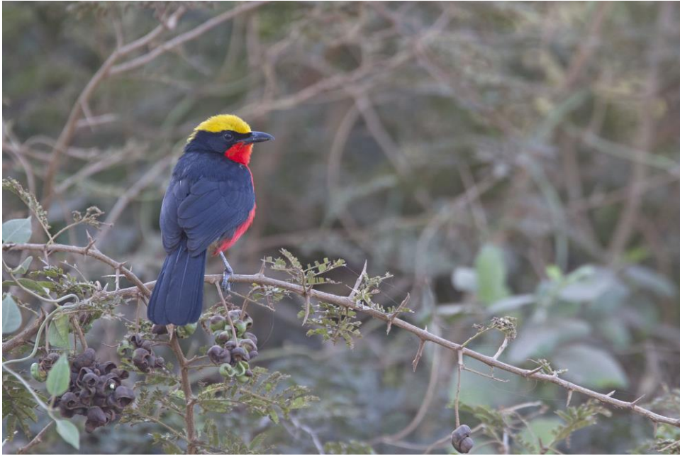
Een Yellow-crowned Gonolek verveelt nooit | Gambia | 8 jan 2019