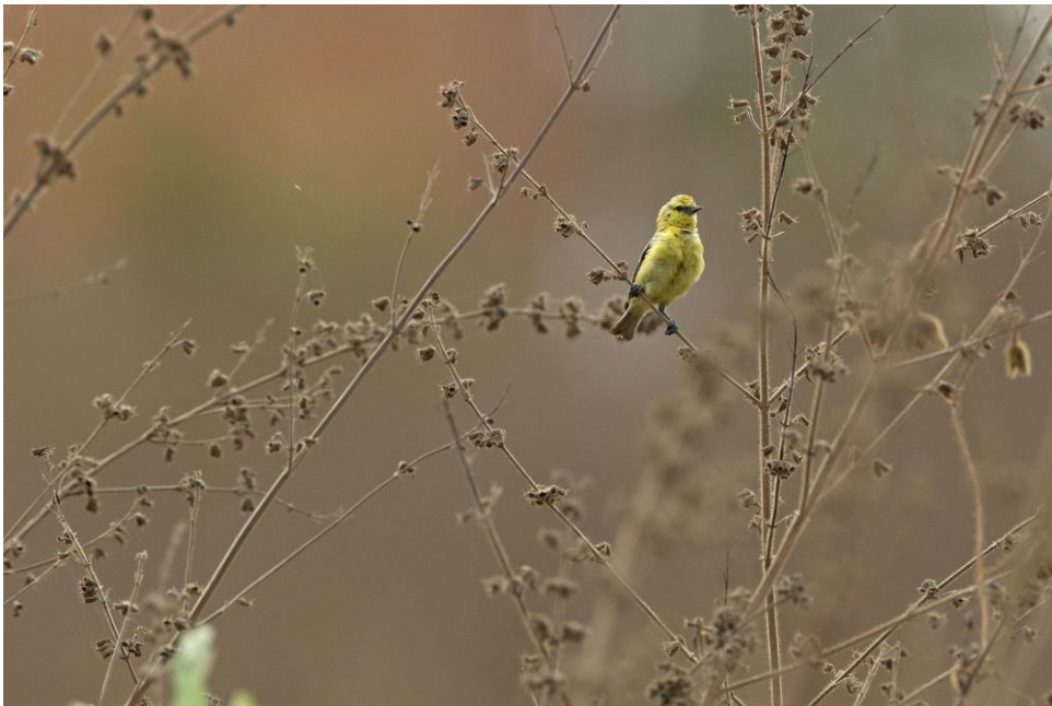
Subtiel en klein, de Yellow Penduline Tit | Gambia | 11 jan. 2019 | Foto: Harvey van Diek

Met het mooie avondlicht liepen we een heel eind over het strand naar de lagune van Tanji. Hier veel meeuwen, sterns, steltlopers en uiteraard ook veel Gambianen die zich vermaakten op het strand. Een mooie afsluiter van de dag. We kwamen wat later bij ons hotel aan dan normaal en konden vrijwel meteen aansluiten bij het avondeten.