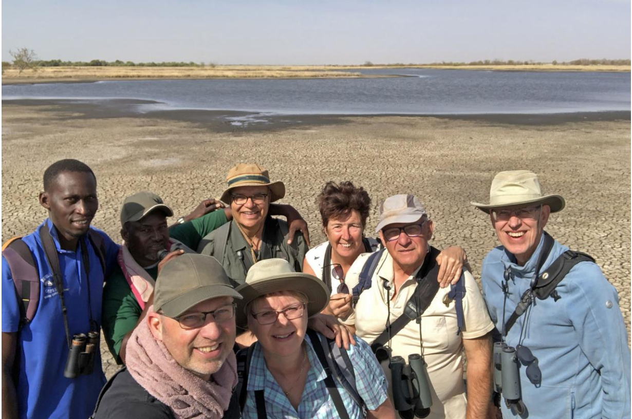
Bijna een vast onderdeel van de vakantie, de groepsfie | Gambia | 20 jan. 2019