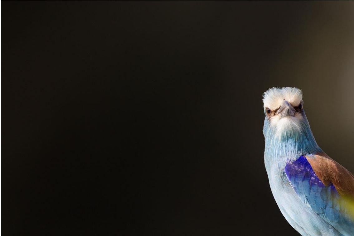
Abyssinian Roller | Gambia | 15 jan. 2019