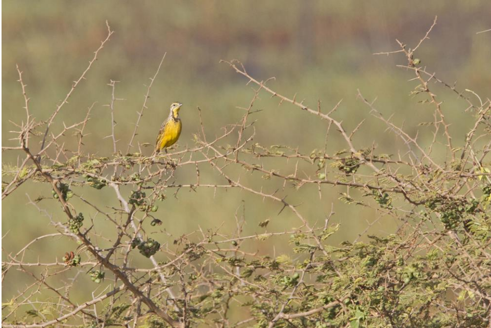
Tegenwoordig zeldzaam in Gambia, de Yellow-throated Longclaw | Gambia | 13 jan. 2019

werden gemaakt. Dit was een dag met zo'n 10-15 Ospreys (Visarenden) die her en der rondhingen. Langs de vloedlijn de eerste Oystercatchers (Scholeksters) en Turnstones (Steenlopers) die we ook uit Nederland kennen. Een flinke groep Sanderlings (Drieteenstrandlopers) bewoog als een wit ritmisch tapijt mee met de vloedlijn. Aan het strand namen we bij een lokaal tentje een heerlijk koel drankje. De hitte was verzengend. De lunch namen aan de rivier met mangrovebos en jagende Gull-billed Terns (Lachsterns). Aan het einde van de middag toen de hitte wat afnam gingen we nog naar een plek met Black-headed Plovers. Op het lokale voetbalveld stonden er drie. Even later kwam er een groep kinderen voetballen, en weg waren de plevieren.