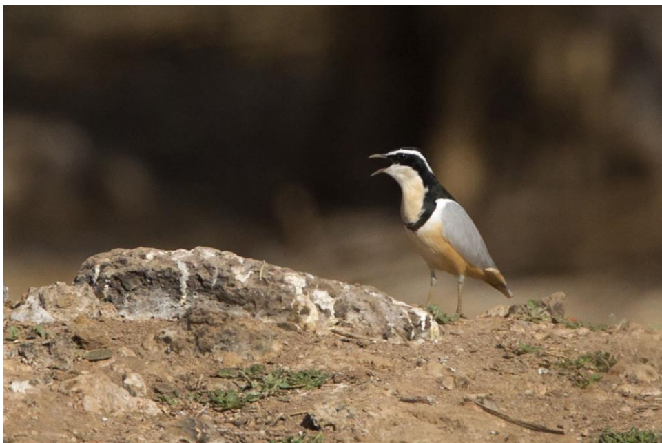
Een onbetwist hoogtepunt, de charismatische Egyptian Plover | Gambia | 17 jan. 2019

Een echte fieldlunch namen we bij een meertje waar meestal Egyptian Plovers (Krokodilwachters) rondhangen. Nu echter niet. Een eind verder hadden we meer geluk! Bij een plas langs de kant van de weg stond een lokale gids ons op te wachten. Hij brabbelde iets tegen Modou over dat de Egyptian Plovers twee dagen geleden waren vertrokken, maar even later wees hij er toch eentje aan! Een droomsoort voor velen zat gewoon aan de overkant van de plas. Wat een ontzettend mooie vogel. Veel mooier dat de plaatjes op en in het vogelboek bekenden de reisgenoten. Even later vloog hij op naar de andere kant van het water en bleek er nog eentje te zitten. Vooral in vlucht zijn ze echt spectaculair. Zeer tevreden lieten we de twee Krokodilwachters met rust en vervolgden onze weg naar Georgetown waar we rond een uur of zes aankwamen. Een prima accommodatie met airco, licht en water.