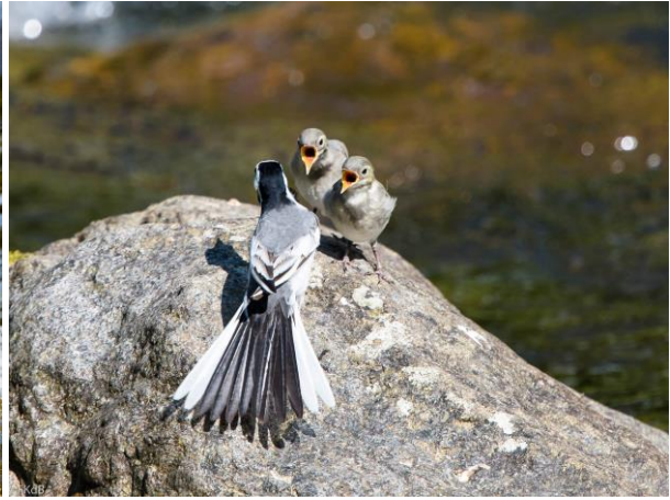
Familie Witte Kwikstaart