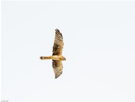
Steppekiekendief, adult vrouw

Een volgende uitgebreide stop doen we bij het beroemde sovjet monument waar de Alpenkraaien en Waterpiepers ons om de oren vliegen. Ook zien we hier de eerste sneeuw waardoor een laag overvliegende Steppekiekendief prachtig van onderen wordt belicht.