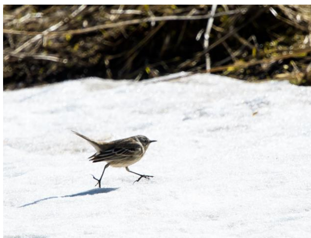
Waterpieper ssp Coutellii