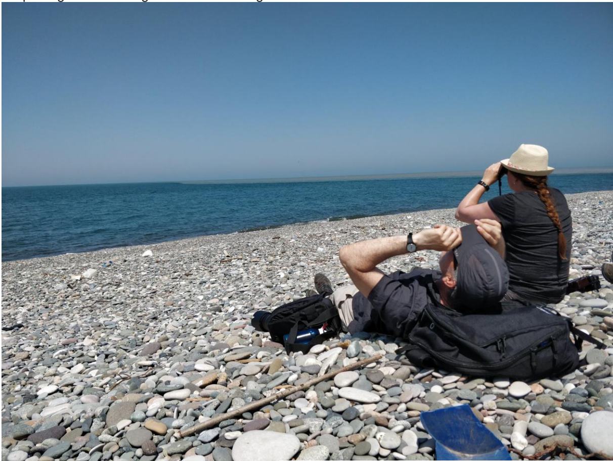
Easy birding op het strand van Batumi

Door het mooie weer is de delta grotendeels leeg. Maar het stikt er van de Grauwe Klauwieren. Op bijna elk struikje zit er wel 1 of meer. We zien een groepje Witoogeenden, altijd leuk. Een Kleine Klapekster gaat er eens goed voor zitten en we zien een flits van een Sperwergrasmus. Purperreigers en Ralreigers laten zich wel goed zien.