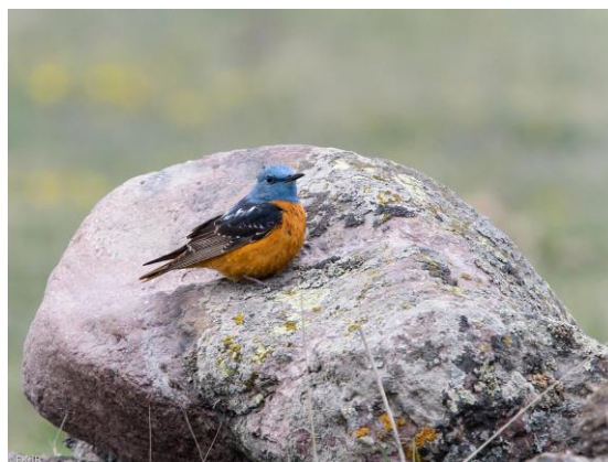
Rode Rotslijster (man)