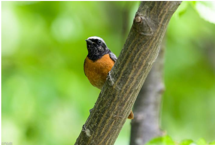
Gekraagde Roodstaart (man)

De eerste soorten worden vanuit de auto gezien. Huis-, Boeren- en Gierzwaluwen, een Armeense Meeuw. Bij onze eerste stop, zit een prachtig mannetje Gekraagde Roodstaart ons op te wachten, die uitgebreid gaat zitten poseren voor de foto.