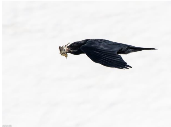
Raaf met waterpieper

Spectaculair is ook een Raaf die voorbij komt met een Waterpieper in zijn snavel. Net over de pas wordt de auto half verduisterd door een Vale Gier die vlak boven de weg cirkelt. Nu nog de Lammergier, wat toch wel een doelsoort is voor velen. Een paar bochten verder staat een groep Engelsen. We lijken op een haar na een Lammergier gemist te hebben. Maar ons geduld wordt niet lang op de proef gesteld: BAM, er komt een mooie adult voor de berg langszweven. Vergezeld door een stel Vale Gieren en even later ook nog een Steenarend. Lekker hoor. Welkom in de Kaukasus! Van de Engelsen vernemen we wel dat de big five (Kaukasisch Korhoen, Kaukasisch Sneeuwwhoen, Grote Roodmus, Witkruinroodstaart, Kaukasische Bergtjiftjaf) lastig wordt, omdat het al een tijd veels te goed weer is, waardoor de vogels veelal alweer naar hun broedgebieden hoger op de berg zijn vertrokken.