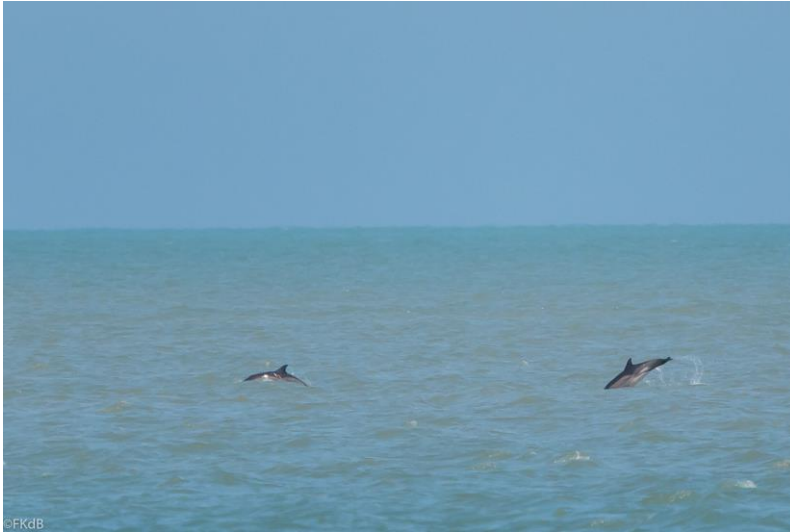
Zwarte Zee Gewone dolfin