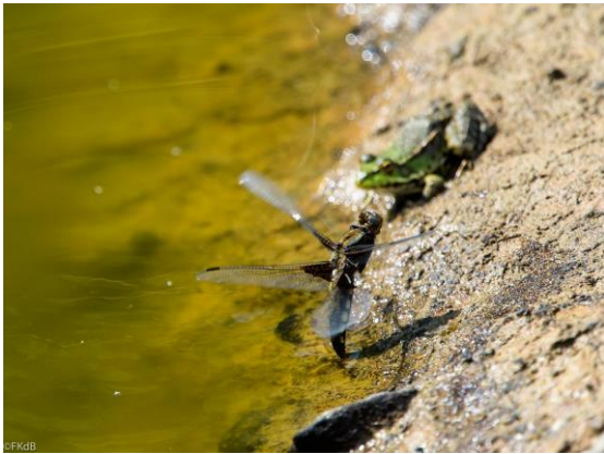
Platbuik (vrouw, ei-afzettend) met groene kikker op achtergrond

Als we eind van de middag op het terras aan het strand zitten komt de uitsmijter van de reis langs: een Griel vlak over het strand!