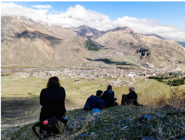
Uitzicht over Stepantsminda (Kazbegi)

Gelukkig hebben we een groep met goede conditie want de klim blijkt best pittig, maar ook zeer lonend. We zien een leuk paartje Rode Rotslijster. Opeens horen we vlak boven ons het geluid wat we inmiddels allemaal kennen van de Berghoenders. Dat klinkt dichtbij. Zo dichtbij dat enkelen onder leiding van de gids besluiten om nog iets hoger te klimmen, waar zij de berghoenders op enkele tientallen meters afstand kunnen bewonderen en ze vlak over de hoofden scheren. Meestal laten de hoenders zich niet beter dan een stipje in de telescoop zien (" Daar zit er 1! Nee joh, dat is een steen. Nee echt, hij beweegt....."), dus wat een fantastische ervaring om deze vogels van het hooggebergte van zo dichtbij te mogen bewonderen.