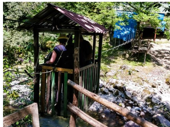
Mtirala National Park

We maken een mooie wandeling. We zijn op zoek naar de spechten, maar die blijken zeer lastig.. Wel zeer veel Zwartkoppen, Winterkoninkjes en Merels, maar geen spechten. Tijdens de lunch horen we wel meerdere spechten roffelen en een roepje, maar we krijgen niks te zien.