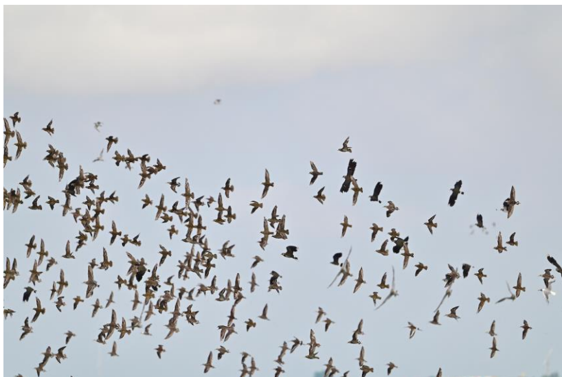
Groepen Steltjes in de Ezumakeeg, foto: Olga Heijtmajer

Na deze stop rijden we naar ons hotel bij Groningen en genieten we van een lekker avondmaal.