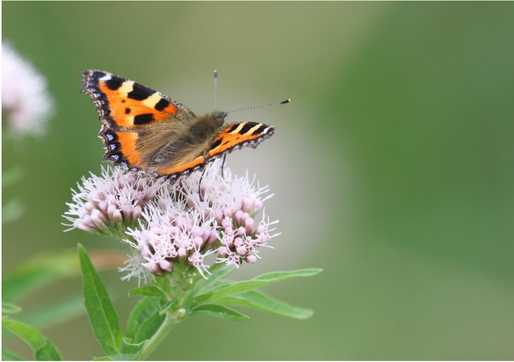
Kleine Vos is in het noordelijkste deel van Nederland nog een relatief gewone verschijning, Foto: Noël Vanderlinden

Na de Ezumakeeg bezoeken we een nieuw uitkijkpunt, aan de noordkant van de noordelijke Ezumakeeg. Vanaf het punt is het warm en vrij rustig, maar we zien een mooie grote groep Lepelaars en foeragerende Watersnippen. Door de telescoop kunnen we in de verte tussen de Grauwe Ganzen en soepganzen minimaal twee Sneeuwganzen ontwaren, die eruit springen door hun zwarte vleugelpunten.