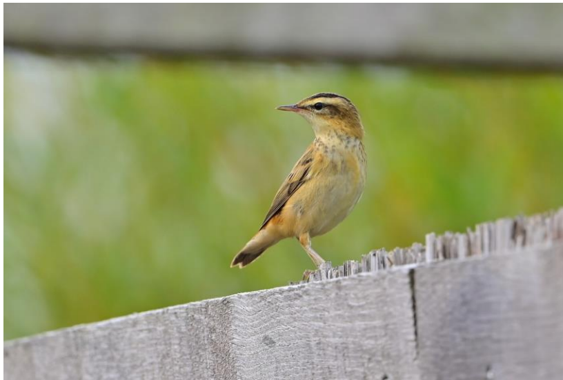
Rietzanger juv

Na het Jaap Deensgat genieten we van koffie met vlaai bij Suyderoogh en maken daarna een korte boswandeling door het Ballastplaatbos, waar we toch nog wat bossoorten zien zoals Grote Bonte Specht, Roodborst en Winterkoning. Lunch genieten we bij het bezoekerscentrum en een enthousiaste boswachter komt ons nog even een overzicht geven van alle zeldzaamheden van de Lauwersmeer van de afgelopen jaren!