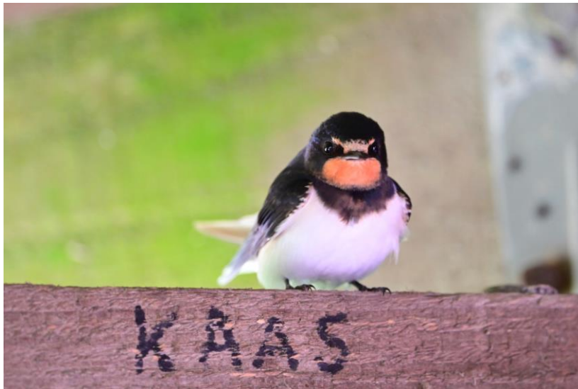
Een Oerhollands plaatje