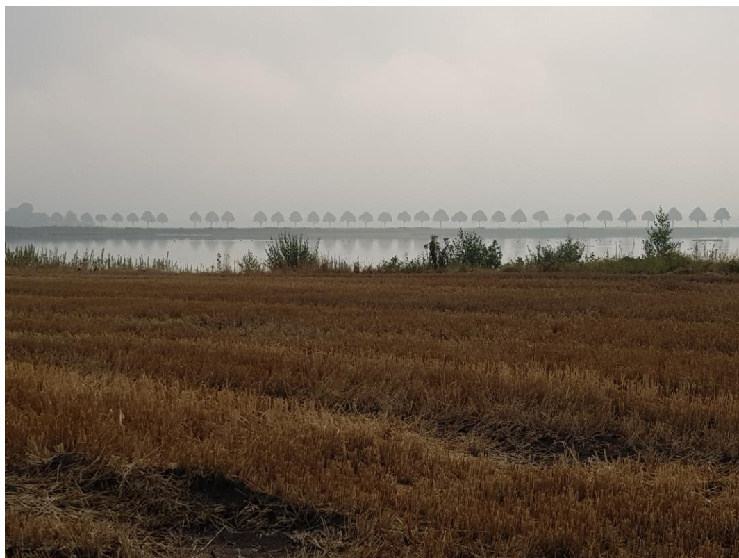
De Graanrepubliek van Oost-Groningen