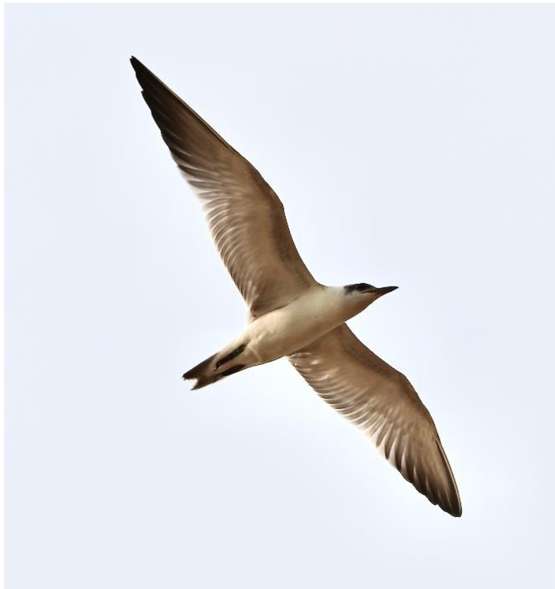
Juv Lachstern, door: Olga Heijtmajer