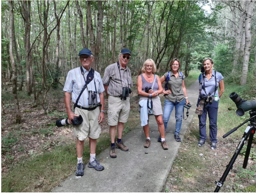
De groep in het Ballastplaatbos, foto: Paul van Els