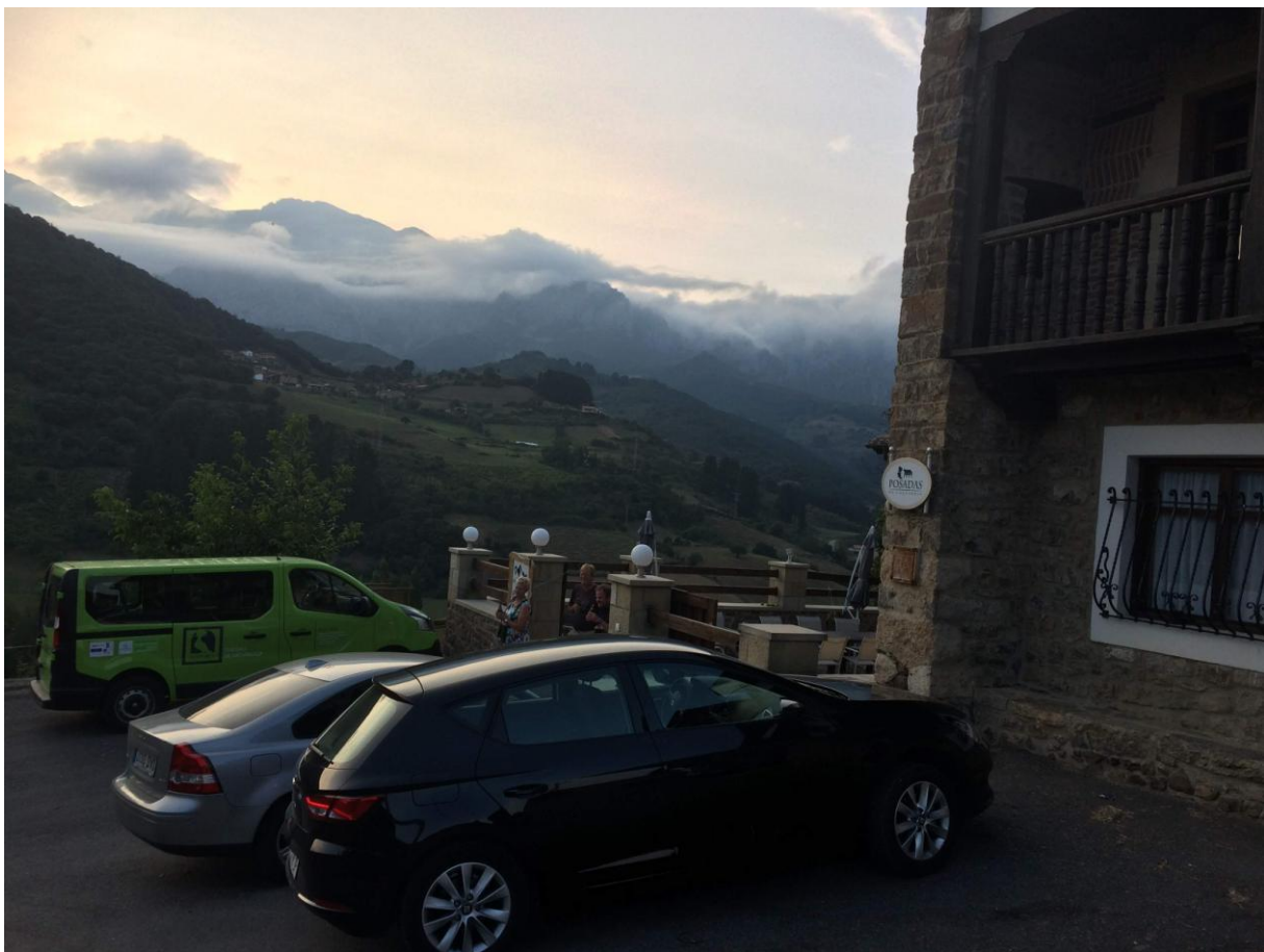
Uitzicht op de Picos de Europa vanaf ons eerste hotel

De vlucht van Schiphol naar Bilbao verliep soepel en volgens schema. Ik had mijn groene bus reeds in de parkeergarage van het vliegveld klaar staan dus we konden meteen vertrekken richting de Picos de Europa. Naarmate we dichterbij het Cantabrisch Gebergte kwamen werd het landschap steeds mooier. Toen we even stopten om de benen te strekken werd de eerste Dwergarend ontdekt en onderweg zagen we ook de eerste Vale Gieren. Er zouden nog vele volgen in de loop van de reis. Ons eerste onderkomen was charmant rustiek en had een prachtig uitzicht over de bergen en omliggende valleien. Bij aankomst werden we verwelkomd door onze vriendelijke en behulpzame gastheer en –vrouw en tevens door een overvliegende Slechtvalk. Onder het genot van een koel biertje zochten we in het schitterende berglandschap naar meer vogels. Het biologische diner was lekker en tussen de gangen door heeft iedereen zich voorgesteld. Het was meteen gezellig en dat zou zo blijven tot het einde van de reis.