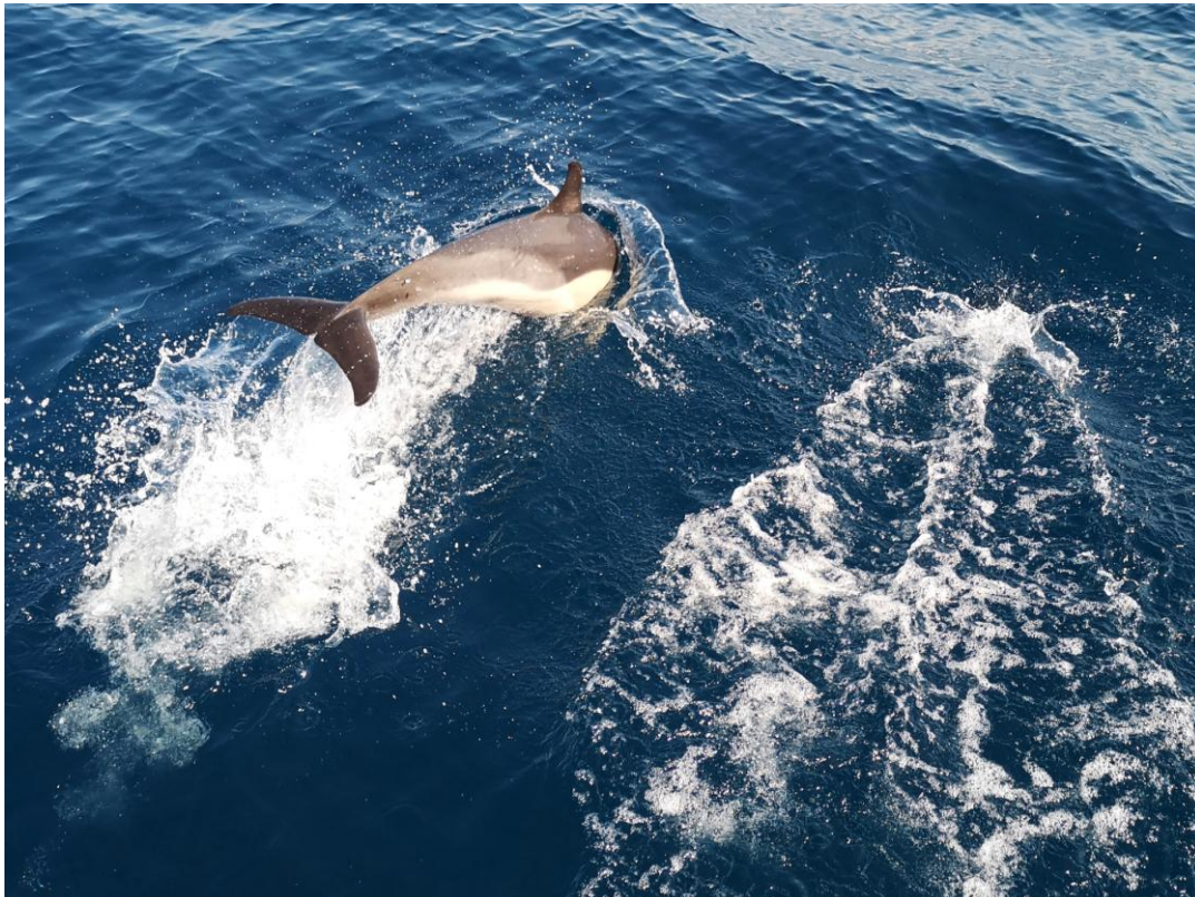
Gewone Dolfijn