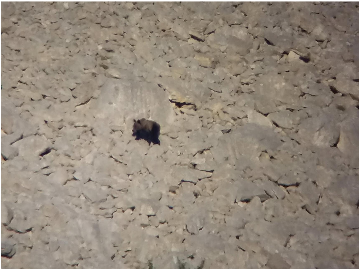
Bruine Beer