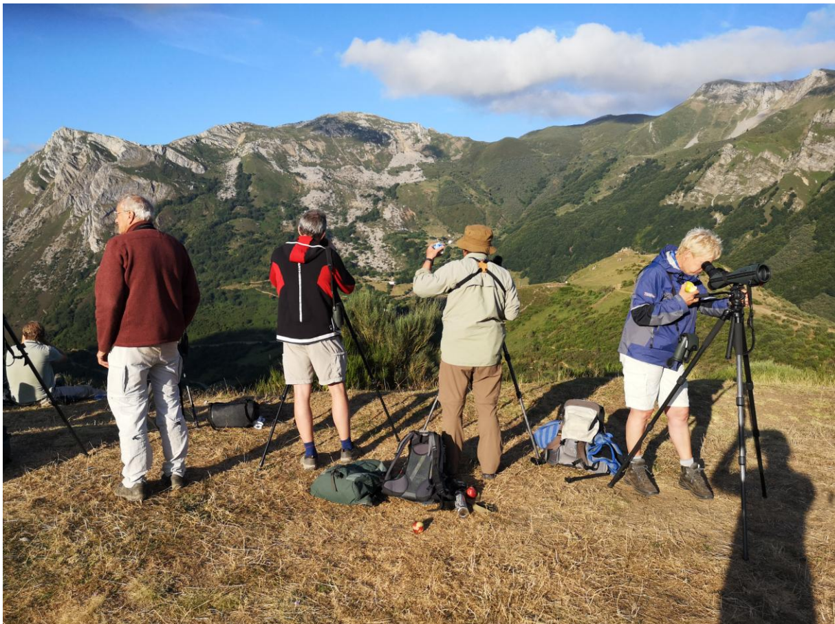
Speuren naar Bruine Beer