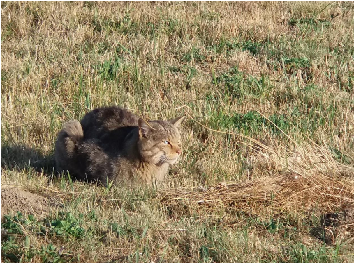
Wilde Kat