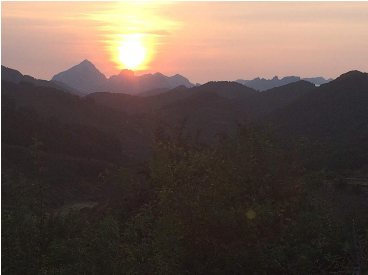
Zonsondergang in het Cantabrisch Gebergte