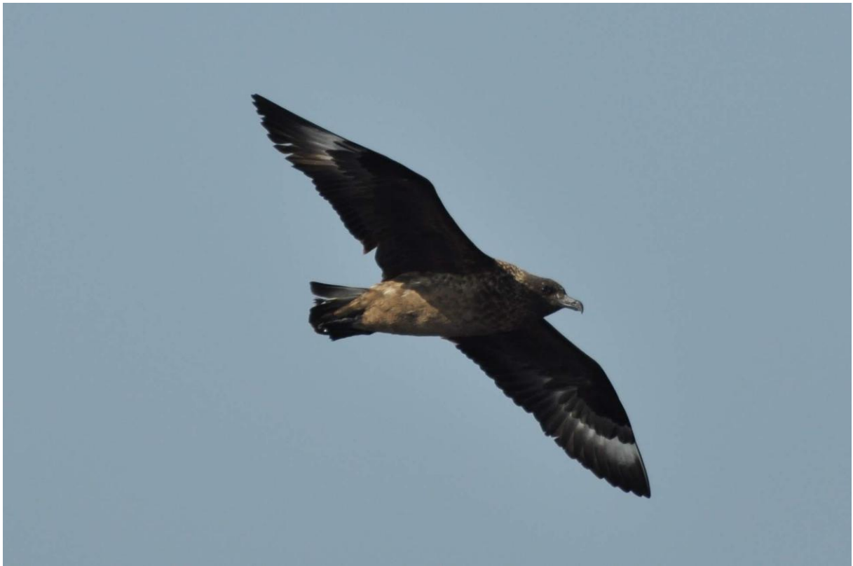
Grote Jager