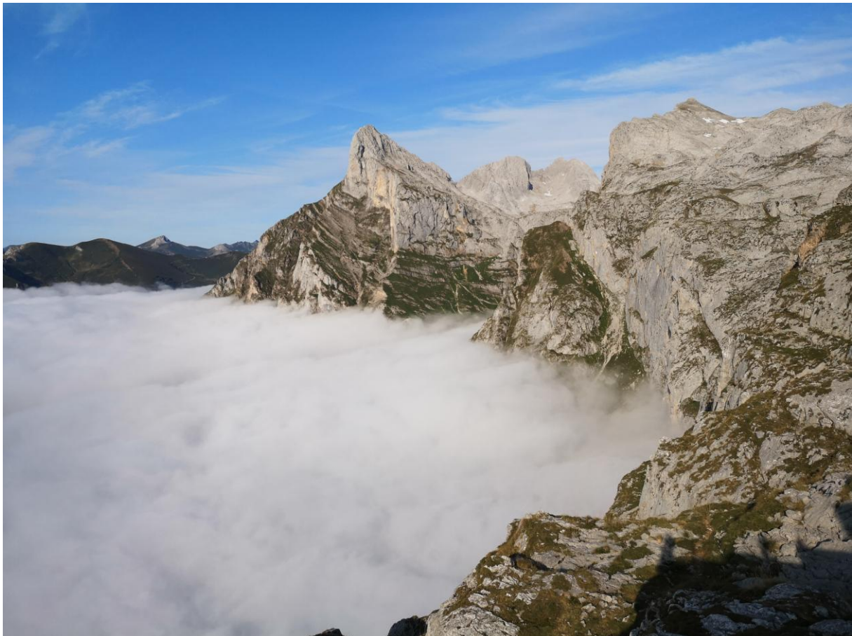
Schitterend hooggebergte van de Picos de Europa