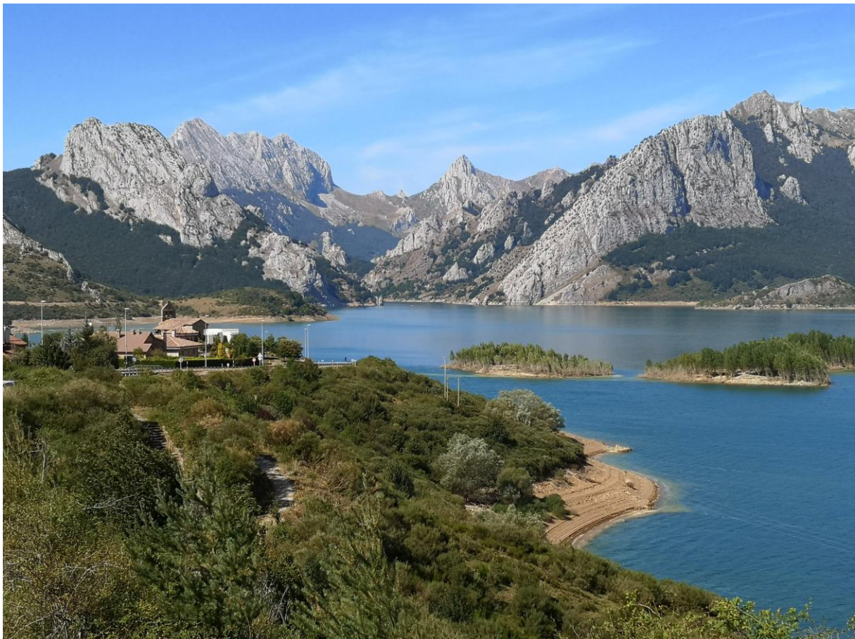
We hebben bijna de hele week mooi weer gehad

De laatste dag al weer... Er was vandaag nog tijd om te vogelen want de vlucht vertrok pas in de middag, maar het weer werkte niet mee. Voor het eerst regende het, en niet zo'n beetje, het regende bijna de hele dag door. Tot nu toe hadden we prachtig weer gehad dus we mochten niet klagen. We reden naar het getijdegebied van Santoña en schuilden in een vogelkijkhut. Daar konden we Krakeend, Zwartkopmeeuw, Grote Stern, Wulp, Steenloper en Kluut noteren. Bij het dorpje zagen we bovendien Georde Fuut, Tureluur, Dodaars en de jachttechniek van de Kleine Zilverreiger. We wilden eigenlijk een wandeling maken maar het begon steeds harder te regenen dus we besloten te gaan lunchen in een bar/restaurant. We aten bijna allemaal Horsmakreel. Tijdens deze laatste lunch werd ik als gids in het zonnetje gezet. Ik bedankte op mijn beurt alle deelnemers voor de supergave en bovenal gezellige reis. We kwamen mooi op tijd aan op het vliegveld van Bilbao waar we afscheid namen. Tot de volgende keer!