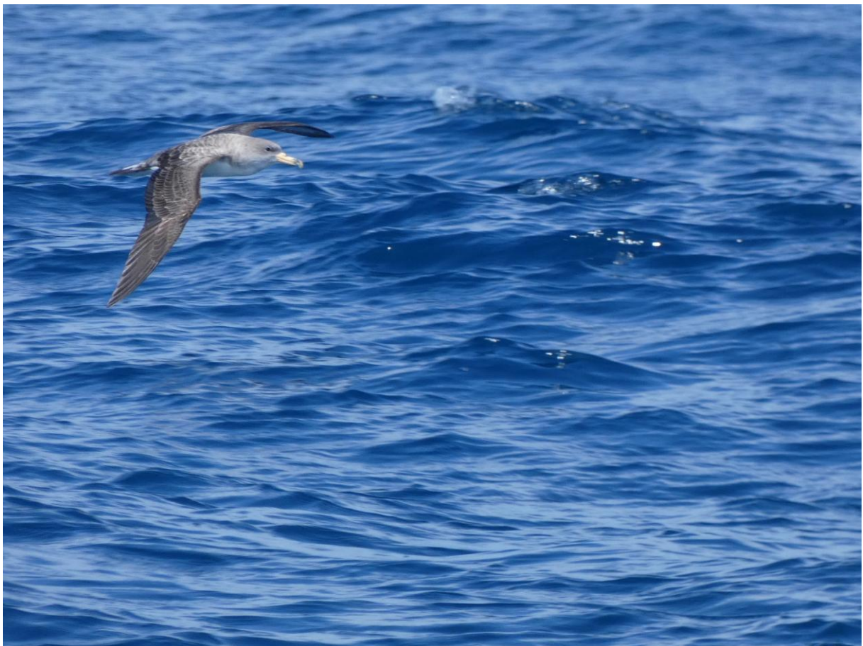
Kuhls Pijlstormvogel