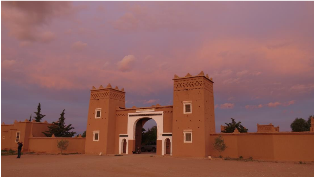
de kashba in Boumalne