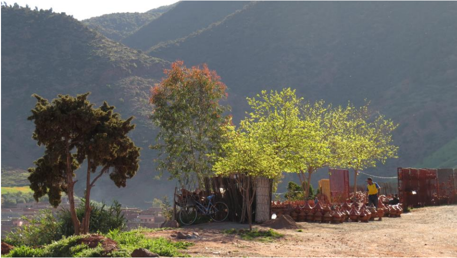
langs de weg in de Hoge Atlas