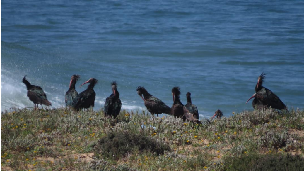
de groep Kaalkopibissen aan de kust

De volgende stop maakten we bij Tamri, een mooi natuurgebied aan de monding van de gelijknamige rivier. Toen we aankwamen liep een Marokkaanse Kwikstaart vlak voor de bus voor ons uit: weliswaar eerder gezien, maar toch mooi! Overal zaten Kleine Zwartkoppen, met enkele zingende Westelijke Vale Spotvogels. In de riviermonding zat een groep meeuwen: voornamelijk Geelpootmeeuwen, maar wel met enkele Audouins Meeuwen, de eersten van de trip, en een erg fraaie meeuw! Wiek spotte nog een overvliegende Purperreiger.