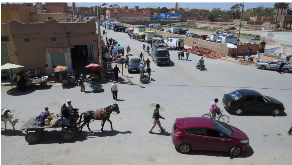
straatbeeld in Rissani