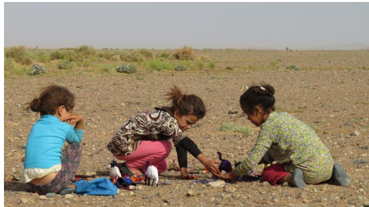
De meisjes in de woestijn in de woestijn met hun souvenirs