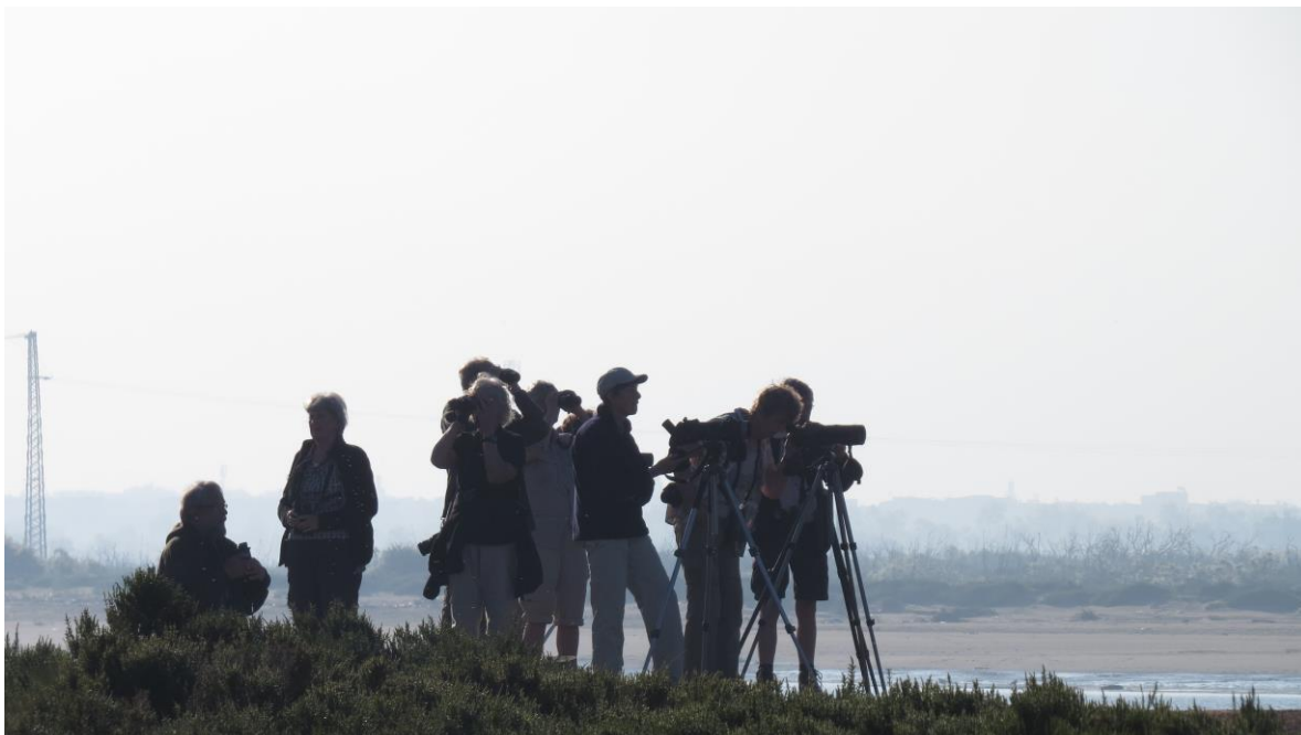
's ochtends langs de Oued Sous

Ons volgende doel was de Oued Massa. Daar zouden we een wandeling langs het water van –ook hier- de lange riviermonding maken. Over een afstand van 6 kilometer deden we 3 en een half uur! Het was er mooi: heerlijk weer, veel bloemen, veel activiteit. In de struiken langs de rivier zat van alles: o.a. Baardgrasmus, Iberische Tjiftjaf, gewone Tjiftjaf en Roodborsttapuit. Eén van de doelsoorten hier was de Zwartkruintsjagra. Deze Afrikaanse soort kent hier z'n noordgrens. We hadden 'm al een paar keer gehoord, toen we er uiteindelijk twee kort maar goed zagen. Verrassend was de Westelijke Rosse Waaierstaart, die we zagen, fouragerend in een droge sloot.