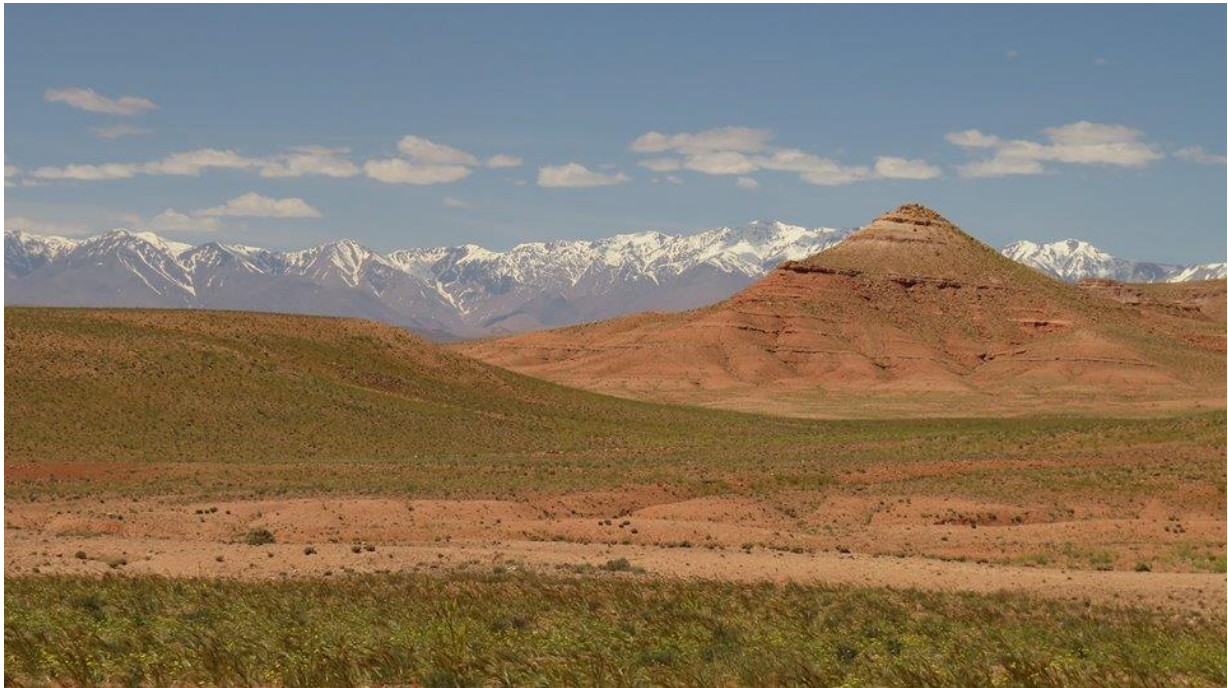
de steenwoestijn ten westen van Ouarzazate

groeide en bloeide. Dat maakte het vogelen er overigens niet makkelijker op. We maakten een stop en zagen onze eerste Kortteenleeuwerikken en 4 Rosse Woestijnleeuwerikken. Her en der lagen Agames te zonnen: net als wij genoten deze grote hagedissen van het prachtige weer.