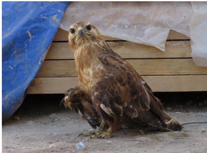
de invalide Arendbuizerd