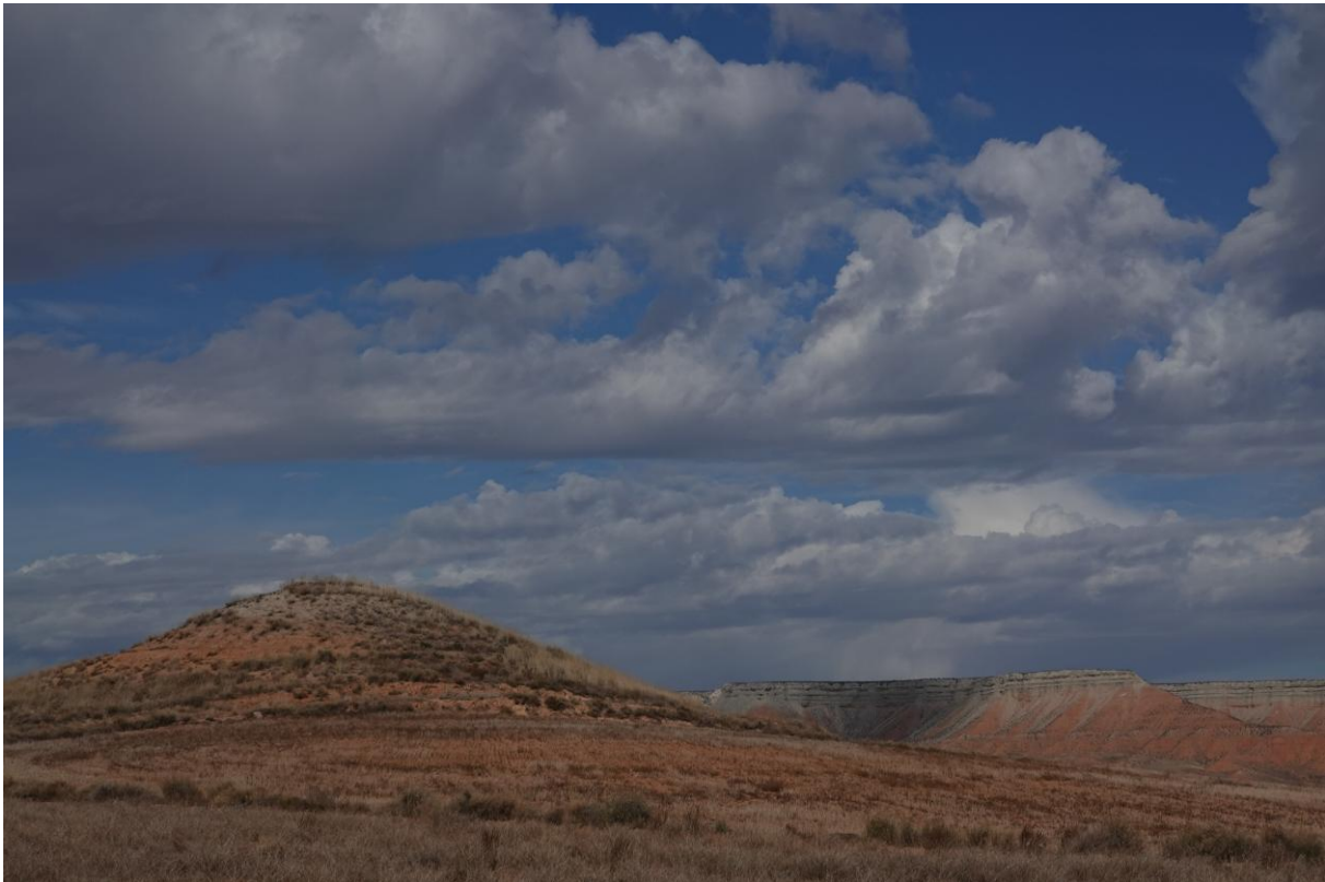
Steppe van Belchite

We maakten vervolgens een heerlijke wandeling door het wonderschone steppelandschap. De lucht was helder en zuiver, het licht was zacht en de temperatuur heel aangenaam. De beleving van dit bijzondere landschap was zodoende optimaal. Hier zagen we meerdere soorten leeuwerikken, zoals Thekla Leeuwerik, Kalanderleeuwerik, Kleine Kortteen- en Veldleeuwerik. Een leeuwerik die kort opvloog om een paar meter verder tussen de struikjes in te vallen en te verdwijnen was verdacht... Was het een Dupont's Leeuwerik? We zullen het nooit weten. Havik, Graszanger, Provençaalse Grasmus, Kleine Zwartkop, Rode Patrijs, Hop en Iberische Klapekster en Vos waren ook van de partij. De Steenarend op een ruïne van een boerderijtje vormde de kers op de taart. Na de lunch op een heuvel in de steppe gingen we verder met het busje.