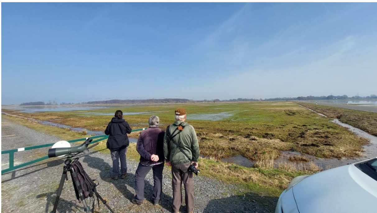
Vogels kijken ten zuiden van de Dümmer See