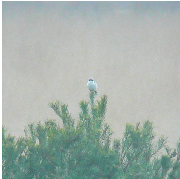
Vlnr Heikikker, Klapekster

We zijn inmiddels alweer aangekomen aan onze laatste stop voor vandaag; de uitkijktoren van het Neustädter Moor. We proberen het vanmiddag op een andere plek als vanmorgen, en niet zonder succes! Al snel na aankomst horen we Geelgors en zien we in de verte Kraanvogels en Blauwe Kiekendieven. En weer horen we Heikikkers, waarvan er hier heel veel zitten. Het is even zoeken maar ondanks de grote afstand en het afnemende licht kunnen we ze vanuit de uitkijktoren door de telescoop zien zitten. Met enige moeite is zelfs de kenmerkende blauwe kleur van de mannetjes te onderscheiden. Enkele Grote Zilverreigers hebben dit ook door en voor onze ogen wordt er eentje opgegeten. Als toetje vinden we nog een Klapekster; onze enige dit weekend. Ondertussen zien we ook de nodige groepjes Kraanvogels binnenkomen, we hebben er al aardig wat gezien dit weekend maar ze blijven mooi!