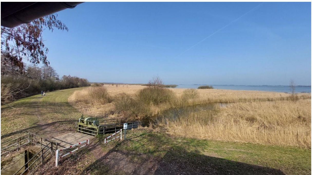
Uitzicht over de Dümmer See

Onze laatste stop levert helaas geen nieuwe soorten meer op waardoor onze triplijst stopt op een niet onverdienstelijke 87 soorten (zie bijlage), maar met een overvliegende Zeearend als afsluiter is dit geen straf. Bij de auto's werken we nog even snel de triplijst bij, terwijl we Tjiftjaf en Boomkruiper horen zingen. Daarmee is het weekend ten einde, en stopt de telling. Helaas, want onderweg naar huis zien we nog Rode Wouw, Citroenvlinder, Groene Specht en zelfs een mooie Noordse Kauw maar aangezien sommige deelnemers dan al afscheid hebben genomen tellen we deze niet meer mee. De reis naar huis verloopt voorspoedig zodat iedereen op tijd thuis is, hongerig maar voldaan na een heerlijk weekend vogels kijken in Duitsland!