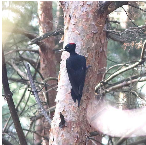
Vlnr Geelgors, Zwarte Specht

Na de lunch besluiten we een wandeling te maken bij het Uchter Moor waar we bij het uitstappen van de auto al getraakteerd worden op een Zwarte Specht die zich goed laat zien, dat is nog eens een goede start! Het is nog steeds heerlijk weer dus de jassen kunnen inmiddels in de auto blijven. Bij de uitkijktoren van het Uchter Moor zien we niet veel vogels maar vinden we wel een Grote Vos en horen we Heikikkers 'bloepen'. Iets verderop zien we met enige moeite leuke bossoorten als Zwarte Mees en Keep en eenmaal in de auto zien we nóg een Grote Vos.