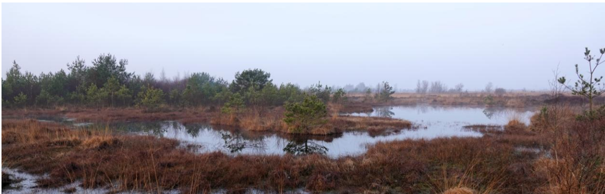
Neustädter Moor, © Diane de Coninck en Andre Ameel

Vandaag moeten we vroeg uit de veren, dit om de Kraanvogels te zien vertrekken vanaf hun slaappleats. Aangezien we gisteren niet heel veel Kraanvogels in het Rehdener Geestmoor hebben zien landen willen we vandaag een andere plek proberen en dat wordt het Neustädter Moor. Ook hier zien en horen we weer de nodige Kraanvogels maar helaas is het zicht door de mist niet zo best, al geeft dit de ochtend wel een mooie sfeer. We horen bovendien een Groene Specht 'lachen' en zien een Geelgors met nestmateriaal slepen. Een Havik vliegt snel over maar kan gelukkig op naam worden gebracht met hulp van een foto. Op de terugweg naar het hotel zien we nog een enorme groep Kolganzen en zitten twee Ringmussen verstopt in een groep Huismussen, die zich niet aan iedereen even makkelijk laten zien.