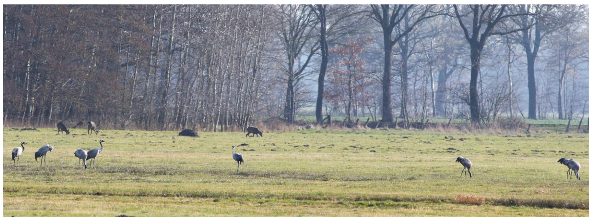
Kraanvogel, Ree

Het eerste doel van de dag is een wandeling bij het Oppenweher Moor. Het is heerlijk weer en daardoor heerlijk wandelen terwijl we ondertussen een goede start van onze triplijst kunnen maken. Onderweg hadden we al onze eerste Kraanvogels al groep genoteerd, en tijdens onze wandeling zien we er nog een aantal foerageren, prachtig op een weiland in de zon met een groep Reeën ernaast. Verder zien we onder meer een zingende Roodborsttapuit, twee roepende Raven, een vrouwtje Heikikker en een prachtige Rode Wouw. Wanneer we al zowat weer in de auto zitten, komt er nog een prachtige Appelvink bij die zich mooi laat bekijken in een boomtop naast de auto.