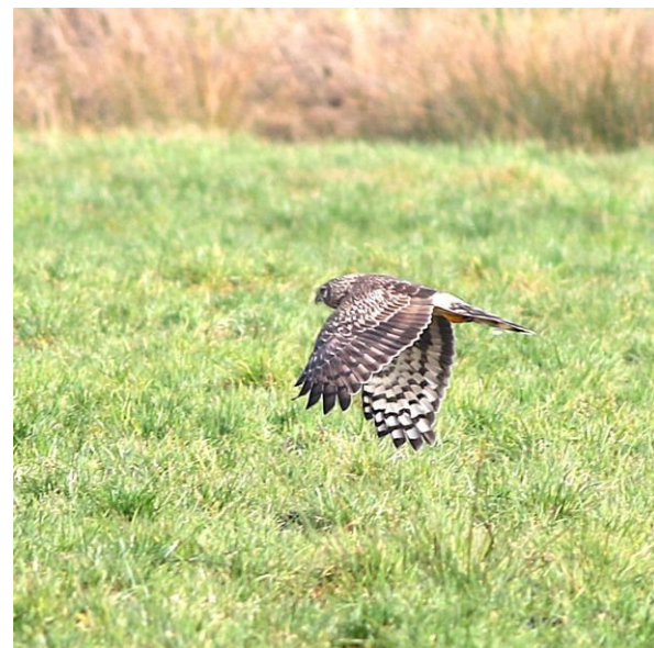
Vlnr Grote Vos, Blauwe Kiekendief