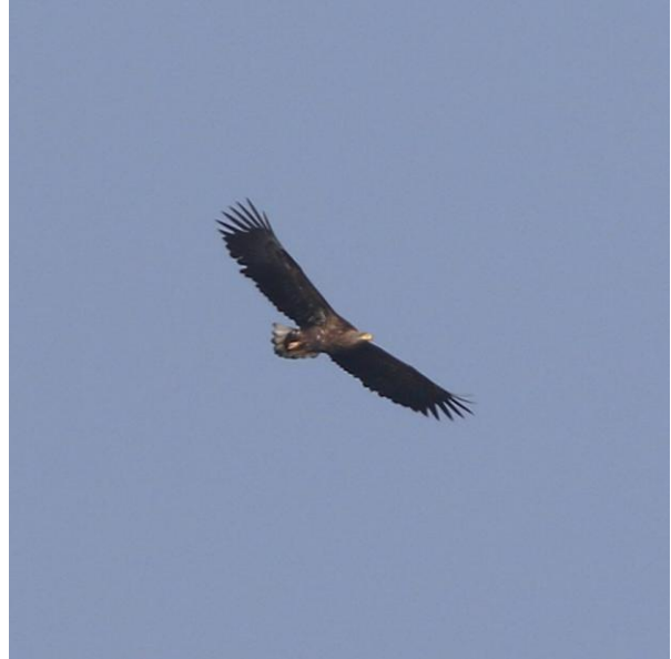
Vlnr Kortsnavelboomkruiper, Zeearend

Onze laatste stop levert helaas geen nieuwe soorten meer op waardoor onze triplijst stopt op een niet onverdienstelijke 87 soorten (zie bijlage), maar met een overvliegende Zeearend als afsluiter is dit geen straf. Bij de auto's werken we nog even snel de triplijst bij, terwijl we Tjiftjaf en Boomkruiper horen zingen. Daarmee is het weekend ten einde, en stopt de telling. Helaas, want onderweg naar huis zien we nog Rode Wouw, Citroenvlinder, Groene Specht en zelfs een mooie Noordse Kauw maar aangezien sommige deelnemers dan al afscheid hebben genomen tellen we deze niet meer mee. De reis naar huis verloopt voorspoedig zodat iedereen op tijd thuis is, hongerig maar voldaan na een heerlijk weekend vogels kijken in Duitsland!