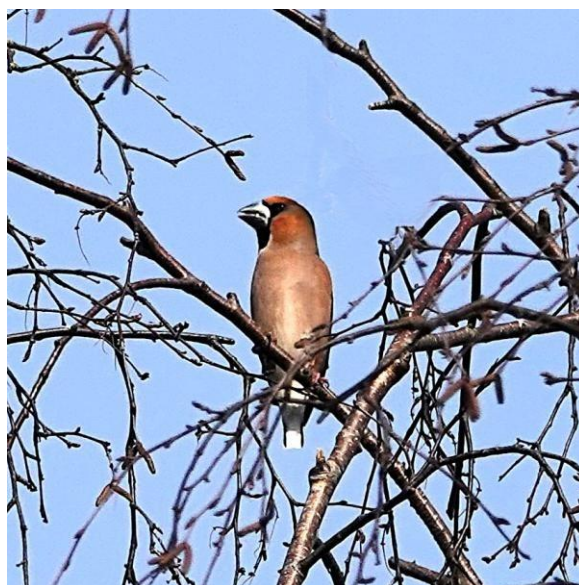
Vlnr Heikikker, Appelvink

Het eerste doel van de dag is een wandeling bij het Oppenweher Moor. Het is heerlijk weer en daardoor heerlijk wandelen terwijl we ondertussen een goede start van onze triplijst kunnen maken. Onderweg hadden we al onze eerste Kraanvogels al groep genoteerd, en tijdens onze wandeling zien we er nog een aantal foerageren, prachtig op een weiland in de zon met een groep Reeën ernaast. Verder zien we onder meer een zingende Roodborsttapuit, twee roepende Raven, een vrouwtje Heikikker en een prachtige Rode Wouw. Wanneer we al zowat weer in de auto zitten, komt er nog een prachtige Appelvink bij die zich mooi laat bekijken in een boomtop naast de auto.