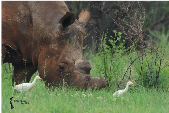
White Rhinoceros & Western Cattle Egret

We waren nog maar net ingecheckt toen het weer opnieuw omsloeg en een indrukwekkende onweersbui over de lodge trok. Toch hadden we onderweg niet stilgezeten en konden we het soortenlijstje verder aanvullen met onder andere Black-chested Snake Eagle, Little Bee-eater, White-browed Sparrow Weaver en Red-billed Oxpecker. Ook in de lodge was er genoeg te beleven. Tussen de buien door doken regelmatig Village Indigobirds en Shaft-tailed Whydahs op bij de feeders rondom de lodge. Uiteindelijk werd de dag, terwijl de regen op het dak bleef trommelen, ontspannen afgesloten met de Formule 1 in de gezamenlijke ruimte.