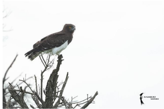
Black-chested Snake Eagle