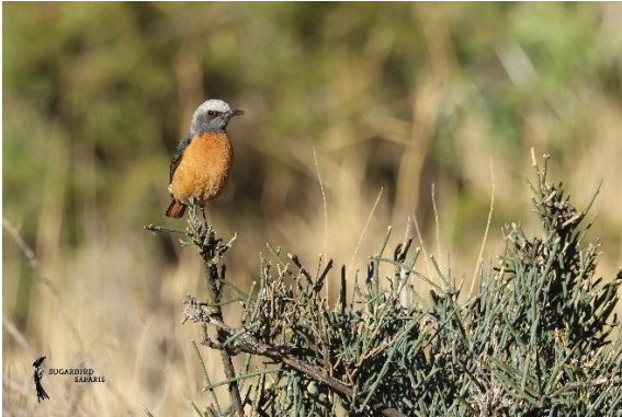
Short-toed Rock Thrush

In de middag liep de temperatuur nog verder op en zochten we de koelte van de huisjes op. Toch lieten we ons niet helemaal stoppen en maakten een korte wandeling door het kamp. Ondanks de verzengende hitte bleef het vogelen de moeite waard: Familiar Chat, Red-eyed Bulbul, White-necked Raven en de Karoo Prinia lieten zich goed zien. Het hoogtepunt van de nachtsafari was echter geen vogel. Bij een burcht bereidde een Bat-eared Foxmoeder zich voor op de nacht, terwijl haar vier jonge vosjes nieuwsgierig om haar heen dartelden.