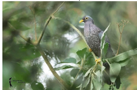
African Olive Pigeon