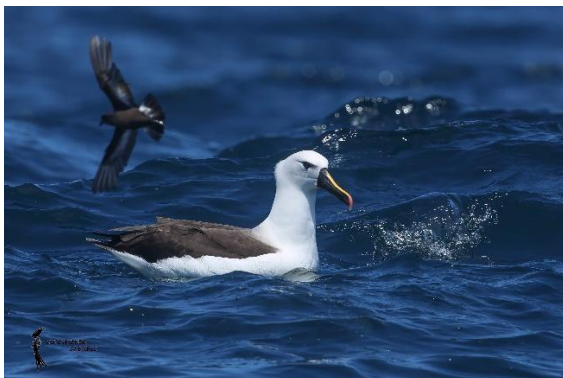
Indian Yellow-nosed Albatross

Met volle geheugenkaarten, lege batterijen en een enorme glimlach op ons gezicht zetten we koers terug naar de haven. Nauwelijks aangemeerd begon de wind weer aan te trekken en vielen de eerste lichte regendruppels. Alsof de oceaan ons precies dat ene perfecte tijdsvenster had gegund.