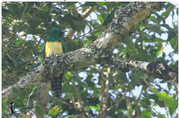
African Emerald Cuckoo