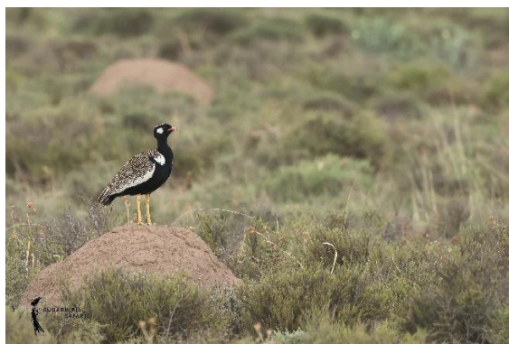
Northern Black Korhaan