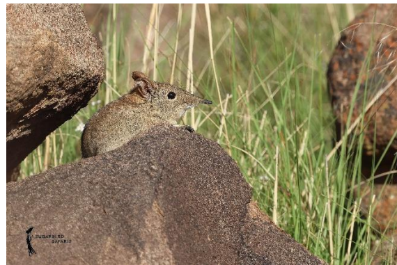
Eastern Rock Sengi