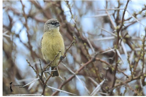
Cape Penduline Tit