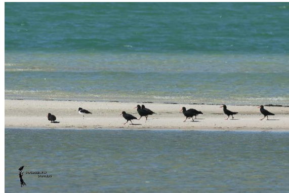
African - & Eurasian Oystercatcher