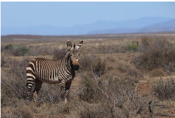
Cape Mountain Zebra