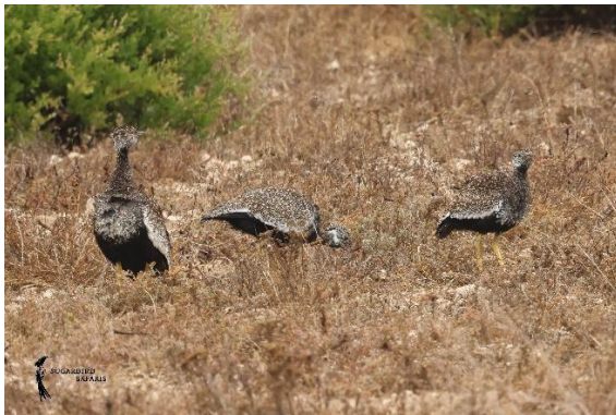
Southern Black Korhaan

Zo kwam een bijzonder succesvolle reis ten einde. Maar liefst 371 soorten mochten we noteren, een indrukwekkend aantal, maar bovenal een verzameling van herinneringen die nog lang zullen blijven nazinderen.