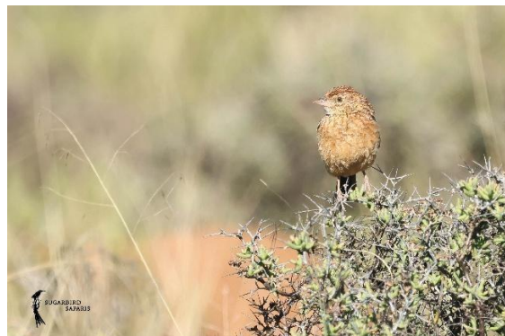
Eastern Clapper Lark