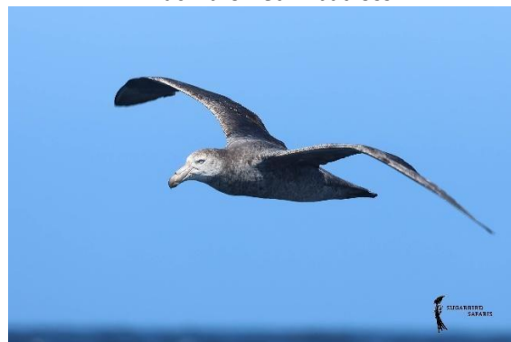
Northern Giant Petrel