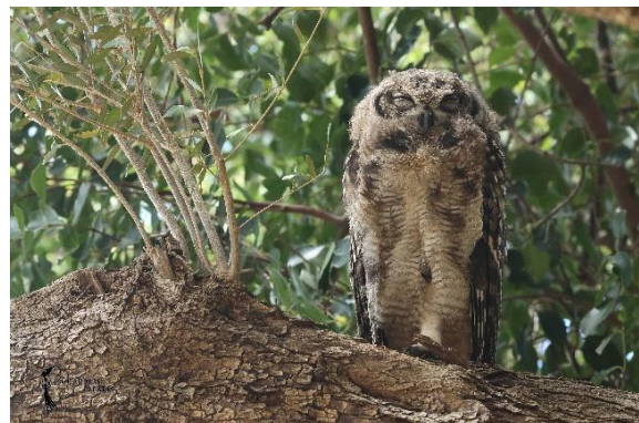
Spotted Eagle Owl (Juveniel)