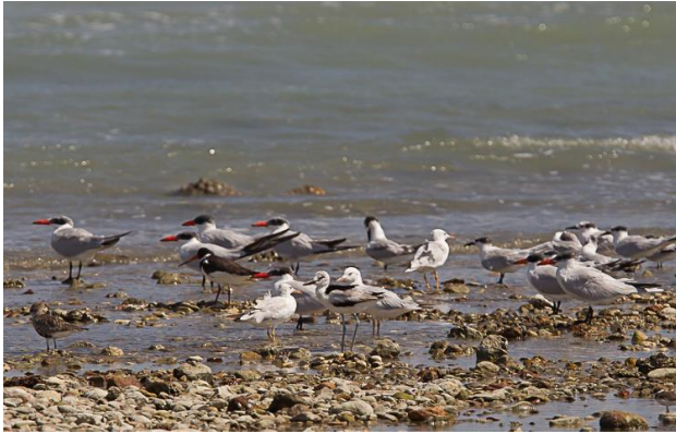
Krabplevier te midden van Reuzensterms, Grote Sterns, Dunbekmeeuwen en een Zilverplevier (Jos vd B)