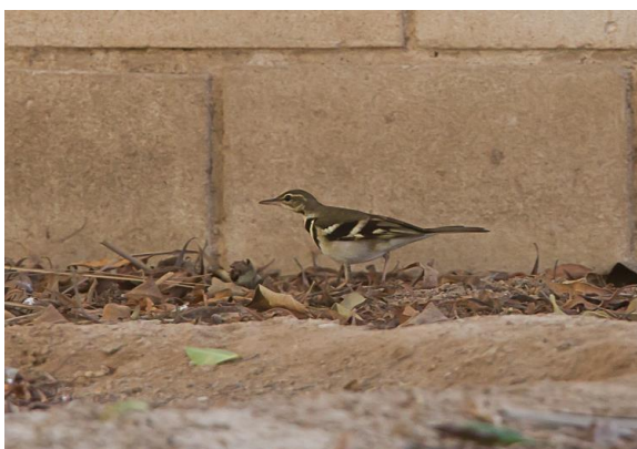
Boomkwikstaart (Jos vd B)