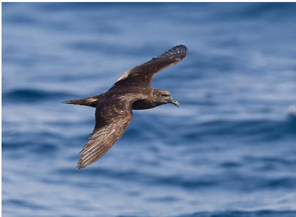
Jouanins Stormvogel

Vandaag staat een pelagische tocht op het programma. Om 7.30 uur hebben we afgesproken met onze schipper Yousuf in de oude vissershaven van Salalah. De wind is gelukkig iets afgenomen t.o.v. gisteren en vol goede moed kiezen we het zeegat. Eerst varen we een heel eind dicht langs de kust. De eerste verrassende soort die we tegenkomen is een Noddy. Verder zien we Maskergent, Bruine Gent, Arabische Aalscholver en Brilstern, weliswaar in kleine aantallen. Na ongeveer een uur veranderen we van koers en varen verder uit de kust. Het blijft lange tijd rustig maar dan zien we de eerste Jouanin Stormvogel. Na een tijdje zien we meerdere vogels evenals enkele Audubons Pijlstormvogels op soms korte afstand van de boot vliegen. Yousuf gooit wat visafval over boord. De vogels duiken vaak achter de sardientjes aan en blijven ons lang volgen. Het eerste Wilsons Stormvogeltje zorgt voor een grote ontlading in de boot. Als we uiteindelijk allemaal een dicht langs de boot vliegend Chinees Stormvogeltje zien kan het niet meer stuk. We varen terug naar de haven en sluiten deze geslaagde zeetocht af met een door Yousuf aangeboden heerlijke lunch in het havenrestaurant.