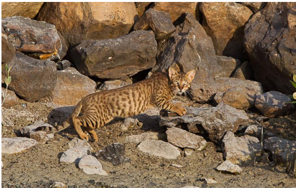
Gordons Wilde Kat (Jos vd B)