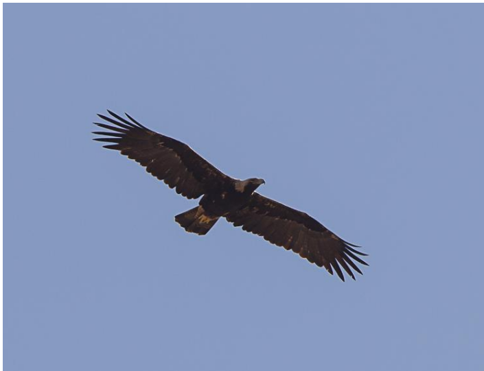
Keizerarend (Jos vd B)

Bij de East Khawr aangekomen zoeken we de verschillende steltlopers af. Dit resulteert in de ontdekking van een Taigastrandloper. Op de valreep krijgen we van een Belgische vogelaar een tip dat bij de overslaghaven van Salalah een Krabplevier loopt. Aangezien we nog tijd hebben, besluiten we om hier naar toe te gaan. De plek is snel gevonden. We zien een twintigtal Visarenden dicht bij elkaar aan de grond. Als we een stukje verder lopen zien we tussen tientallen meeuwen en Reuzensternen de Krabplevier staan. Tevreden rijden we naar het hotel. We knappen ons op, pakken de koffers en verlaten om 14.30 uur het hotel. Op het vliegveld wordt de auto ingeleverd en checken we in voor de binnenlandse vlucht met Oman Air naar Muscat. De terugvlucht naar Nederland verloopt goed. We landen zondagmorgen om 5.00 uur op Schiphol.