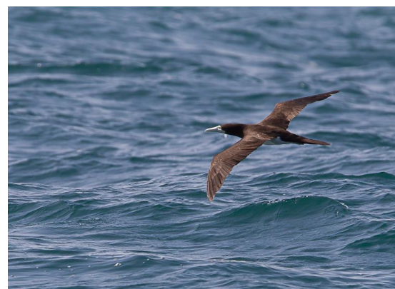
Bruine Gent (Jos vd B)