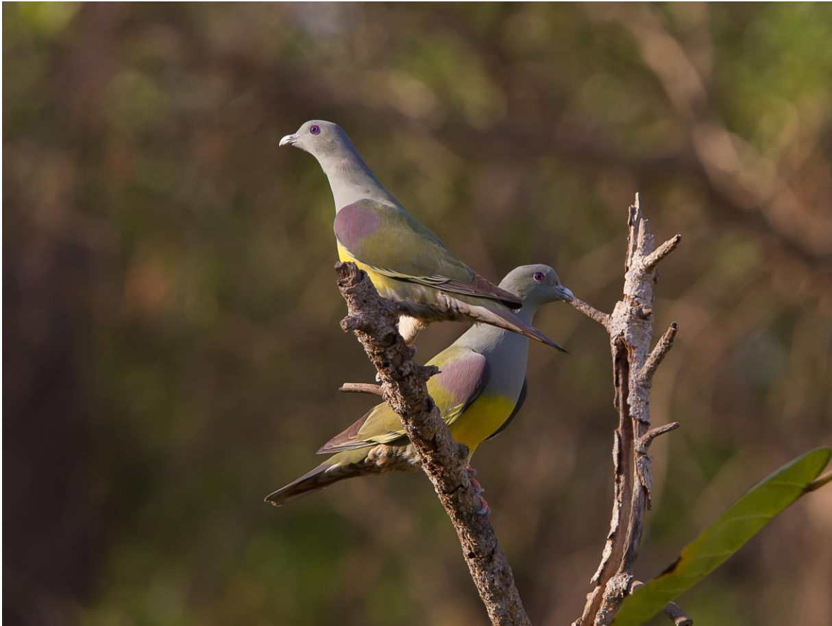
Waaliaduiven (Jos van den Berg)