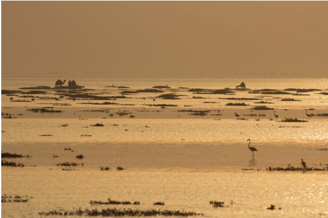
Barr Al Hikman