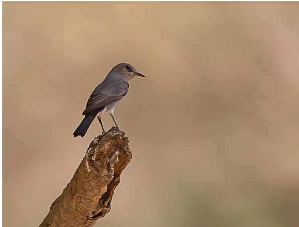
Zwartstaart (Jos vd B)