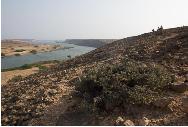
Khawr Rawri