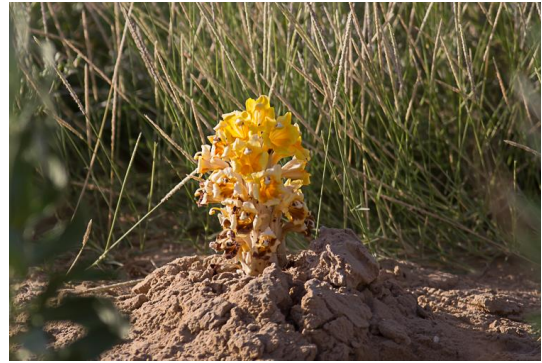
Bremraap (Hendrik Jan)

We kunnen terugkijken op een fantastische vogelreis naar een interessant land met een uiterst vriendelijke bevolking. Deze reis hebben we maar liefst 208 vogelsoorten waargenomen.