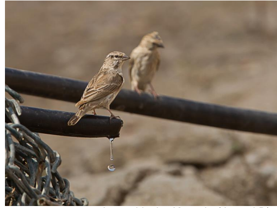
Jemenitische Kanarie (Jos vd B)