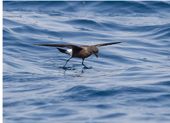
Wilson's Stormvogeltje

Na dit avontuur vertrekken we naar Al Mughsayl, een kustplaats ten westen van Salalah. We richten ons op de daar aanwezige wadi. Na een paar kilometer stoppen we bij een kleine plas met wat riet. Al snel zien we hier Witborstwaterhoen, Waterhoen en Indische Karekiet. De ontdekking van een Kleinst Waterhoen maakt in het bijzonder één deelnemer heel erg blij. Uiteindelijk laten twee vogels zich op deze plek erg fraai bekijken. Niet lang daarna zweeft een adulte Zwarte Arend gedurende een tiental seconden over de bergrug. Een andere wenssoort kan worden bijgeschreven. Als we terugrijden naar de hoofdweg zien we onze eerste Arabische Steenpatrijzen. Maar liefst een dertigtal vogels lopen al foeragerend aan de voet van de bergen. We hebben nog een uur voor de duisternis invalt en rijden richting Raysut. We rijden langs de vuilstortplaats en zien grote aantallen Abdimmooievaars naar hun slaapplek vertrekken. Met permissie lopen we nog twintig minuten rond op het terrein van de waterzuivering in Raysut. Dit levert geen nieuwe soorten op. Na het diner rijden we nog een keer naar Ayn Hamran in de hoop enkele uilensoorten te zien. We horen verschillende Arabische Dwergooruilen en slechts eenmaal kort een Afrikaanse Oehoe.