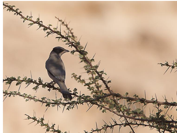
Zijdestaart (Jos vd B)