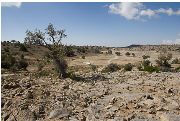
Wadi in Al Hajar gebergte

Vandaag hebben we de hele dag de tijd om de omgeving van Barr Al Hikman te verkennen. Op de gisteren zo succesvolle plek bij Filim staat 's morgens vroeg het water al te hoog. Een Velduil laat zich hier evenwel mooi bekijken. We verlaten Filim en gaan op zoek naar een andere locatie. Onderweg zien we op zeer korte afstand twee Amoerropootvalken langs de weg zitten. Uiteindelijk vinden we een goede hoogwatervluchtplaats met hoge aantallen steltlopers langs de weg naar de kust. Als de vloedlijn zich verder terugtrekt en daarmee ook de vogels voor ons steeds verder komen te lopen, rijden we door naar Shannah. Vanuit deze haven vertrekt een veerboot naar het eiland Masirah. We drinken op ons gemak koffie terwijl in de haven Grote Kuifsterns, Bengaalse en Grote Sterns rondvliegen. Na de lunch besluiten we nogmaals naar Filim te rijden. Met het opkomend water groeien de aantallen steltlopers gestaag. Naast de gisteren waargenomen soorten zien we nu ook enkele Poelruiters op korte afstand foerageren. Achter de fabriek zien we bij enkele zoetwaterplasjes minstens drie Stekelstaartsnippen en een Watersnip. Een Daurische Klauwier jaagt onverstoord op insecten. Ook zien we op deze locatie een van de weinige zoogdieren van de reis; Gordons Wilde Kat ( Felis silvestris gordonii ). Morgen verlaten we dit uitgestrekte en vogelrijke wadengebied en koersen af op de woestijn.