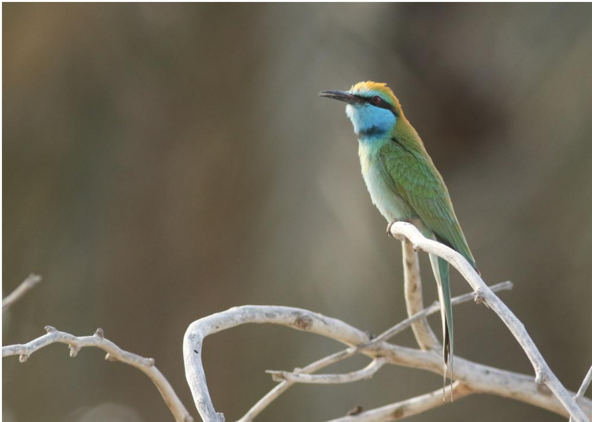
Arabische Kleine Groene Bijeneter – Thomas Los

begint verdacht veel op een safari te lijken met tijdens de rit Arabische Kleine Groene Bijeneters en Indische Scharrelaars vlak langs het pad. Het doel hier zijn een aantal plasjes die een echte magneet zijn voor vogels. Bij de eerst plasjes zit een groep Kolganzen en een Fuut . Die laatste verdient een speciale benoeming omdat deze vogel pas de 6 e Fuut was die ooit in Oman gezien is. Als we een stukje doorlopen vliegen 2 Stekelstaartsnippen op vanuit wat droge vegetatie, leuk! Ook de Veldleeuwerik die hier opvliegt is een in Oman schaarse soort. Een volgend plekje moeten we wat gehaast checken, want de golfballen vliegen ons om de oren. Thomas rent onder het gemopper van de aanwezige golfers toch snel even rond, tientallen Watersnippen vliegen op, met daartussen ook een enkele Stekelstaartsnip . De golfbaan was een leuke stop, maar de magen zijn gaan knorren. We stappen dus snel in de auto en rijden een stukje richting het noorden langs de kust. Bij een wegrestaurant krijgen we weer flinke portie Indiaas eten voorgeschoteld, dus het geknor verdwijnt snel naar de achtergrond.