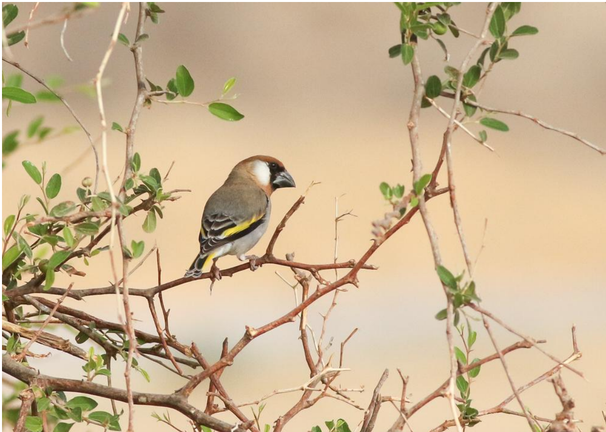
Arabische Goudvleugelvink – Thomas Los

Bij Ayn Hamran hangt een leuke sfeer, een groep lokale mensen is kamelenmelk aan het drinken onder de bomen. De vrolijke mannen bieden ons ook een slokje aan waar we natuurlijk geen nee tegen zeggen. Enkelen van de groep ploffen zelfs neer in de haastig voor ons neergezette stoelen, en we wanen ons even echte Omani's. De vogels hier vallen wat tegen, maar een Steenuil , Stekelstaartsnip en grote aantallen Ruppels Wevers maken een hoop goed. We bevinden ons alweer tegen het middaguur, dus we vervolgen onze weg weer uit de wadi. We maken een plan voor de middag en wegen alle wensen eens tegen elkaar af, en komen tot de conclusie dat een duik in de zee nog wel bij deze reis hoort. Bram gaat daarom alvast lunch halen bij een Libanees restaurant, terwijl de rest in het As Saadah Park twee gewilde soorten probeert te vinden. Bij binnenkomst van het