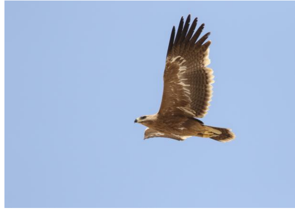
2 e kalenderjaar Stepparend – Thomas Los