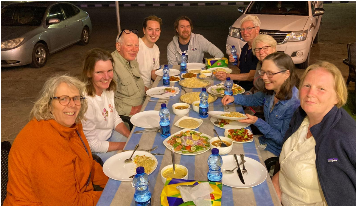
De groep tijdens een van de vele Indiaase maaltijden - Omani