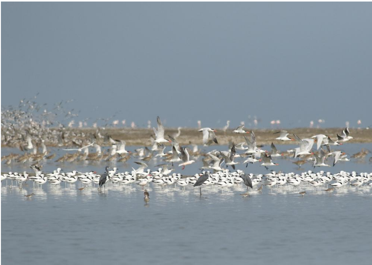
Het toneel bij Bar-al-Hikkman, Krabplevieren, Reuzensterms, Bengaalse Sterms, Grote Kuifsterms, Grote Sterms, Bonte Strandlopers, Wulpen, Tureluur, Dunkbekmeeuwen, Westelijke Riffreigers, Flamingo's, Zilverplevieren, Krombekstrandlopers, Rosse Grutto's, en dat allemaal op een foto.. – Thomas Los

Na deze lekkere ochtend bij deze drinkplek staat de Gestreepte Woestijnzanger op het programma! Deze kleine zangvogels zitten in lage droge struiken en Bram wist een goede plek voor deze soort. Direct bij aankomst hebben we twee vogels in beeld, dat gaat makkelijk! Erg leuke beestjes en voor veel mensen de soort van de dag. Omdat het naar ons volgende hotel in Mahout nog ruim drie uur rijden is vertrekken we bij het plateau. Onderweg is het vooral doorrijden maar tijdens een korte stop bij wat struikjes in de woestijn zien we zowaar een Woestijngrasmus en een Woestijnklapekster! Toch twee leuke soorten om even tussendoor mee te pakken. Aangekomen bij Mahout besluiten we om toch nog even naar het vissersplaatsje Fillim te rijden om met het laatste licht alvast even te genieten van het waanzinnige gebied Bar-al-Hikman. De zon is al onder als we aankomen maar in het dimmende licht kunnen we toch nog een half uur genieten van de steltlopers op het wad. Er staan zowaar ook al enkele Krabplevieren voor onze neus, toch wel een van de iconen van dit gebied. Als het licht uit is gaan we inchecken in ons hotel en verzamelen we ons voor het diner in een van de lokale restaurants.