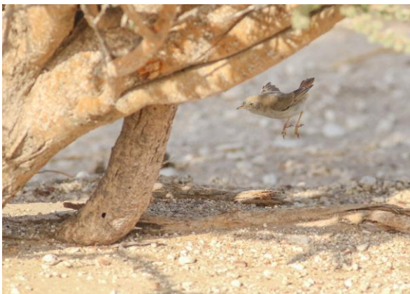
Woestijngrasmus – Thomas Los