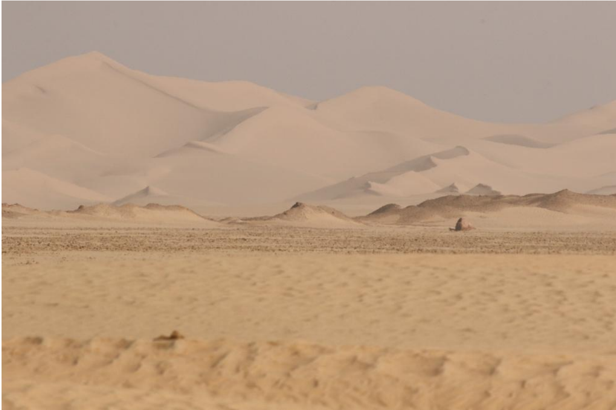
Uitgestrekte woestijn in de 'Empty quarter'

eerste vogelstop, het parkje van Haima. Dit kleine stukje park midden in de woestijn is vooral in de trektijd een magneet voor vogels. Op een besproeid gazon zitten ook nu een aantal Koereigers en drie Duinpiepers . Ook een Braamsluiper , Siberische Tjiftjaf en meerdere Woestijntapuiten brengen hun winter door in dit parkje. Heel groot is het hier niet dus al snel zitten we weer in de auto onderweg naar de volgende stop.