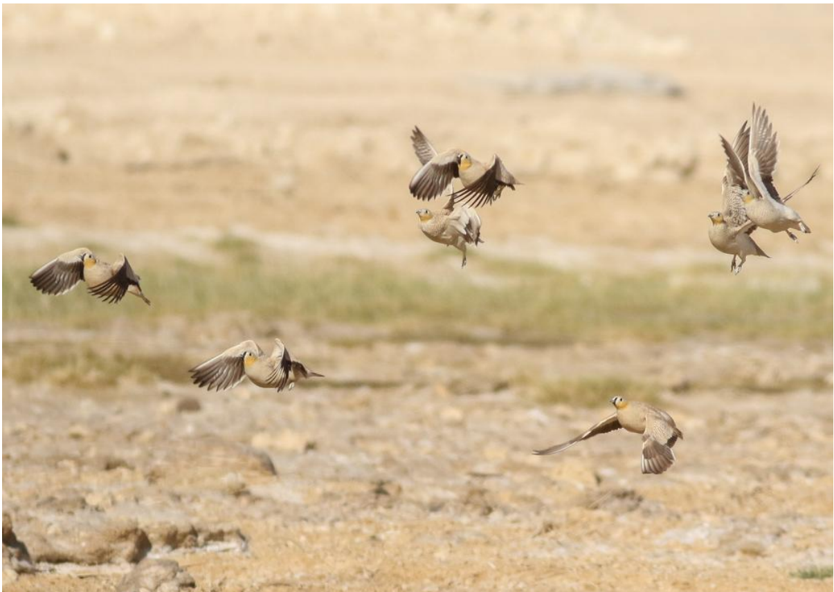
Kroonzandhoenders – Thomas Los

Nadat we bijgekomen zijn van deze bijzondere ervaring is het tijd om het meegebrachte ontbijt op bij de oase op te eten. Als de auto van Thomas als bij de parkeerplaats aangekomen is klinkt er opeens een vaag maar enthousiast gekraak uit de walkietalkie. Dit kan maar een ding betekenen: Bram heeft onderweg weer eens iets leuks gevonden. We keren dus maar snel om en zien nog een Witborstwaterhoen over de weg lopen. Eenmaal aangekomen bij Bram blijkt er een groep Lichtensteins Zandhoenders te lopen! Deze soort komt normaal gesproken alleen in de avond