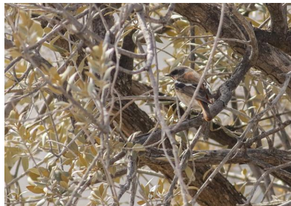
Eversmanns Roodstaart – Thomas Los