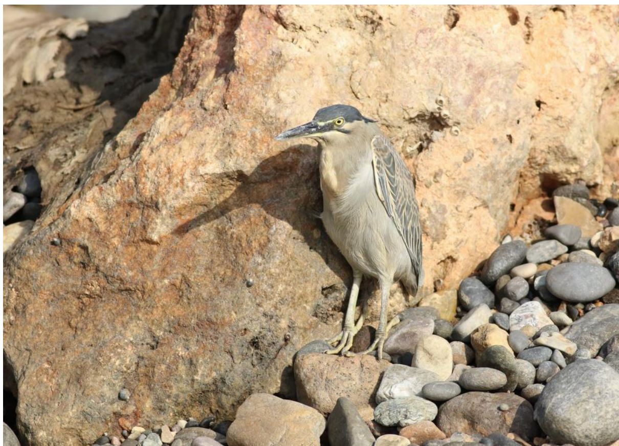
Mangrove-eiger - Thomas Los

schuiven we tevreden aan bij het diner in het hotel. De groep is gezellig en we hebben vandaag goed kennis kunnen maken. We eindigen de dag op 80 verschillende soorten. Dit smaakt naar meer!