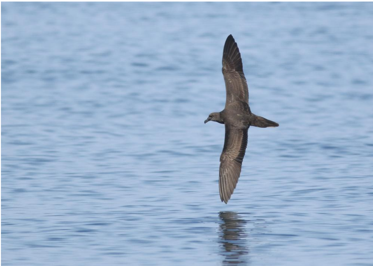
Jouanins Stormvogel – Thomas Los

Wadi Darbat is een van de grootste wadi's in het Dhofar-gebergte. De rivierbedding staat nu echter behoorlijk droog, en een beroemde waterval die vaak veel toeristen is nu niet meer dan een hoop stenen. Bij het binnenrijden van de wadi zien we al snel enkele Zwartstaarten zitten en ook een Blaue Rotslijster en Zevenstrepengors scharrelen op de grond. We rijden door naar het einde van de wadi waar een soort crêpe-restaurant zit. We bestellen wat crêpes als lunch en kijken ondertussen onze ogen uit. In de bomen naast het restaurant zitten tientallen Ruppels Wevers , Abbesijnse