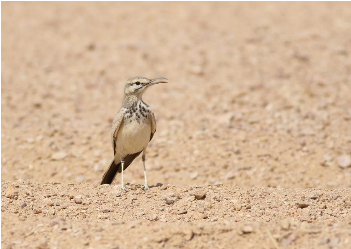
Witbandleuwerik – Thomas Los