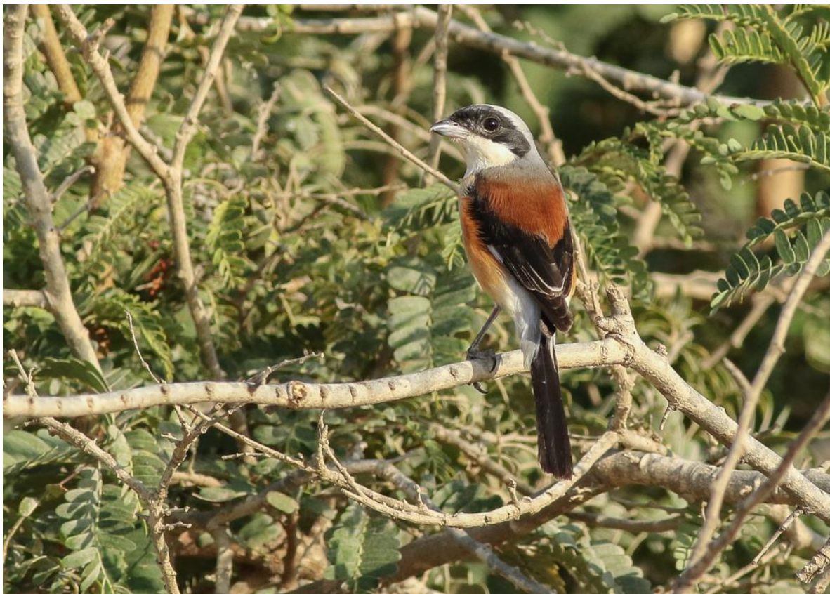
Bruinrugklauwier – Thomas Los