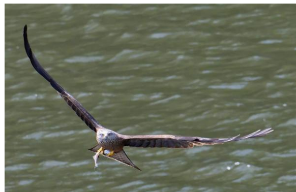
Kleine Bonte Specht en Zwarte Wouw (links: Huub Lakerveld, rechts: Jaap van Erp)