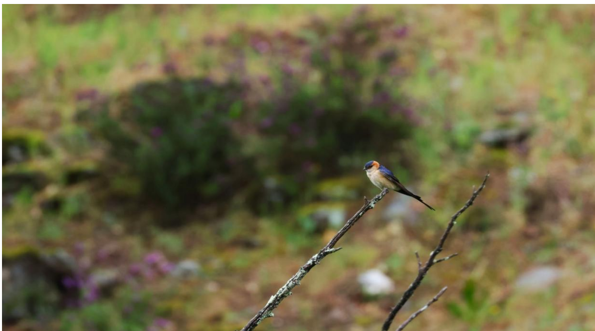
Roodstuitzwaluw bij de Magasca rivier (Huub Lakerveld)

De tocht gaat verder door fraaie landschappen met rollende heuvels, rotsblokken en lage bomen. We stoppen bij een brug over de Rio Magasca, waar Zwaluwen de show stelen. Mooie Roodstuitzwaluwen en Rotszwaluwen dartelen voorbij en de Europese Kanarie laat zich uitgebreid zien en horen.