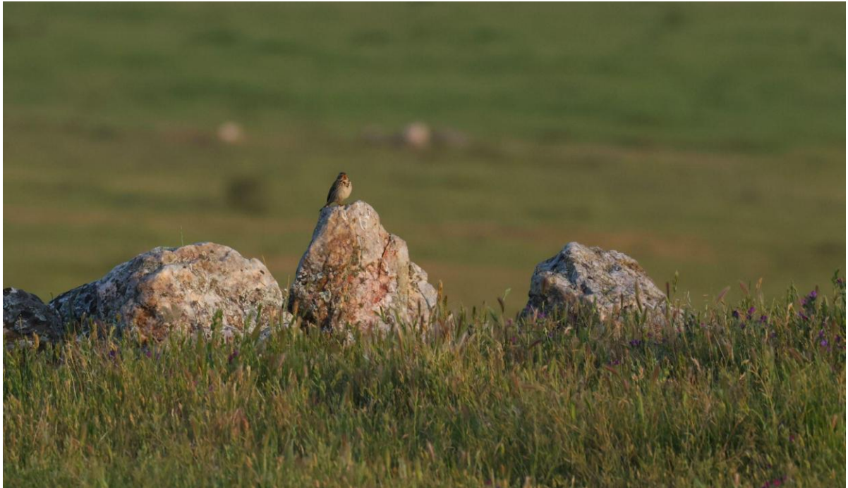
Grauwe Gors zingend in het eerste ochtendlicht (Huub Lakerveld)

We rijden verder over een deel van de route die we op dag 2 aflegden en picknicken langs een rivier. Onderweg zien we nog meer Grote Trappen, een soort die we vaak en goed hebben kunnen zien deze week. Voor het diner in Trujillo zelf verkennen we de stad en lopen naar het Moorse kasteel. Naast de mooie uitzichten over de omgeving spotten we ook nog een Dwergarend en Gierzwaluwen. Het gezellige laatste diner laat zich goed smaken.