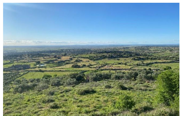
Trujillo en omgeving (Huub Laker)