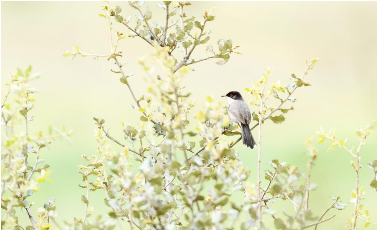
Kleine Zwartkop (Huub Lakerveld)