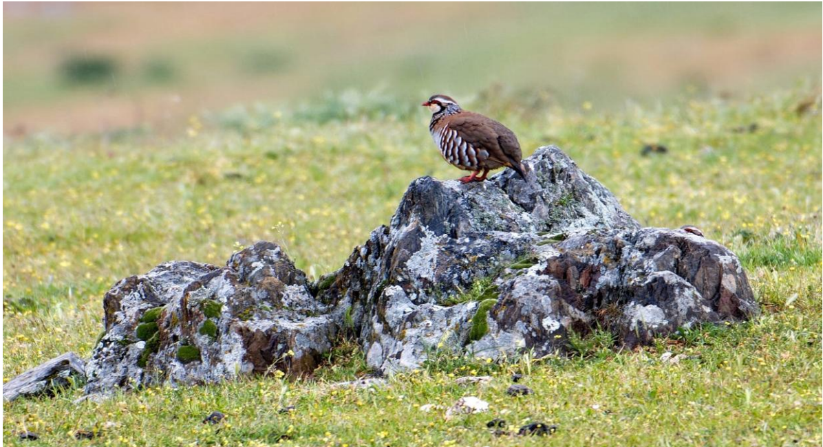
Rode Patrijs poseert op de steppe (Jaap van Erp)

De tocht gaat verder door fraaie landschappen met rollende heuvels, rotsblokken en lage bomen. We stoppen bij een brug over de Rio Magasca, waar Zwaluwen de show stelen. Mooie Roodstuitzwaluwen en Rotszwaluwen dartelen voorbij en de Europese Kanarie laat zich uitgebreid zien en horen.