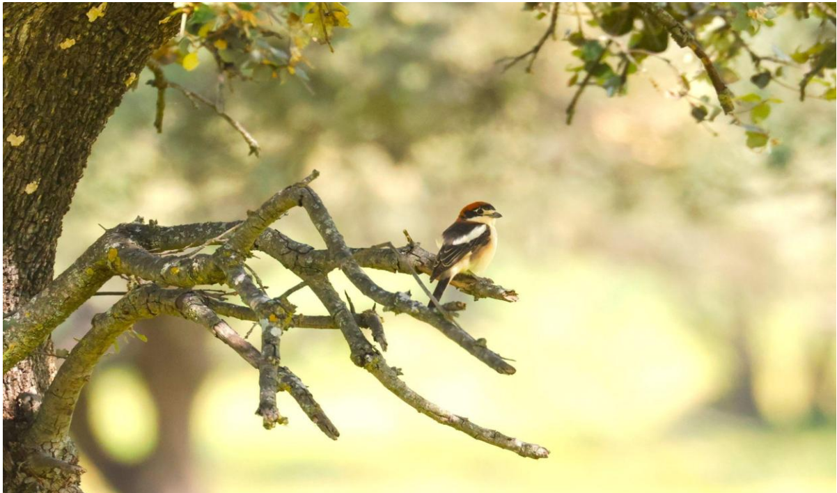
Roodkopklauwier (Huub Lakerveld)

Vandaag vogelen we onze weg naar Madrid, met het Arrocampo stuwmeer als hoofdgerecht. Eerst stoppen we bij drie generaties bruggen, waar het mooi riviervogelen is. Welbekende soorten als Boeren-, Huis- en Roodstuitwaluw broeden hier in zelf gemetselde kommetjes. Verder komen Vale en Monniksgieren en een Dwergarend over. We rijden verder door de bergachtige omgeving richting het meer. Nog een tussenstop levert een mooie waarneming van een Westelijke Baardgrasmus op, een soort die voor opgewekte gezichten zorgt. Dan gaan we op zoek naar orchideeën. Er groeien er (nog) niet veel, maar vogels zijn er des te meer. We worden opnieuw vergezeld door Blauwe Eksters, Roodkopklauwieren en we horen zelfs een Westelijke Orpheusgrasmus; best een zeldzaamheid hier.