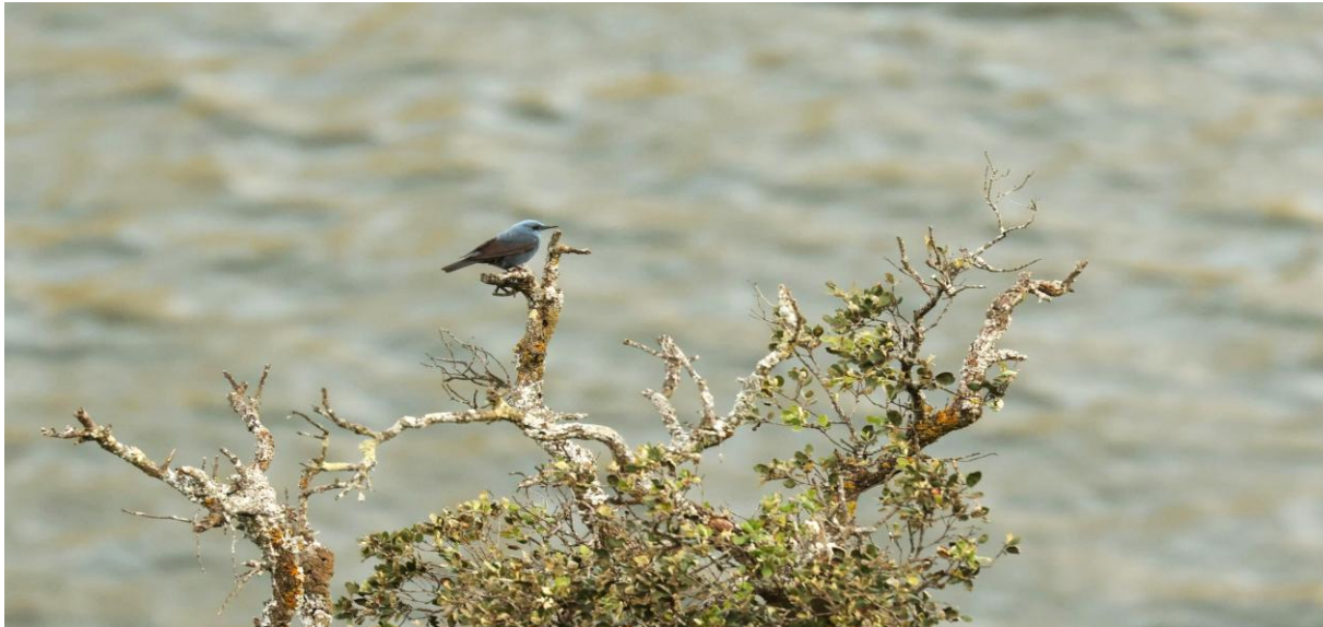
Blauwe Rotslijster in Monfragüe

Ook de Slechtvalk en broedende Zwarte Ooievaars staan al snel in de kijker, en gebiedsspecialiteiten als de Blauwe Rotslijster, Grijsze Gors en de Zwarte Roodstaart komen erg dichtbij. We vergapen ons aan de schitterende soorten en indrukwekkende landschappen.