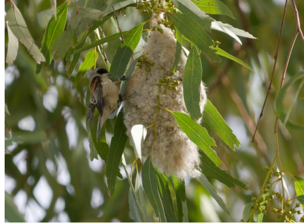
Woudaap en een Buidelmees bij nest (links: Bob Hiemstra, rechts: Gilbert Houtekamer)

We nemen 1,5 uur de tijd om zelfstandig het stadje te verkennen (het blijft Easy Birding) en rijden daarna Mérida uit naar Castillo de Alange. Hier gaan we op zoek naar de Zwarte Tapuit, een vogel die in Europa eigenlijk alleen in Spanje voorkomt. Alsof we een afspraak hebben gemaakt, laat het dier zich vrijwel meteen zien. Wat een mooie soort met z'n contrastrijke zwarte lijf en witte staart. Verder zien we nog soorten als Lachstern over het stuwmeer, Slangenarend en Blauwe Rotslijster. Tevreden rijden we terug naar onze thuisbasis in Trujillo.