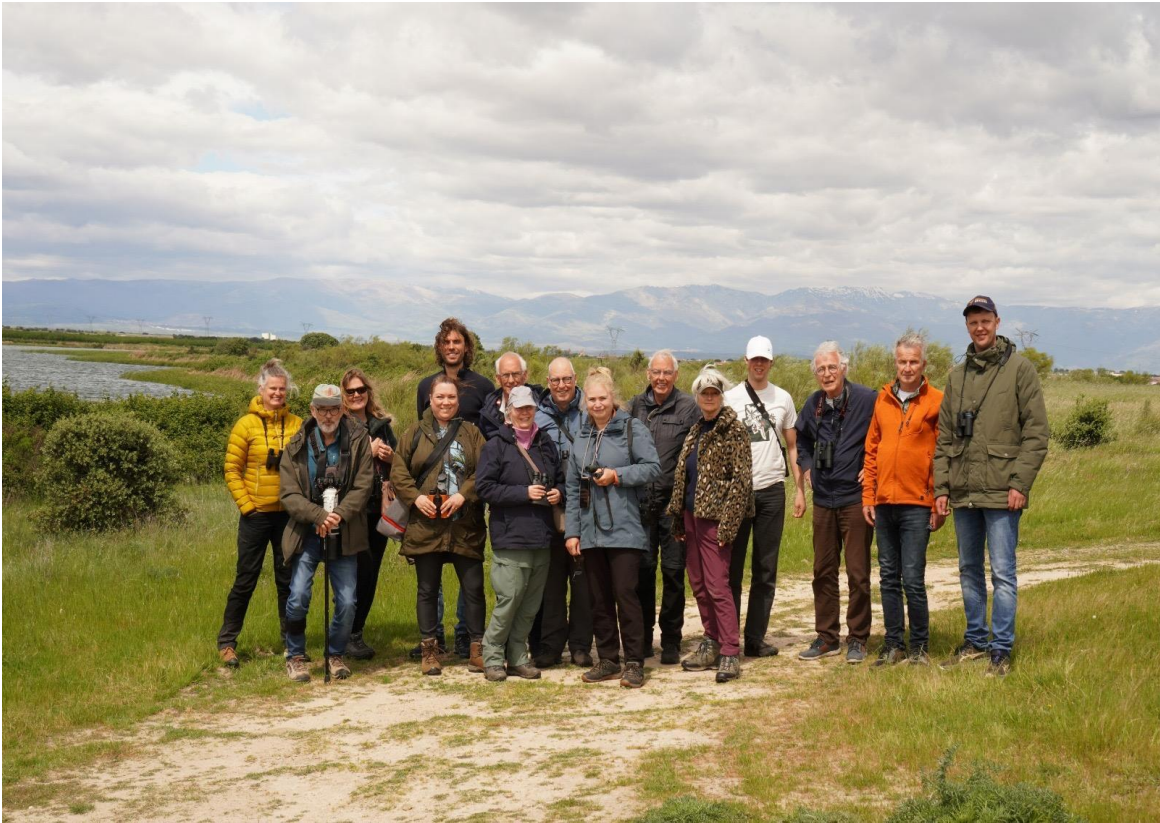
De gezellige Easy Birding Extremadura groep