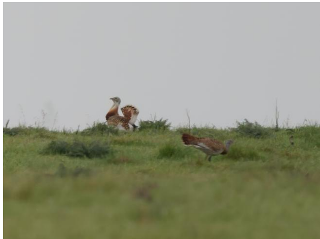
Grauwe Kiekendief en Grote Trappen (links: Jaap van Erp, rechts: Gilbert Houtekamer)

Iets verderop ligt een stuwmeer, waar we een aantal fraaie soorten kunnen bijschrijven: Purperreiger (broedend), Purperkoet (met jongen) en IJsvogel.