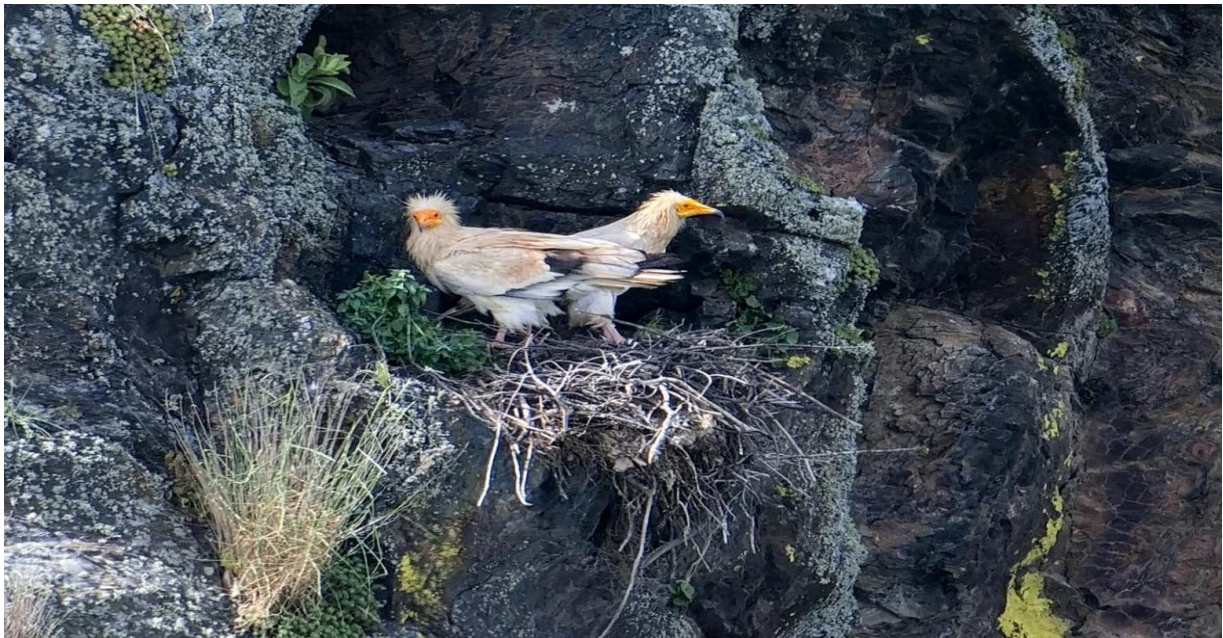
Aasgieren bij hun nest (Jaap van Erp)

Het feest in Monfragüe is zeker nog niet afgelopen. We bezoeken het nest van Aasgieren en vinden een van de ouders op het nest. Ook de tweede ouder laat zich vervolgens zien. Er wordt voorzichtig gelopen op het nest, wat duidt op eieren. Een prachtwaarneming.