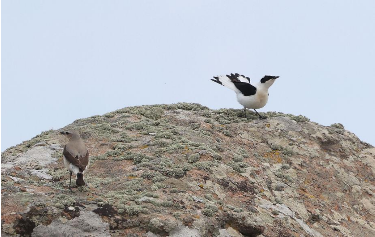
Oostelijke blonde tapuit en Tapuit