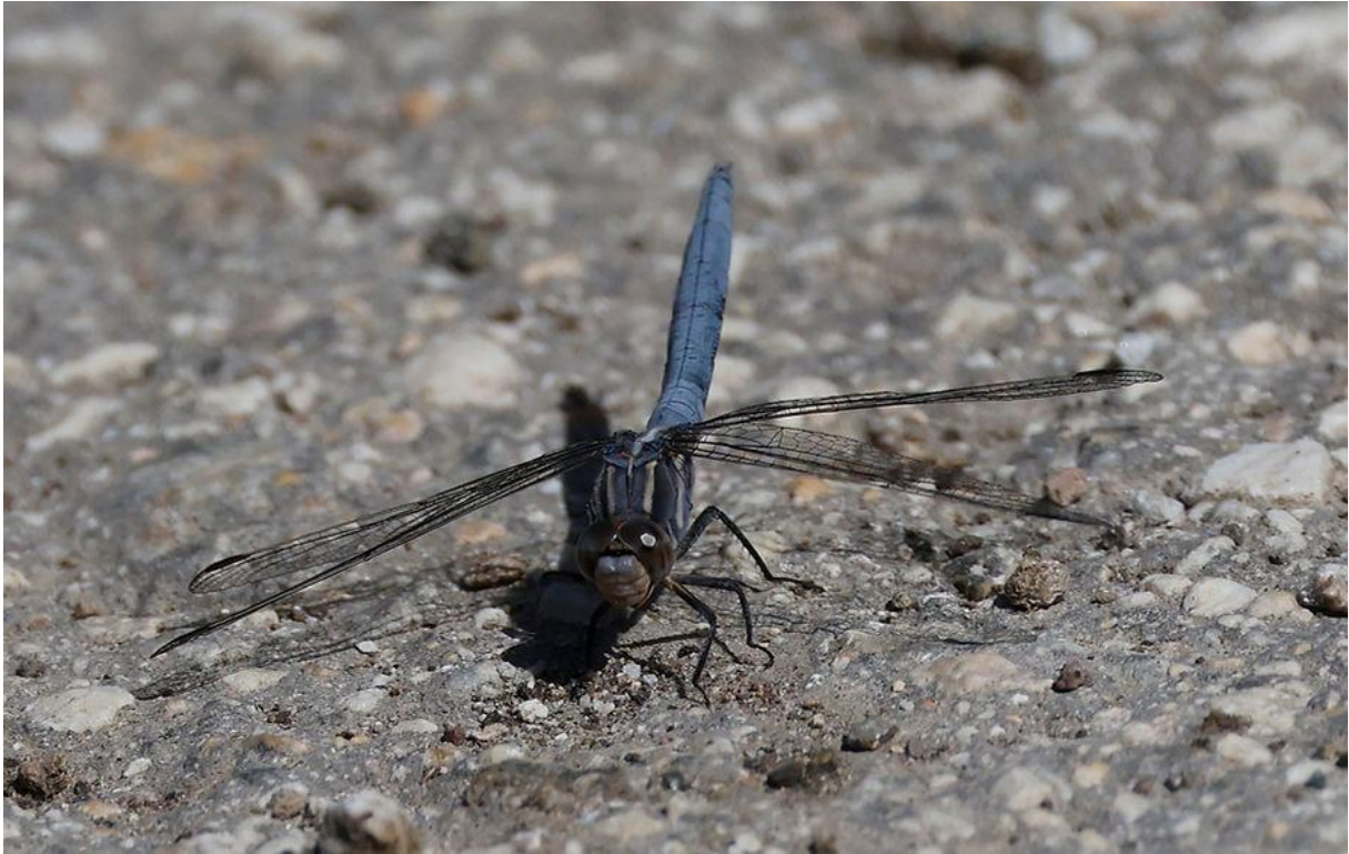
Man Kleine oeverlibel