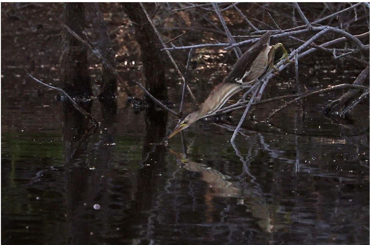
Woudaap. Foto van een avond ervoor, toen Marnix en ik zonder deelnemers het plasje kort hadden gecheckt.