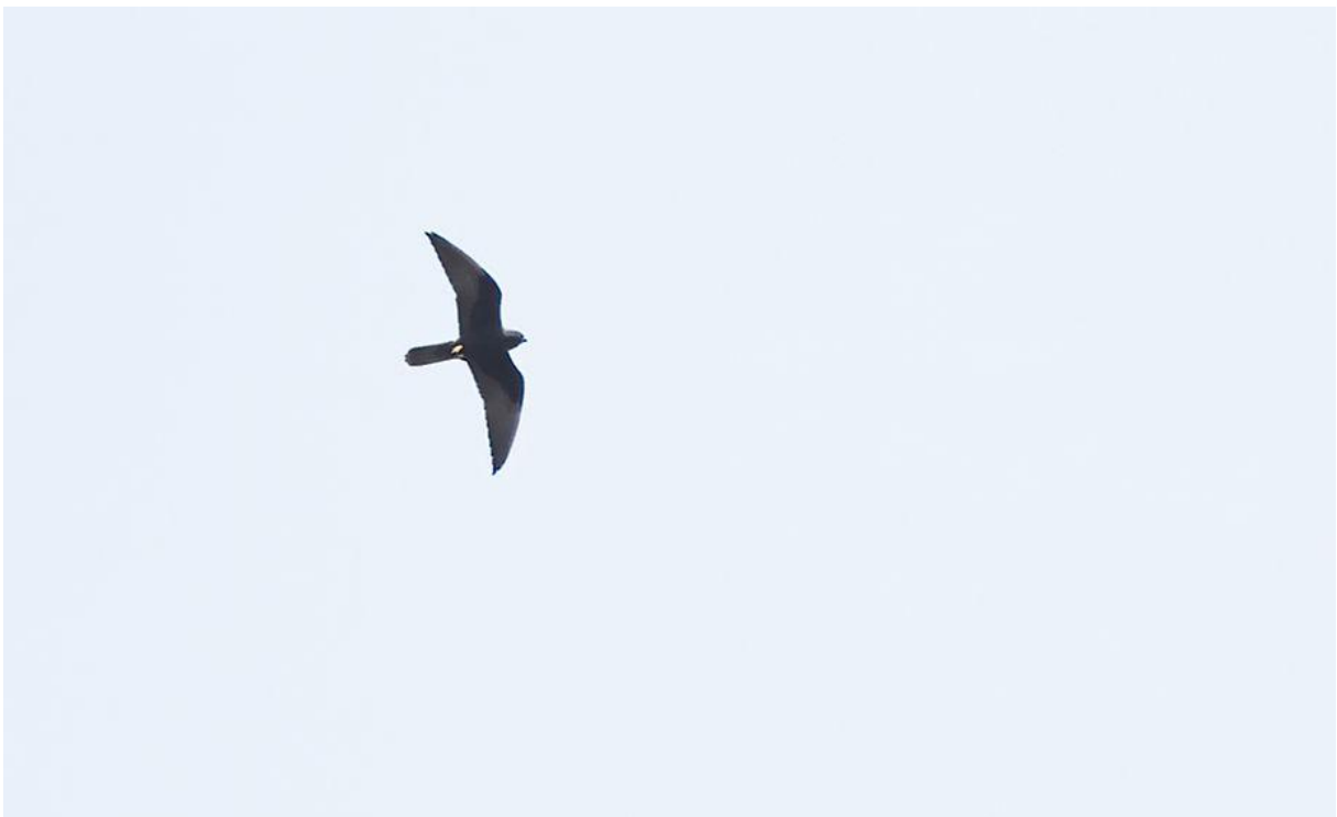
Persoonlijke favoriet: Eleonora's valk! Hopelijk ergens in de komende dagen op herhaling en dan iets lager.