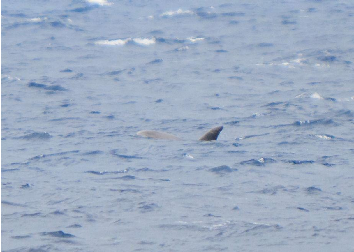
Tuimelaar (naar wij aannemen).