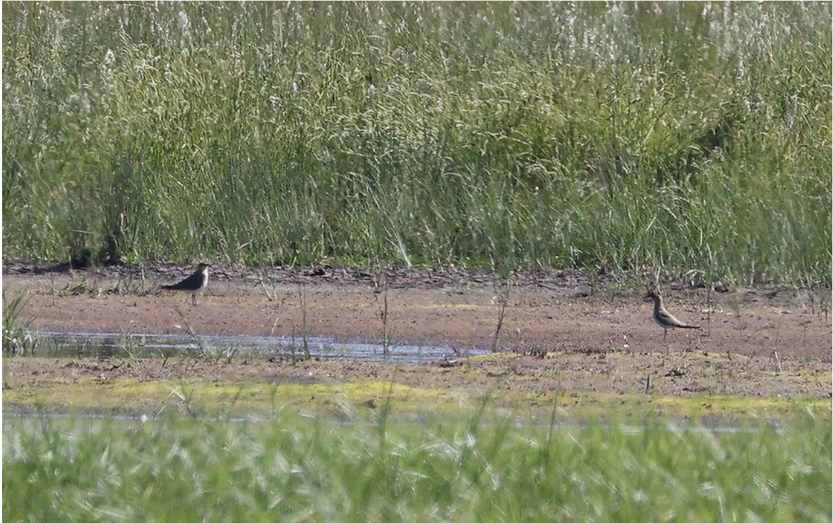
Bewijsje van de twee Vorkstaartplevieren.

Als laatste wilden we een eerste poging doen om een volgende specialiteit van het eiland, de Oostelijke rosse waaierstaart, te vinden. En zowaar, ook dit ging geheel volgens plan en in het (wat zachter wordende) namiddaglicht konden we allen genieten van deze subtiel mooie soort. Toen 'ie na z'n schitterende show uiteindelijk wegvloog, kreeg 'ie zelfs een applaus van de groep als bedankje!