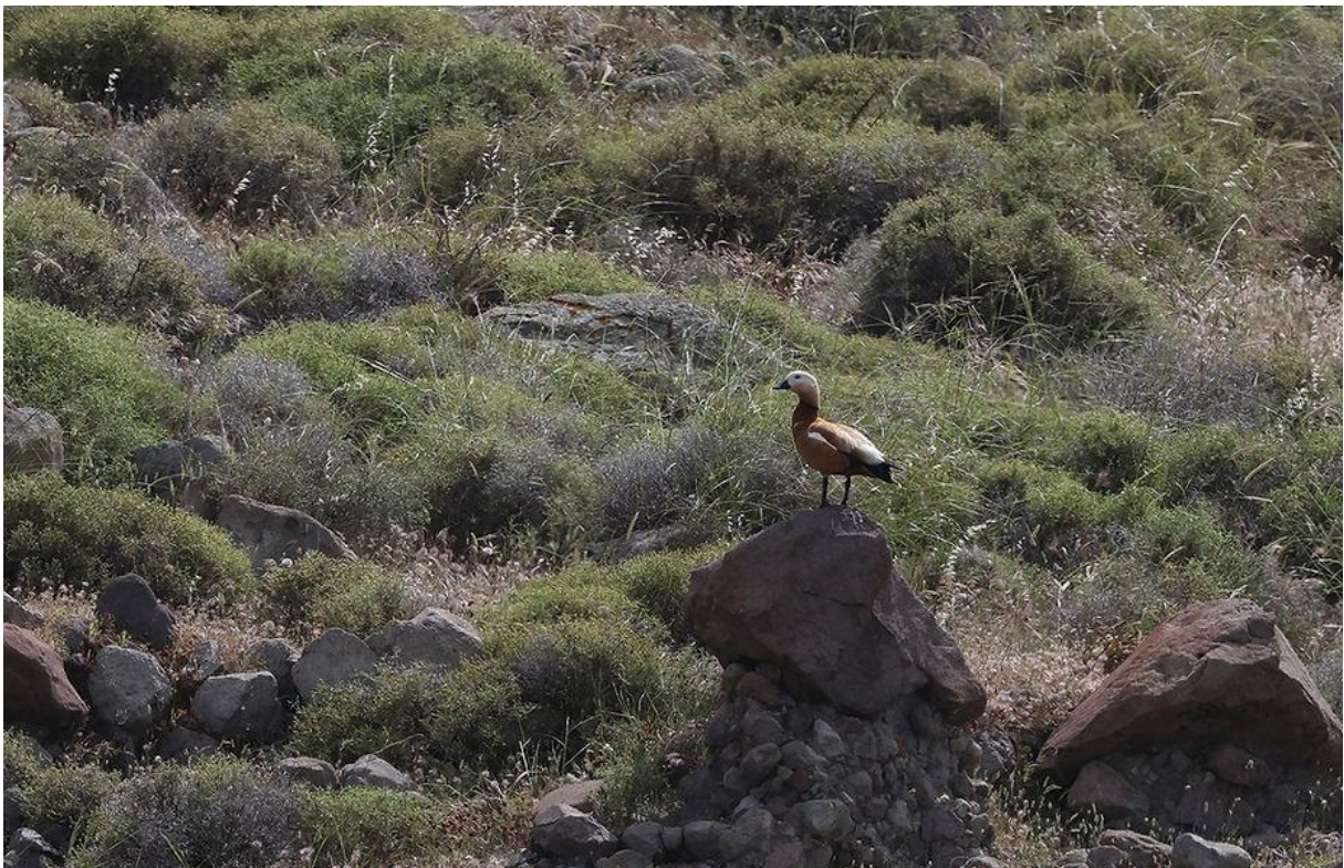
Casarca in een ander landschap dan waarin ik ze doorgaans zie.