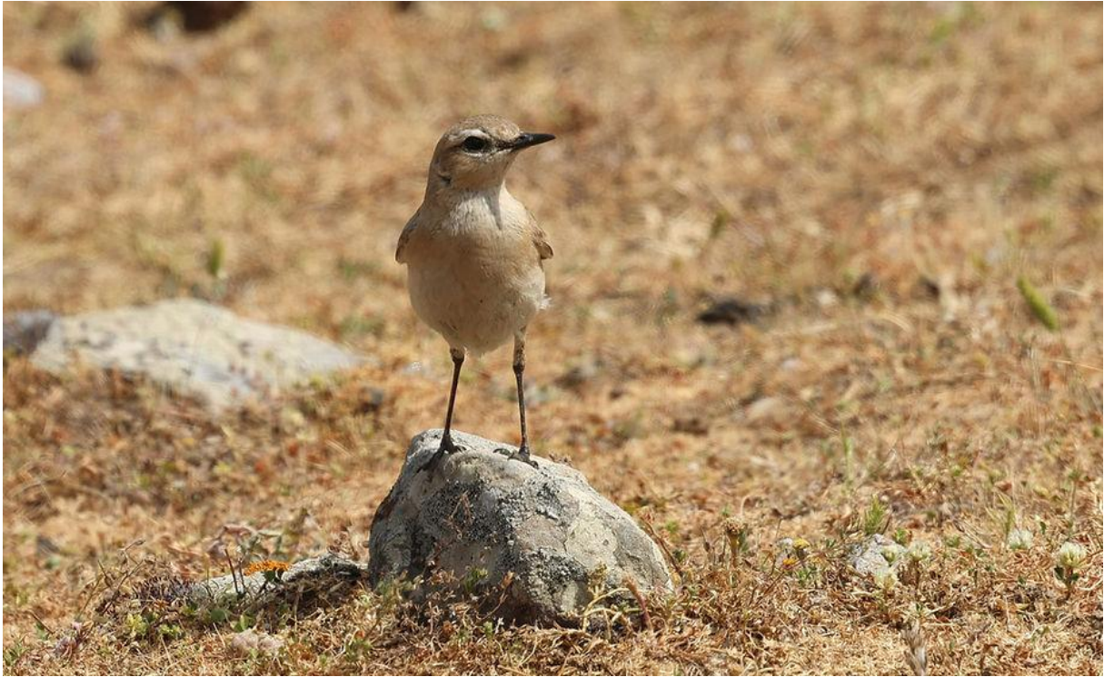
Izabeltapuit (Marco Bettink)