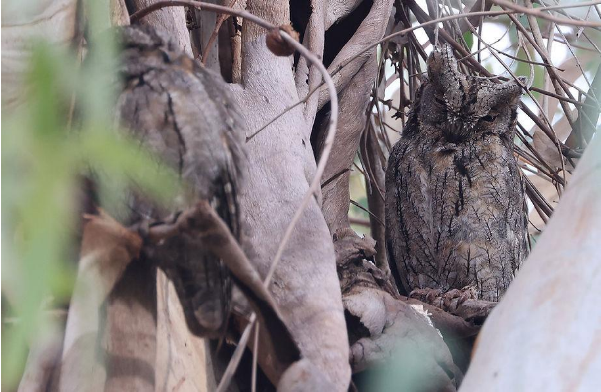
Twee (ja, twee!) Dwergooruilen!