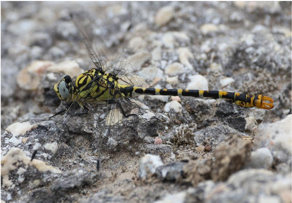
Kleine tanglibel van de oostelijke ondersoort

Na een vroeg diner met vele vriendelijke, afsluitende woorden ging de terugreis vervolgens zeer voorspoedig en zat de reis er alweer op...!