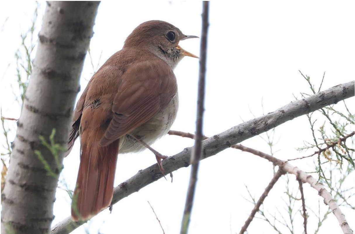
Nachtegaal bij het hotel