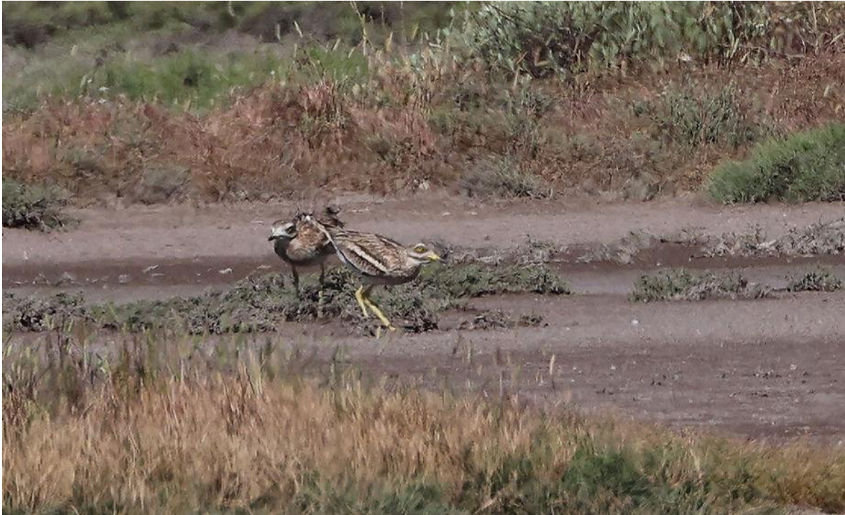
Grielen. Het was weer warm, dus de luchttrilling speelde alweer parten. Desalniettemin: prima!