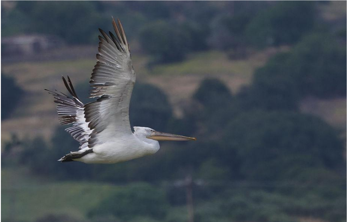
Machtige vogels: Kroeskoppelikaan!