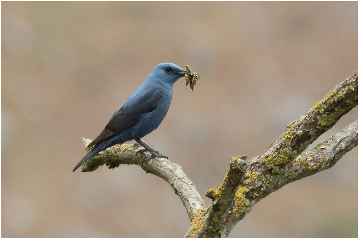
Blauwe rotslijster (Marco Bettink)