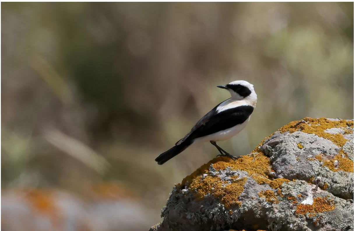
Oostelijke blonde tapuit