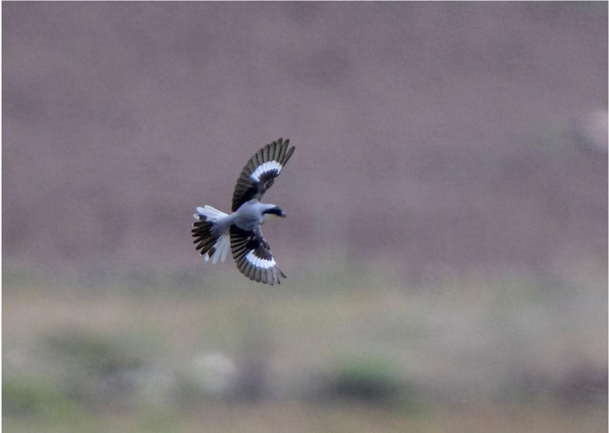
Kleine klapekster (Marnix Jonker)