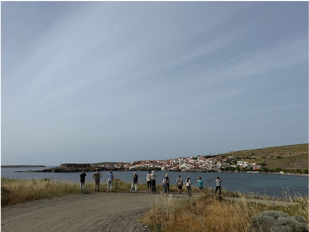
Sigri, prachtig dorp aan het eind van de weg