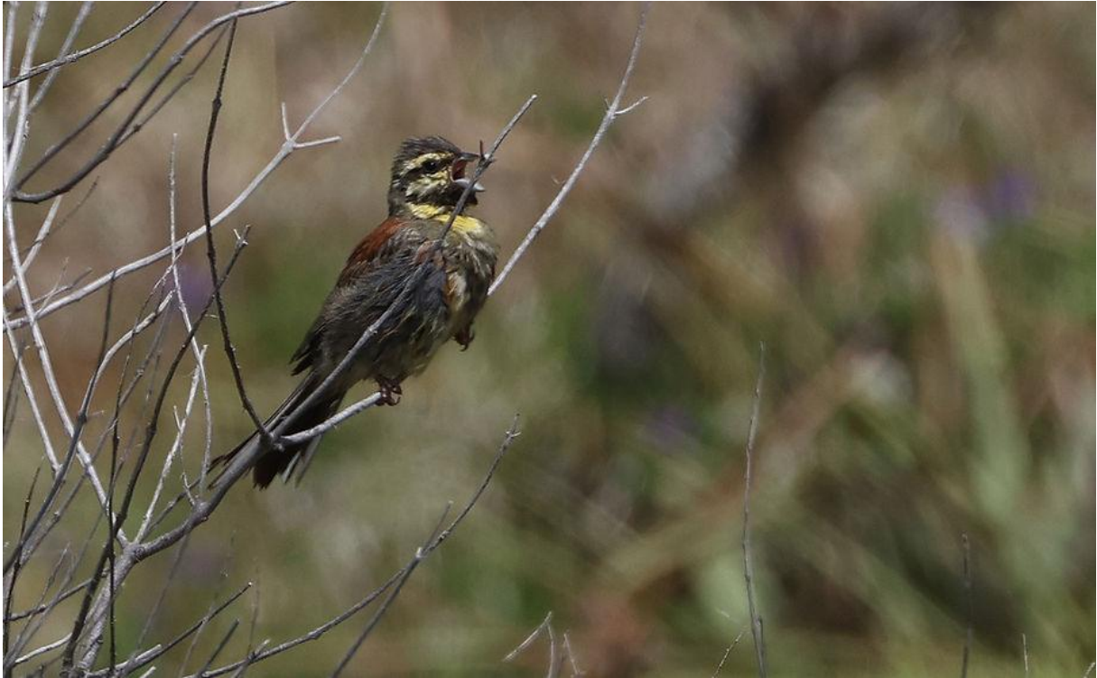
Cirlgors, net na een bad.