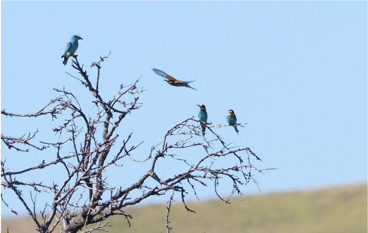
Scharrelaar en Bijeneters; wat een plaatje!