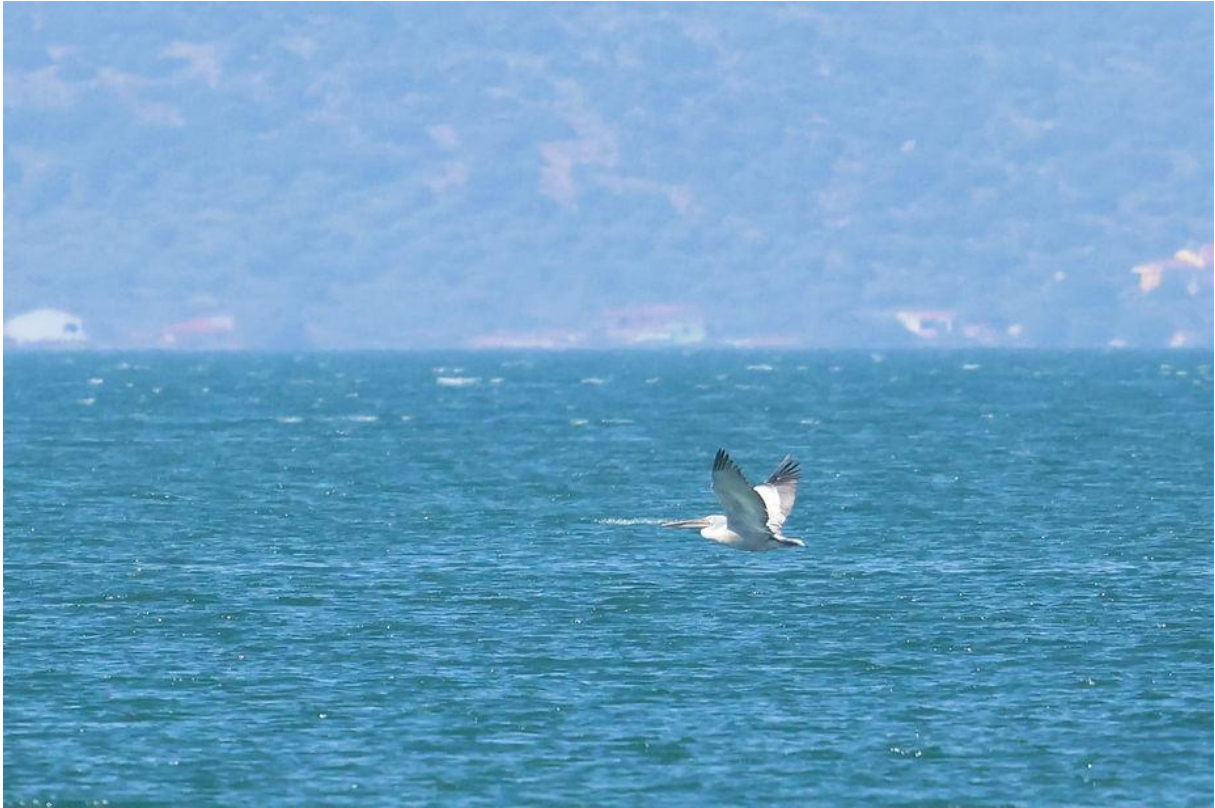
Kroeskoppelikaan (Marco Bettink)

Een tweede, wat groter nat gebied bracht wat minder vertier, maar eenmaal bij zee werden we verblijd met een stuk of 9 Kroeskoppelikanen maar vooral een langsvliegende, tweedejaars Dunbekmeeuw! Een leukerd, die zeker niet vanzelfsprekend is!