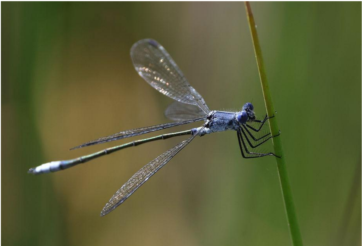
Ook weer leuk: Grote pantserjuffers