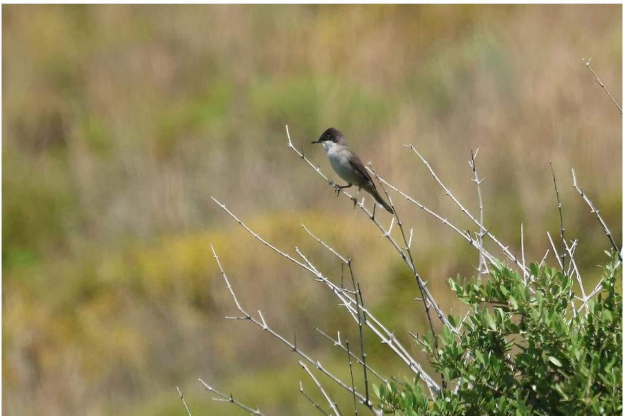
Oostelijke orpheusgrasmus (Marco Bettink)