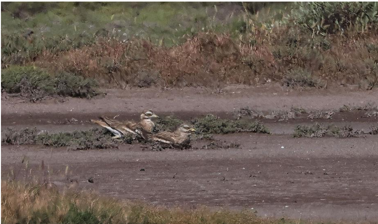
De wandeling vanaf hut 1 van de zoutpannen werd gedomineerd door twee Kroeskoppelikanen: een overvlieger en een vogel die langdurig in een kanaaltje parallel aan de zoutpannen foerageerde. Verder zagen we hier de eerste Witwangsterns van de trip, met daarbij ook Dwergsterns, Witvleugelsterns en Balkankwikstaarten, naast de gebruikelijke zoutpansoorten als Flamingo's en Steltkluten.