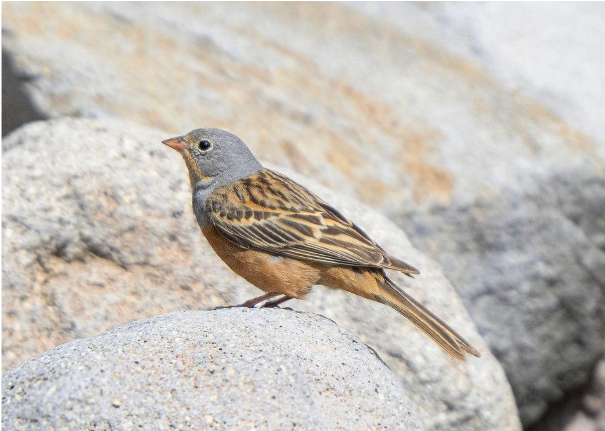
Bruinkeelortolaan (Marnix Jonker)

Naast het klauwierenkwartet was er natuurlijk nog veel meer om ons aan te vergapen. In de uurtjes op de bergweg zagen we o.a. Rotsmus (nu wel), Oostelijke blonde tapuit, Smyrnagors, Bruinkeelortolaan, Eleonora's valk, Rotsklever, Oostelijke orpheusgrasmus, Slangenarend, Grauwe gors, Rouwmees, Cirlgors, Zwartkopgors, Bijeneter, Casarca, Grote karekiet, Oostelijke valse spotvogel, Purperreiger, Ralreiger, Raaf, Slechtvalk, Grauwe vliegenvanger, Bosrietzanger en dan vergeet ik vast nog het een en ander. En nogmaals gezegd: dit alles in een decor om je vingers bij af te likken en bij werkelijk heerlijk weer. Het leek zowaar net vakantie ;-)