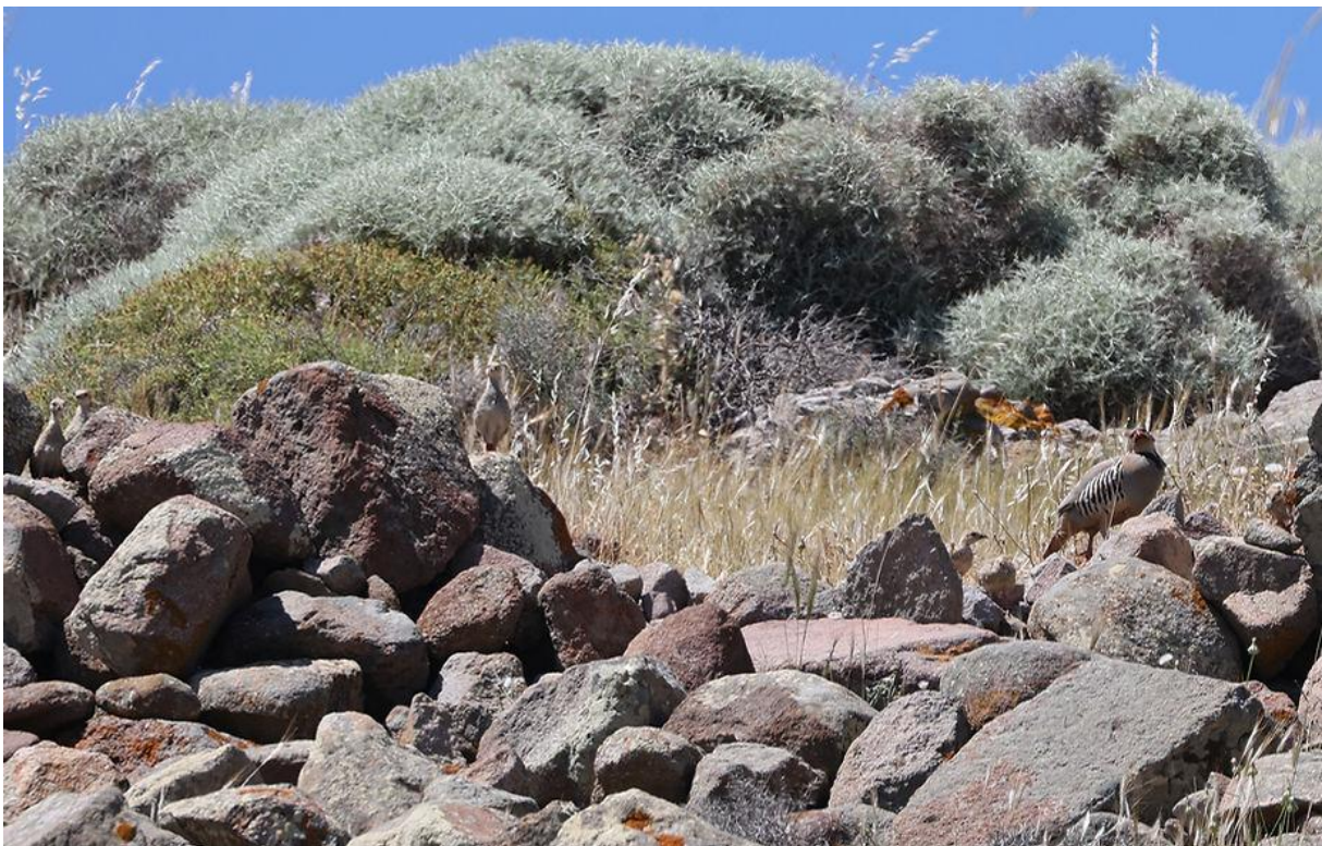
Aziatische steenpatrijs met zes jongen (ze staan alle op deze foto!)