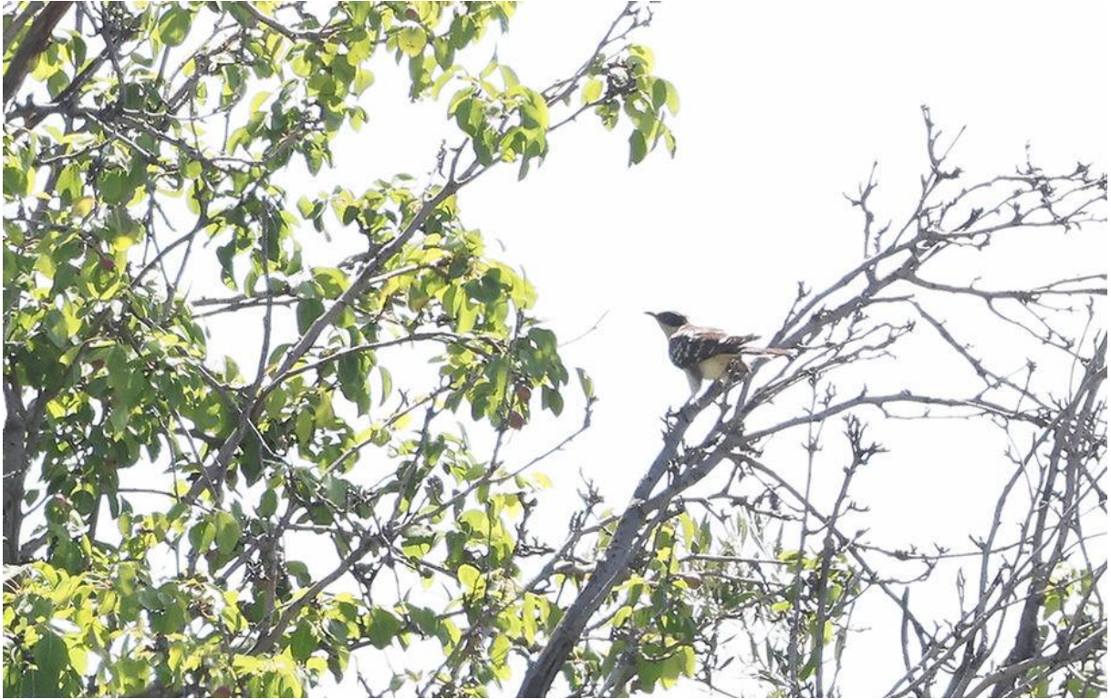
Beetje tegenlicht, maar daarin wel een Kuifkoekoek!