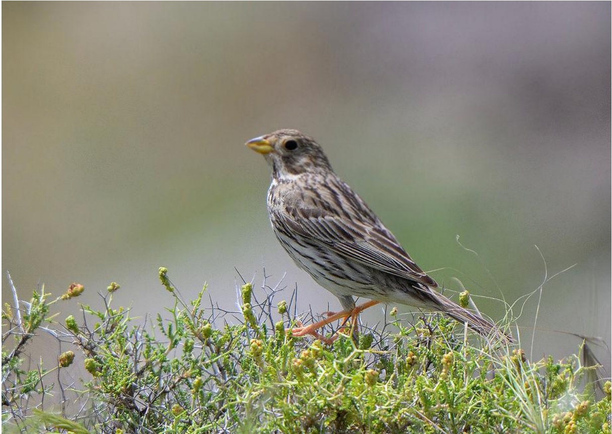
Grauwe gors (Marnix Jonker)