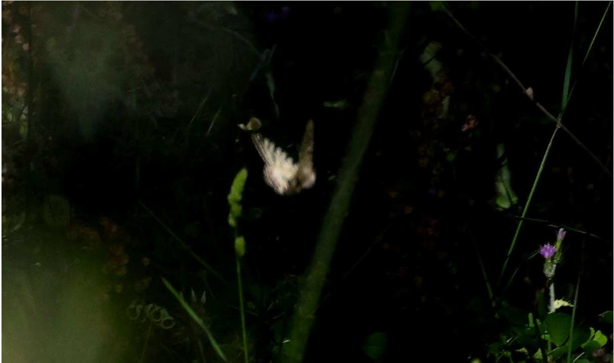
Zeer, zeer mager bewijsje van een voor mijnieuwe vlinder: Oostelijke pijpbloemvlinder!