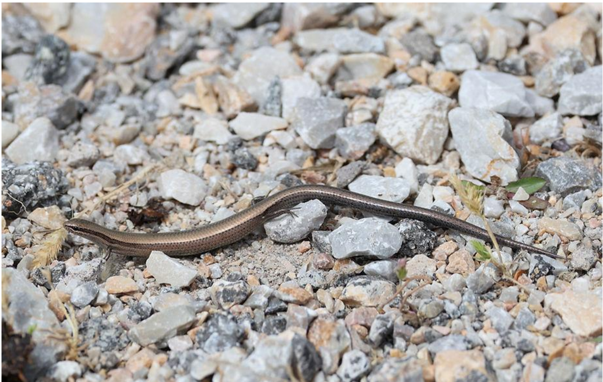
Budaks slangenooqskink, iets tussen een hagedis en een hazelworm in!