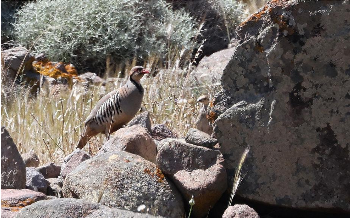
Aziatische steenpatrijs met jong

eerste Kleine torenvalken van de trip, alsmede Arendbuizerd, Rotsklever, Bruinkeelortolaan, Alpengierzwaluw en Paapje.