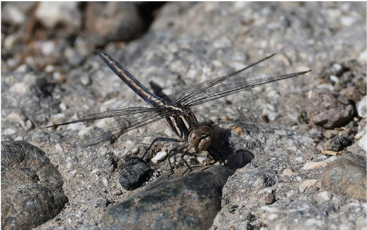
Vrouw Kleine oeverlibel

Op de weg terug naar het hotel reden we nog even langs de zoutpannen (o.a. Kroeskoppelikanen, naast natuurlijk honderden Flamingo's) en reden we via een hobbelweg langs de rivier (bracht geen nieuwe soorten meer) naar een plek waar een groep Bijeneters zich in mooi licht prachtig jagend liet zien.