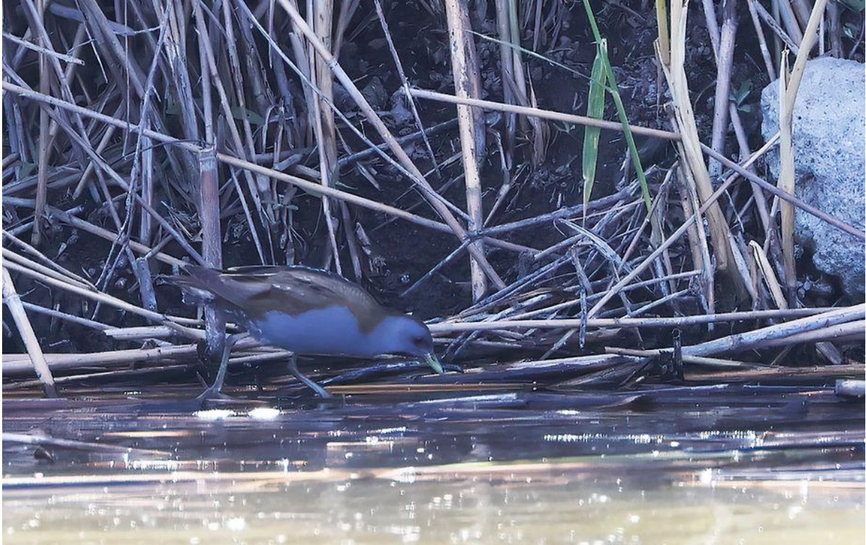
Klein waterhoen. Moeilijke lichtomstandigheden, dus magere plaatjes, maar een superwaarneming!

De volgende bestemming was Lake Metochi, een op het eerste oog vrij oninteressante plas water die dat bij nadere inspectie toch vaak niet blijkt te zijn. Eerst zagen we een Ralreiger, vervolgens een Woudaap en via een Dodaars kwamen we uiteindelijk uit bij... een mannetje Klein waterhoen! Ook dronken hier regelmatig zwaluwen (waaronder Roodstuiten) en werd een Arendbuizerd de tent uitgejaagd door lokale Geelpootmeeuwen. Zowaar niet misselijk!