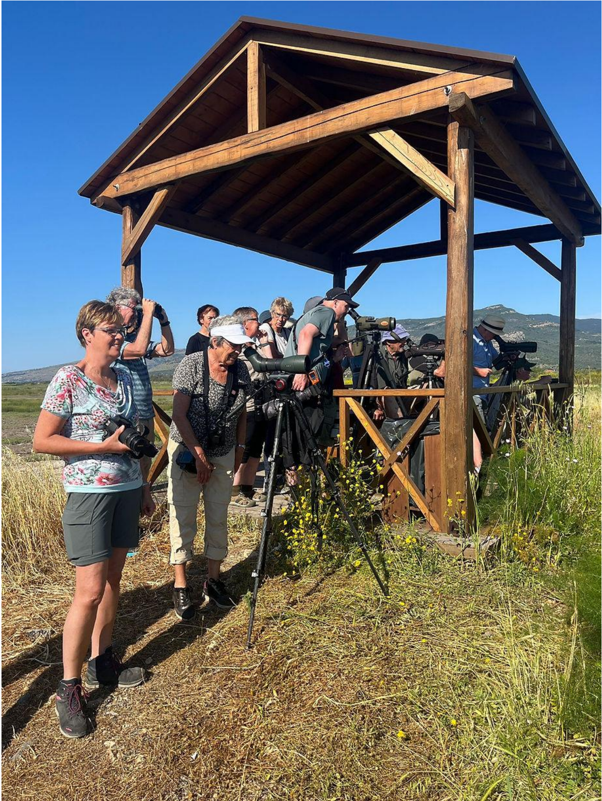
Poging tot Griel, met matig succes.