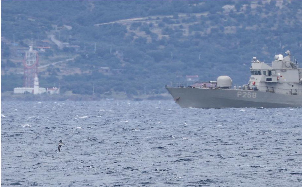
Griekse kustwacht, Turkije op de achtergrond en een Scopoli's die zich van spanningen en grenzen niets aantrekt.