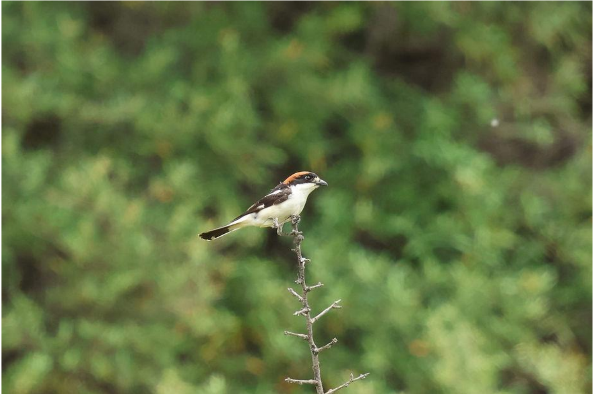
Roodkopklauwier (Marco Bettink)

We volgden hierna het weggetje door de bergen en maakten wat korte stops. Op de plek waar we vorig jaar tegen Turkse rombouten aanblunderden, vonden we ze dit jaar ook weer. Wat minder verrassend, maar wel een fijn weerzien!