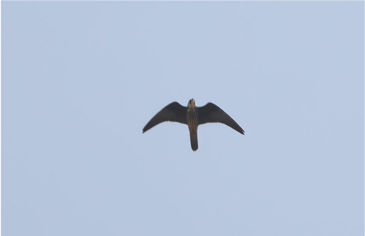
Eleonora's valk, lichtere vorm