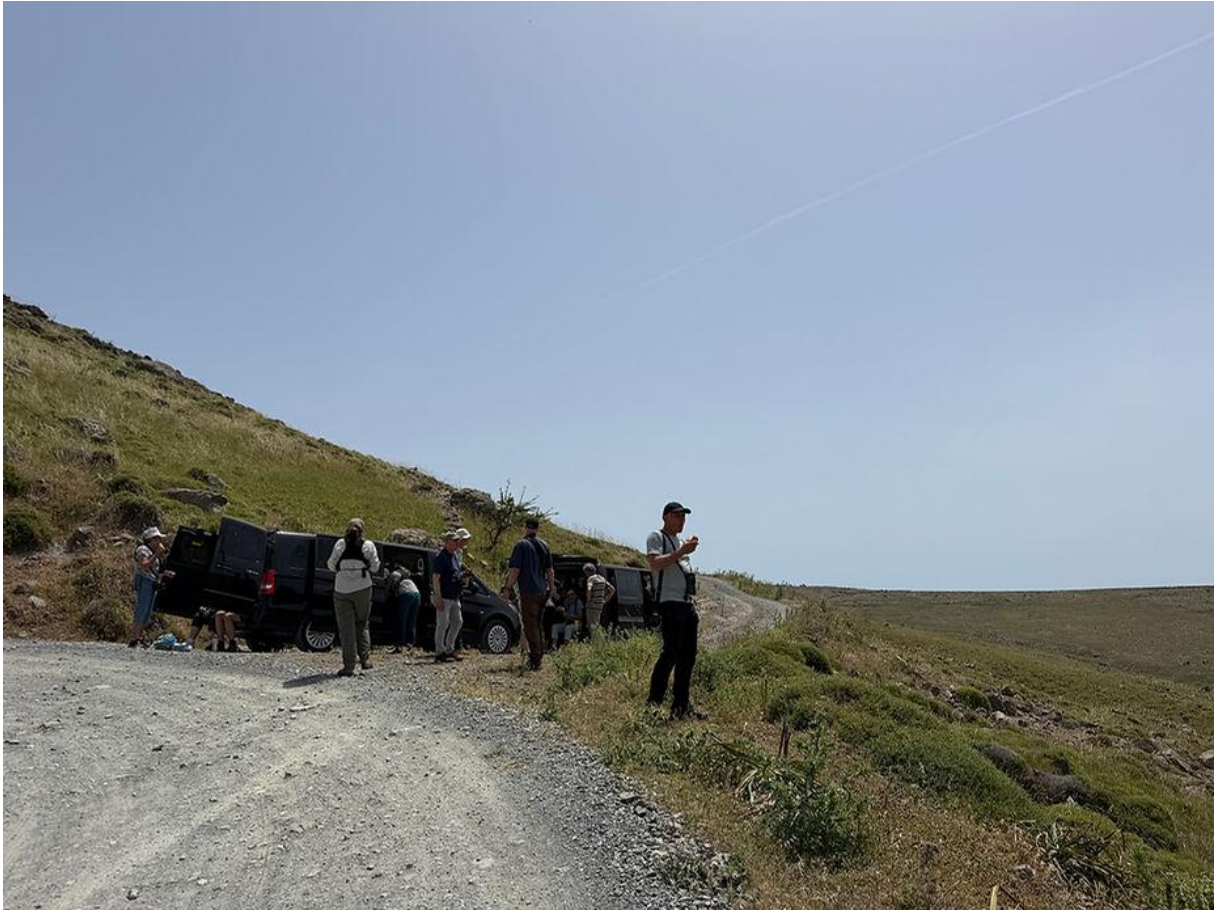
Lunch met uitzicht