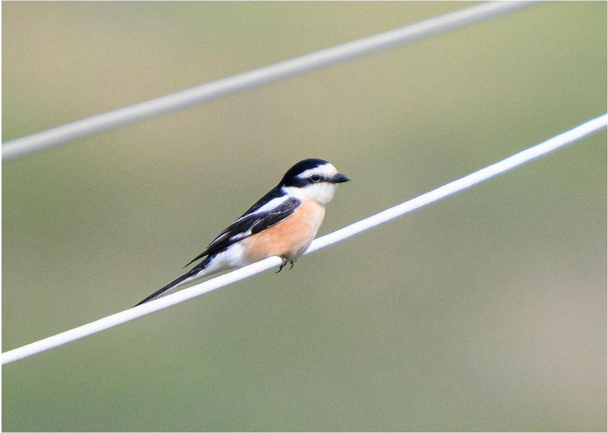
Maskerklauwier (Marnix Jonker)

waren de enorme aantallen Grauwe klauwieren, maar over de hele weg zagen we ook zeker 4 Kleine klapeksters, enkele Roodkopklauwieren en een Maskerklauwier.