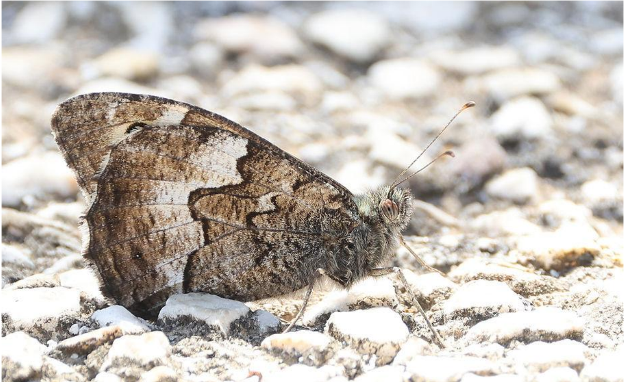
Turkse heivlinder (met een klein ?)

Na een bakje troost in Loutra leverde een wandeling dit pittoreske dorpje gelukkig wel een nieuwe soort voor iedereen op in de vorm van zeker drie Palmtortels. Ook vlogen hier Alpengierzwaluwen en een Slechtvalk over. Na de (verlate) lunch vorderde de middag al gestaag; hoe kan het toch dat de tijd op dit soort reizen altijd veel sneller lijkt te gaan dan op een gemiddelde dag thuis!?