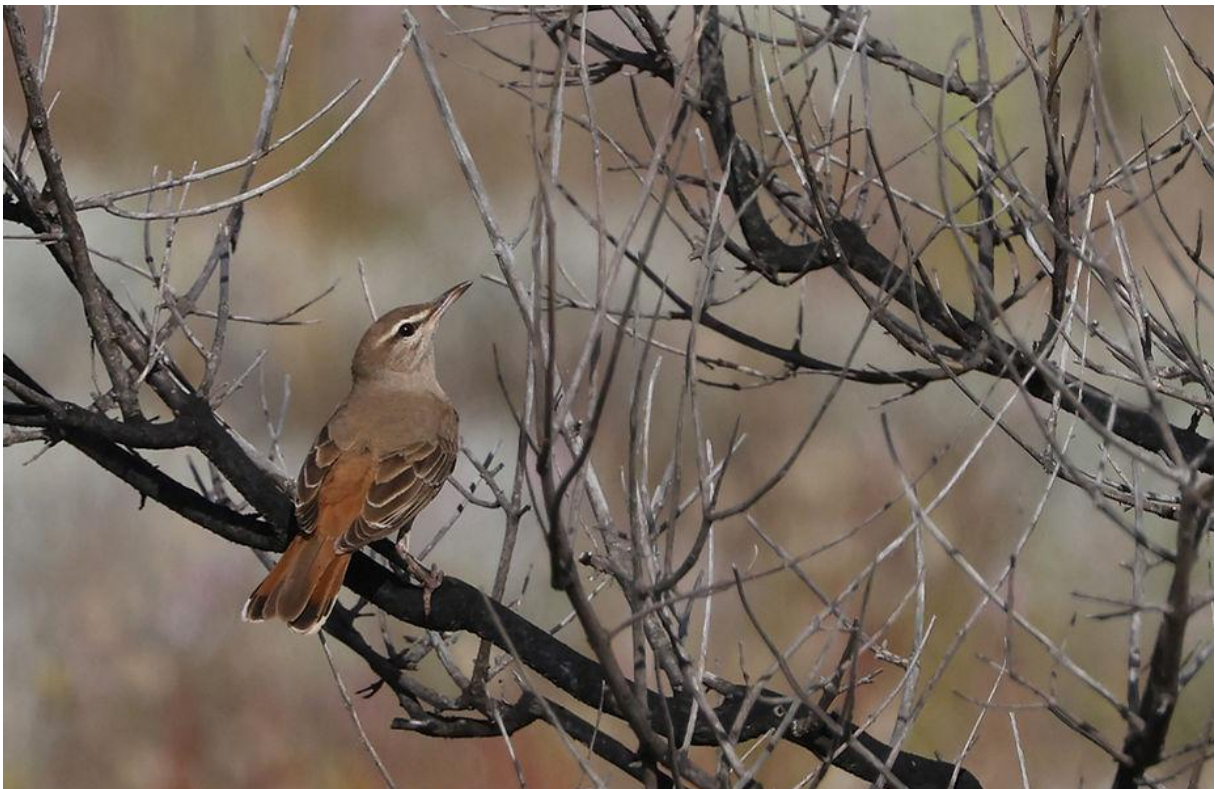
Oostelijke rosse waaierstaart

Als laatste wilden we een eerste poging doen om een volgende specialiteit van het eiland, de Oostelijke rosse waaierstaart, te vinden. En zowaar, ook dit ging geheel volgens plan en in het (wat zachter wordende) namiddaglicht konden we allen genieten van deze subtiel mooie soort. Toen 'ie na z'n schitterende show uiteindelijk wegvloog, kreeg 'ie zelfs een applaus van de groep als bedankje!