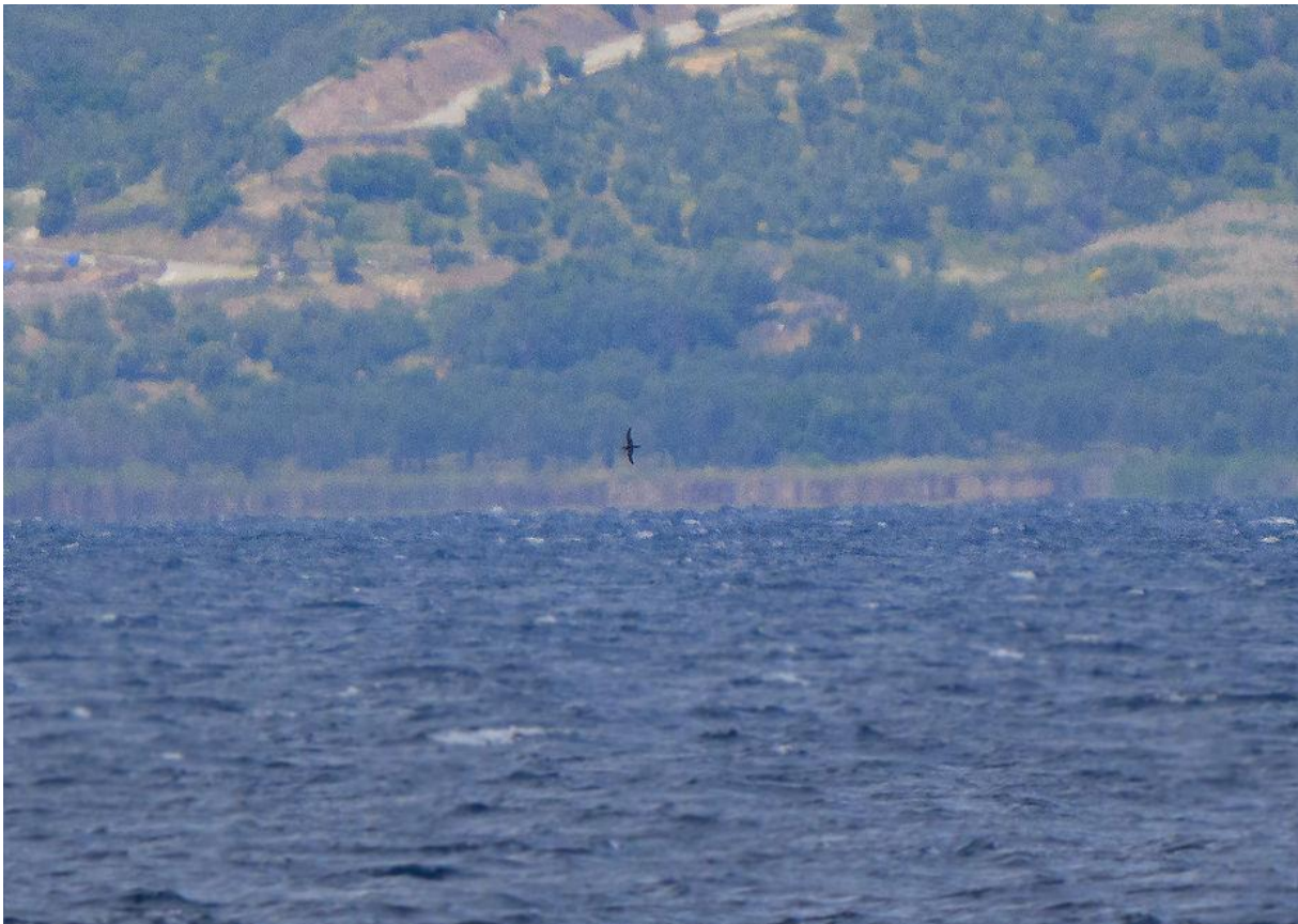
Yelkouan pijlstormvogel (Marnix Jonker)