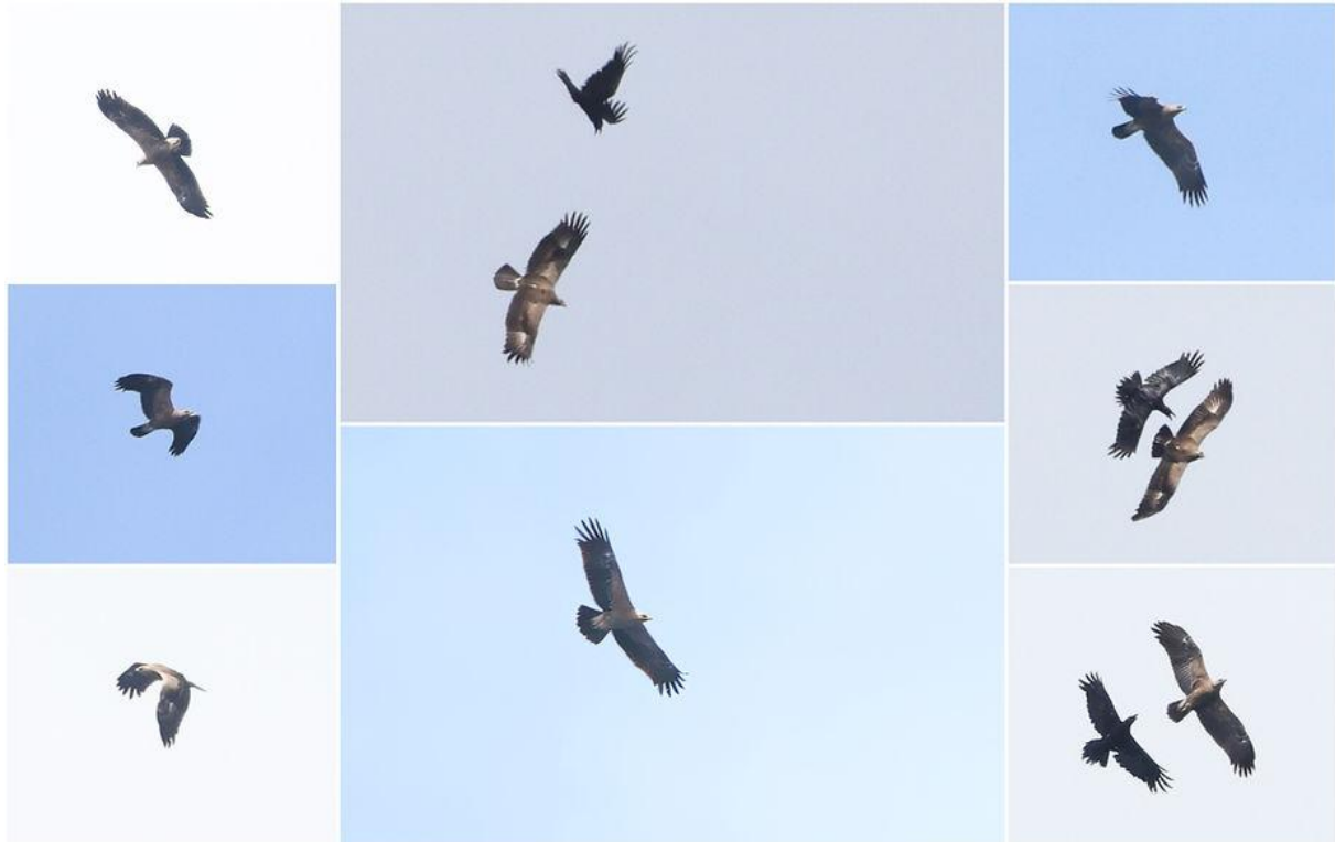
Compilatie van de Schreeuwarend (met Raaf; ook flinke jongens!)

Vanaf het lunch/zee-uitkijkpunt volgden we vervolgens een landschappelijk beeldschoon maar onverhard en soms uitdagend weggetje langs de noordrand van het eiland. Dat bracht de nodige soorten die we al eerder hadden gezien, maar toen we stopten voor drie mooi jagende Eleonora's valken werden we eindelijk beloond voor het constant afspeuren van de lucht: een arend (en een keer geen Slangenarend) zweefde bij kijkerbeeld binnen! Ik schreeuwde meteen Schreeuwarend, werd nog even aan het twijfelen gebracht door de lichte ondervleugelde kveren (ik zie ze te weinig ;-)), maar al vlot was de identiteit bevestigd. De vogel leek te willen oversteken naar Turkije, maar werd aangevallen door een Raaf, die 'm weer het land in en ons zicht uit joeg. Gelukkig had iedereen 'm mooi gezien en heerste er tevredenheid alom. Het was het soorttechnische hoogtepunt van de dag, de eerste van drie dagen op rij waarbij de soort die vetgedrukt in het verslag zou mogen begon met de letter S (om het eerste deel van de misschien wat vergezochte blogtitel te verklaren).