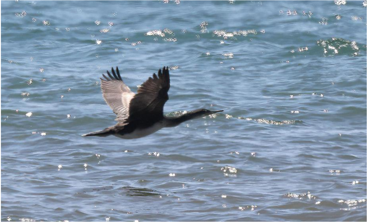
Mediterrane kuifaalscholver in Mediterrane warmtetrilling