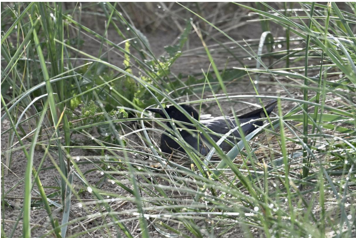
Amerikaanse Zwarte Stern, Long Nanny

Binnen onze groep wilden een paar deelnemers echt vroeg op pad om te vogelen. Ik ging daarom voor het ontbijt samen met hen naar het Long Nanny Reserve in de Beadnell Bay. Dit mooie duin- en kweldergebied heeft een grote diversiteit aan vogelsoorten. Rond half zeven liepen wij al over de smalle paden door de duinen. Wij hoorden Veldleeuwerik , Graspieper en Roodborsttapuit . Bij de stern kolonie ontdekten wij broedende Noordse Stern , Dwergstern en Bontbekplevier . In de duinen broedt voor het derde achtereenvolgende jaar ook een Amerikaanse Zwarte Stern die gepaard is met een Noordse Stern . Deze hebben wij heel mooi en van dichtbij kunnen zien. Een broedende Middelste Zaagbek zat op het meertje in de kwelder. Na deze mooie waarneming liepen wij terug naar de auto toen er opeens een jagende Kerkuil laag over ons heen vloog. Dat was een schitterend moment en dat terwijl de zon al aardig aan het schijnen was. Wij hadden nog wat tijd over en reden naar het dorpje Low Newton-by-the-Sea. Hier ontdekten wij een adulte Roze Spreeuw tussen de honderden Spreeuwen . Dit was een ochtend om niet te vergeten.