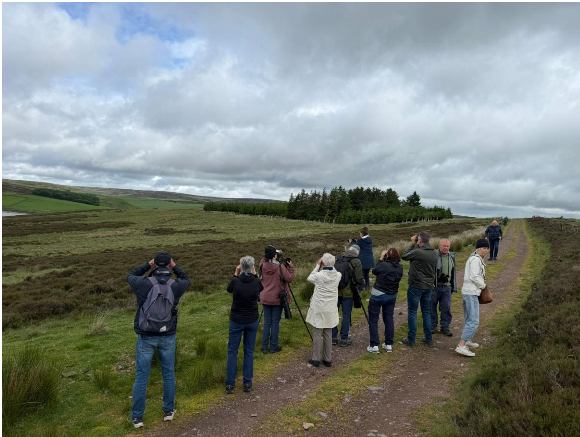
De hele groep is aan het speuren, Lammermuir Hills