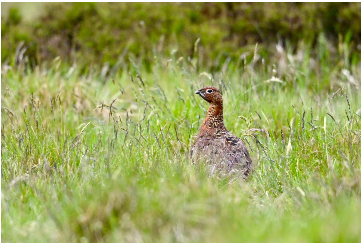
Schots Sneeuwhoen man, Lammermuir Hills