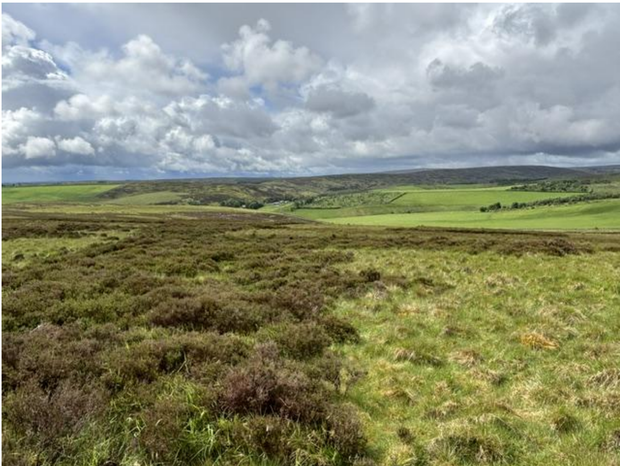
Lammermuir Hills, de plek van het Schots Sneeuwhoen

Vandaag stond de boottocht naar Bass Rock op het programma. Het weer voor vandaag zag er goed uit. Wij besloten de ochtend te besteden in de Lammermuir Hills. Dat betekende dat wij de grens van Schotland zouden kruisen. Altijd weer een leuk moment. De Lammermuir Hills zijn veel wijdsder dan de Cheviot Hills waar wij dinsdag waren. De heide strekt zich tot aan de horizon uit. Meerdere keren zagen wij Schots Sneeuwhoen paartjes met jongen. Het vogelen vanuit de auto was aangenaam, omdat de regen soms met flinke buien over ons heen kwam. Baltsende Watersnippen en Wulpen en zingende Veldleeuweriken waren een fijne afwisseling.