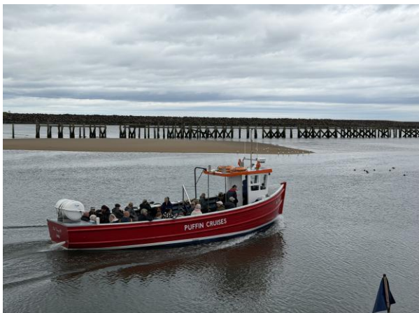
Boot naar Coquet Island