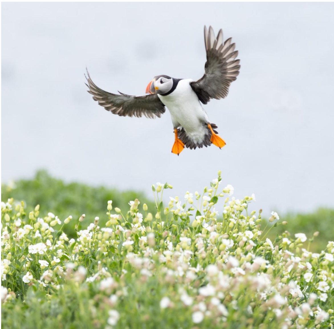
Papegaiduiker, Inner Farne