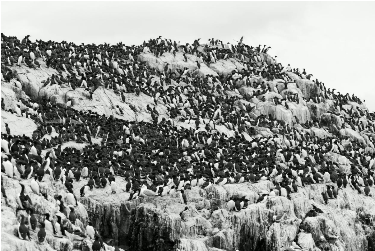
Alken en Zeekoeten, Inner Farne