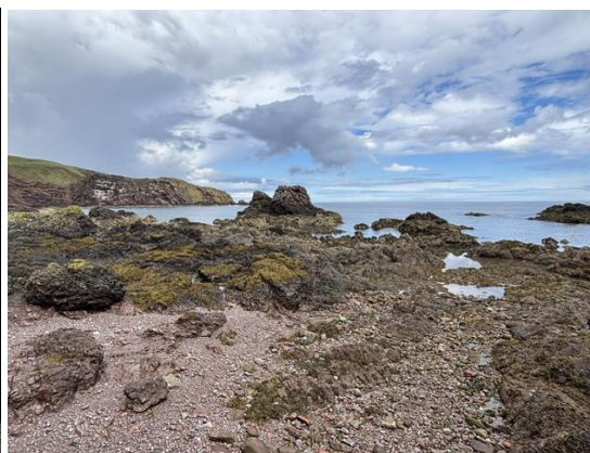
St. Abbs Head