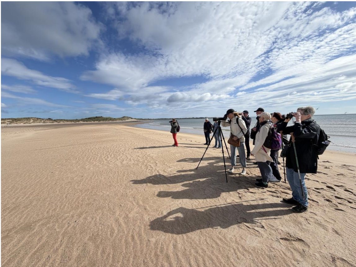
Long Nanny Reserve strand bij de Dwergsterns