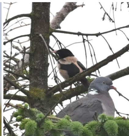
Roze Spreeuw, Low Newton-by-the-Sea