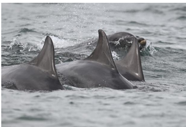
Tuimelaars, Havenmondning Amble