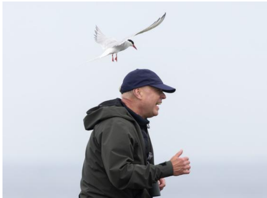
Weg jij indringer, Inner Farne