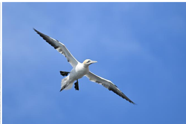
Jan-van-Gent, Bass Rock