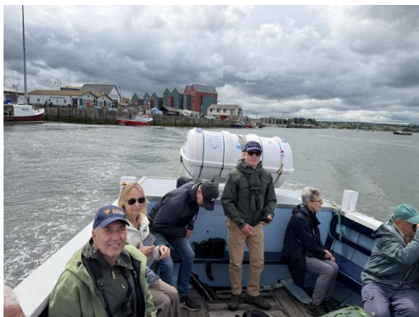
Op weg naar Coquet Island