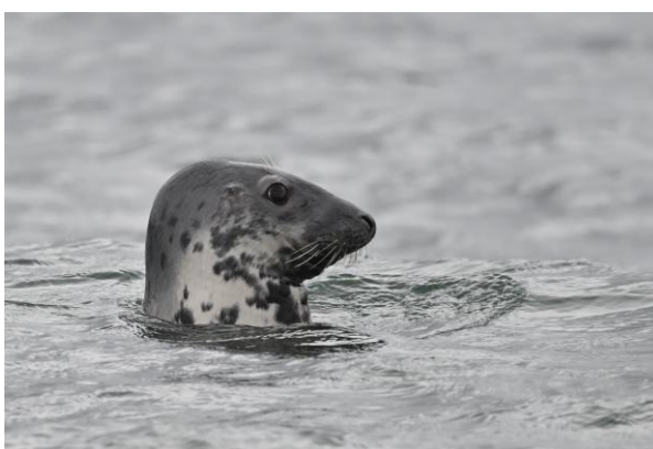
Grijze Zeehond, Coquet Island

Die overtocht moet goed uitgekend worden, want met eb ligt het haventje droog en kun je er niet meer uit of in. Onderweg zien wij al verschillende zeevogels vanaf de boot. Zo zagen we Zeeoet, Alk, Jan-van-Gent, Drieteenmeeuw, Grote Stern en Papegaaiduiker rond en over de boot vliegen. Noordse Stormvogels keilden op de wind naast ons. Het echte hoogtepunt van Coquet Island is natuurlijk de Dougalls Stern . Wij zagen een stuk of 15 van deze sierlijke sterns met donkere snavel en roze getinte buik. Coquet Island is de enige plek aan de oostkust van Engeland waar deze soort broedt. Nadat iedereen tevreden de camera's op volle toeren had laten draaien voeren wij terug naar de haven. Er was nog wat tijd over om naar Hauxley Nature Reserve te rijden. Helaas sloot het natuurgebied al om half zes en besloten wij om naar het hotel terug te rijden. Onder het genot van een prima maaltijd namen wij de dag en de checklijst nog even door.