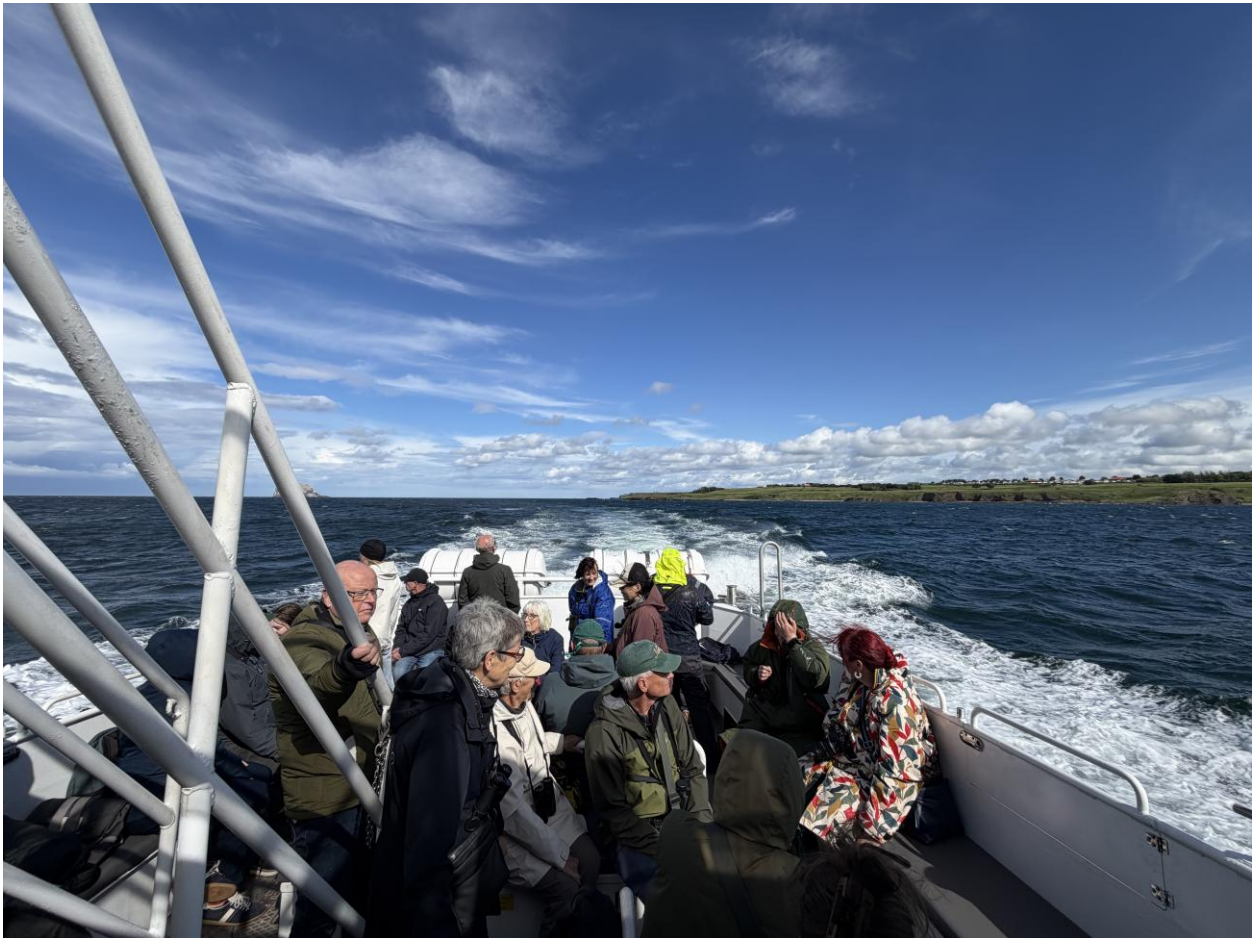
Op weg naar Bass Rock

Na deze mooie waarnemingen zijn wij naar North Berwick gereden waar wij wat broodjes en muffins hebben gegeten, voordat wij de boot op stapten naar Bass Rock. Je kunt maar beter een gevulde maag hebben wanneer je de zee op gaat. Bass Rock is een avontuur. Wat een enorme hoge rots. Het ligt 2,5 km uit de kust van East Lothian en is 107 meter hoog. Met 105000 broedparen is het de grootste kolonie Jan-van-Genten ter wereld op één rots. Je vaart eromheen en je ziet duizenden Jan-van-Genten, Papegaaiduikers, Alken en Zeekoeten . Het eiland is wit van de uitwerpselen en ruikt ook als je de wind in de neus krijgt. De kapitein legde van alles uit over het eiland en je krijgt allemaal een kans om vanaf het bovendek foto's te maken van de vogels. Wat een indrukwekkend schouwspel.