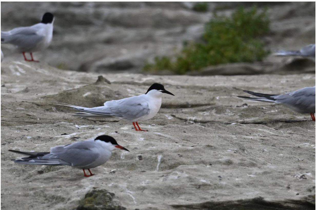
Dougalls Stern, Coquet Island