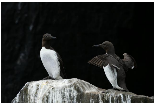
Zeekoeten, links één gebilde vorm, Inner Farne