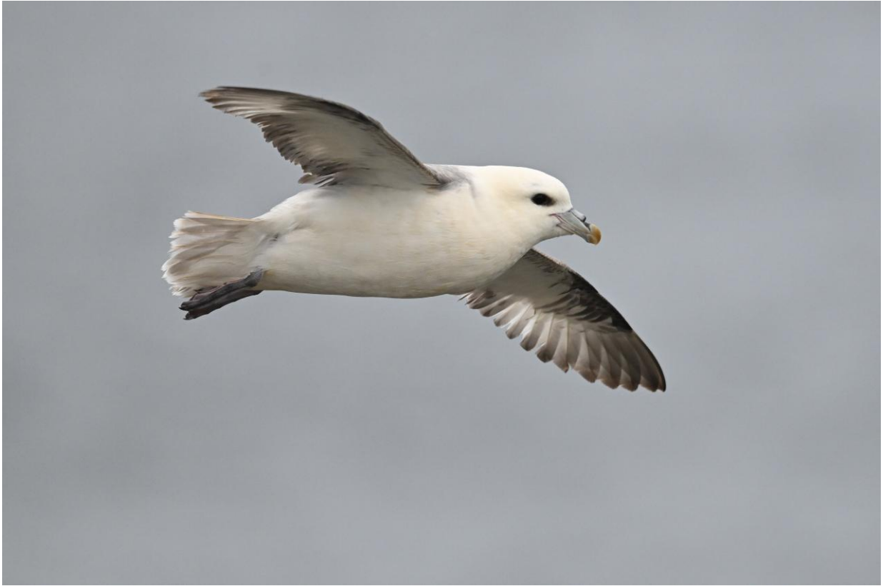
Noordse Stormvogel, Coquet Island