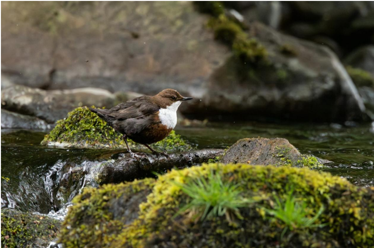
Waterspreeuw, Cheviot Hills

Wij zaten al vroeg aan ons Engels ontbijt. Voor de mensen die geen witte bonen in tomatensaus wilden was er genoeg keuze. Het ontbijt was erg goed. De groep was klaar voor een nieuwe dag. Wij gaan op weg naar de Cheviot Hills. Wat opvalt is het grote aantal Roeken die je onderweg ziet. En natuurlijk de Rouwkwikstaart . Een klein uurtje rijden en je zit in de prachtige heuvels met kleine ravijntjes en smalle stroompjes. Een uitstekend gebied voor Rode Patrijs , Schots Sneeuwhoen en Waterspreeuw . Onderweg naar de parkeerplaats stopten wij meermaals op beboste plekken om goed naar de zangvogels te luisteren. Wij hoorden Zanglijster , Grote Lijster , Matkop , Tjiftjaf , Fitis en Sijs . Op de hellingen zagen wij een Rode Patrijs die zich helaas niet door iedereen liet fotograferen. De tweede bus had een beetje pech, maar gelukkig bleken er een heel groepje tevoorschijn te komen. Ook al was het maar voor heel even. Een Rode Wouw kwam ook even overvliegen. Wat een mooie vogels zijn dat toch. Vanaf de parkeerplaats gingen wij een stukje wandelen langs een snelstromende beek en een mooie berghelling. Al snel werd een Waterspreeuw en Grote Gele Kwikstaart ontdekt die door iedereen langdurig in de telescoop bekeken kon worden. Op de hellingen zagen wij Schots Sneeuwhoen , Roodborsttapuit , Tapuit en een baltsende Wulp .