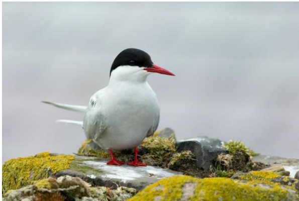
Noordse Stern, Inner Farne