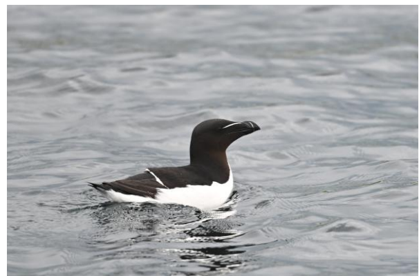
Jan-van-Gent tussen het Zeekoeten geweld en Alk, Inner Farne