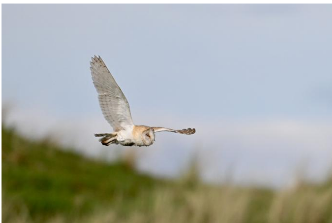
Kerkuil, Long Nanny