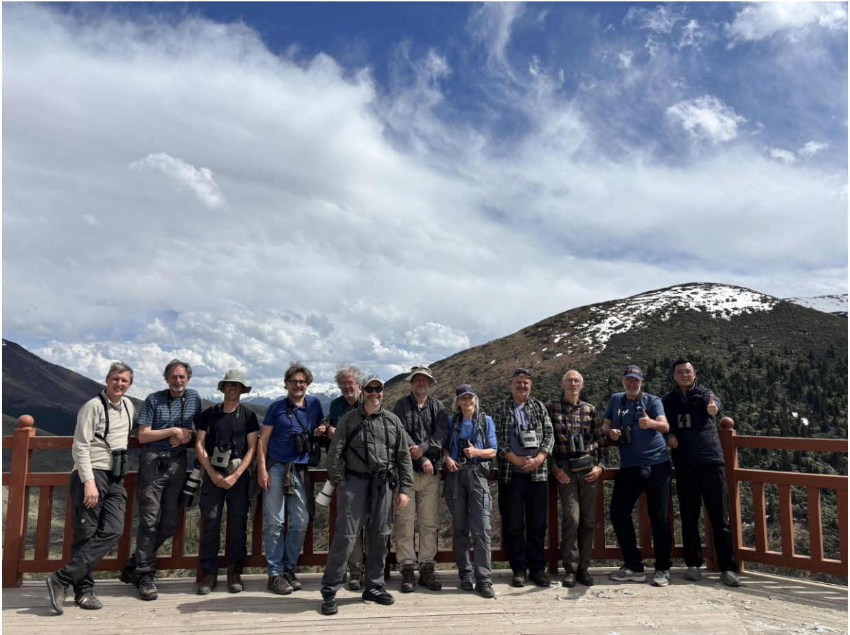
De 2026 Birdingbreaks-groep op het hoogste punt (4114 meter) van deze reis. Deelnemer Koos ontbreekt op deze foto.