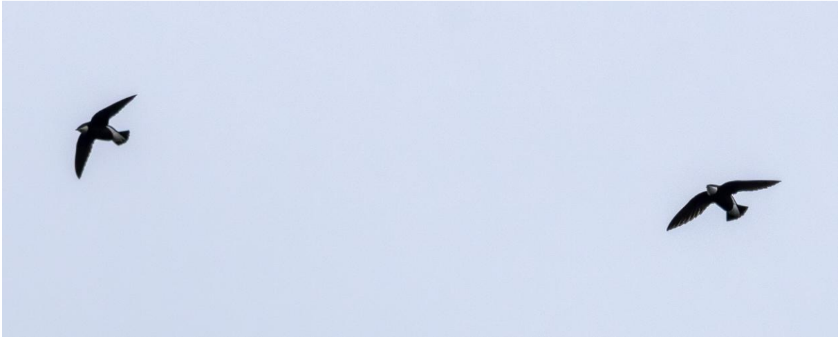
White-throated Needletails door Bauke Kortleve

De opwinding is voelbaar bij de groep. Vandaag staat er een spectaculair nieuw gebied op het programma. We zullen om 8 uur per gondel omhooggaan naar de top van Wawushan, met 2800 meter de hoogste tafelberg van Azië en de een na hoogste tafelberg van de wereld. De route gaat omhoog via twee liften en bij de eerste stappen we even uit om een korte wandeling op deze hoogte te maken en om kans te maken op een ander spectrum soorten dan op grotere meter hoogte. Al snel zien we diverse warblers waarvan we in ieder geval Martens Warbler , en Large-billed Leaf-warbler goed kunnen zien. Ook zien we hier op grote hoogte boven ons de White-throated Needletails scheren met daartussen een enkele Himlayan Swiflet .