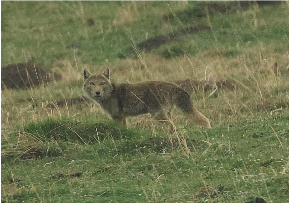
Moeders minder mooiste: Tibetan Fox, door Pablo Verduyssen