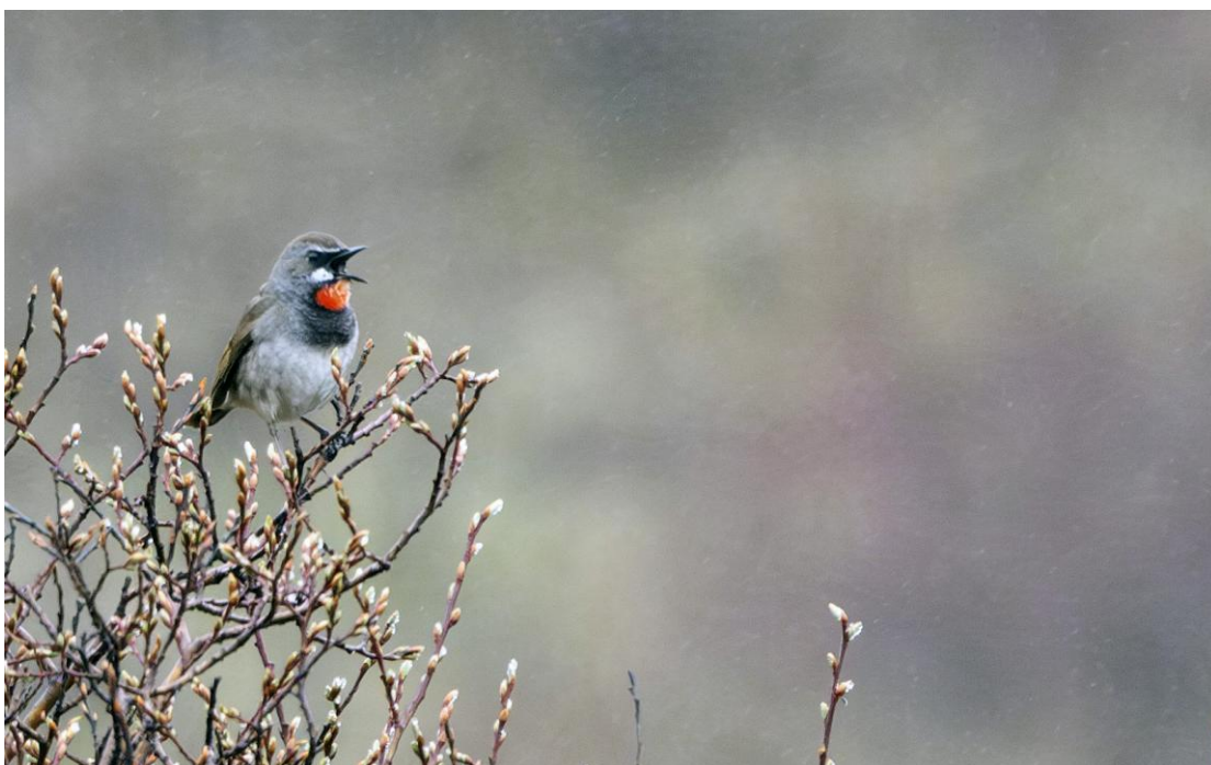
Chinese Rubythroat, Foto Bauke Kortleve.

Het einde van de reis komt in zicht: we hebben vandaag vooral een lange reisdag richting Chengdu voor de boeg. Een reisdag die overigens door werkelijk prachtige landschappen voert maar die weinig tijd biedt om serieuze vogelstops te maken. De enige echt belangrijke stop is al snel nadat we bepakt en bezakt bij het hotel zijn weggereden. We stoppen op een bergflank begroeid met scrub en struiken. Als eerste zien we hier een Rufous-breasted Accentor, Citrine Wagtails, Tickel's Warbler, Bruine Boszangers en Aziatische Roodborsttapuiten maar de troef van deze plek is de aanwezigheid van de schitterende Chinese Rubythroat ! Al snel zien we twee mannetjes die op een struikje fier tegen elkaar op lopen te zingen.