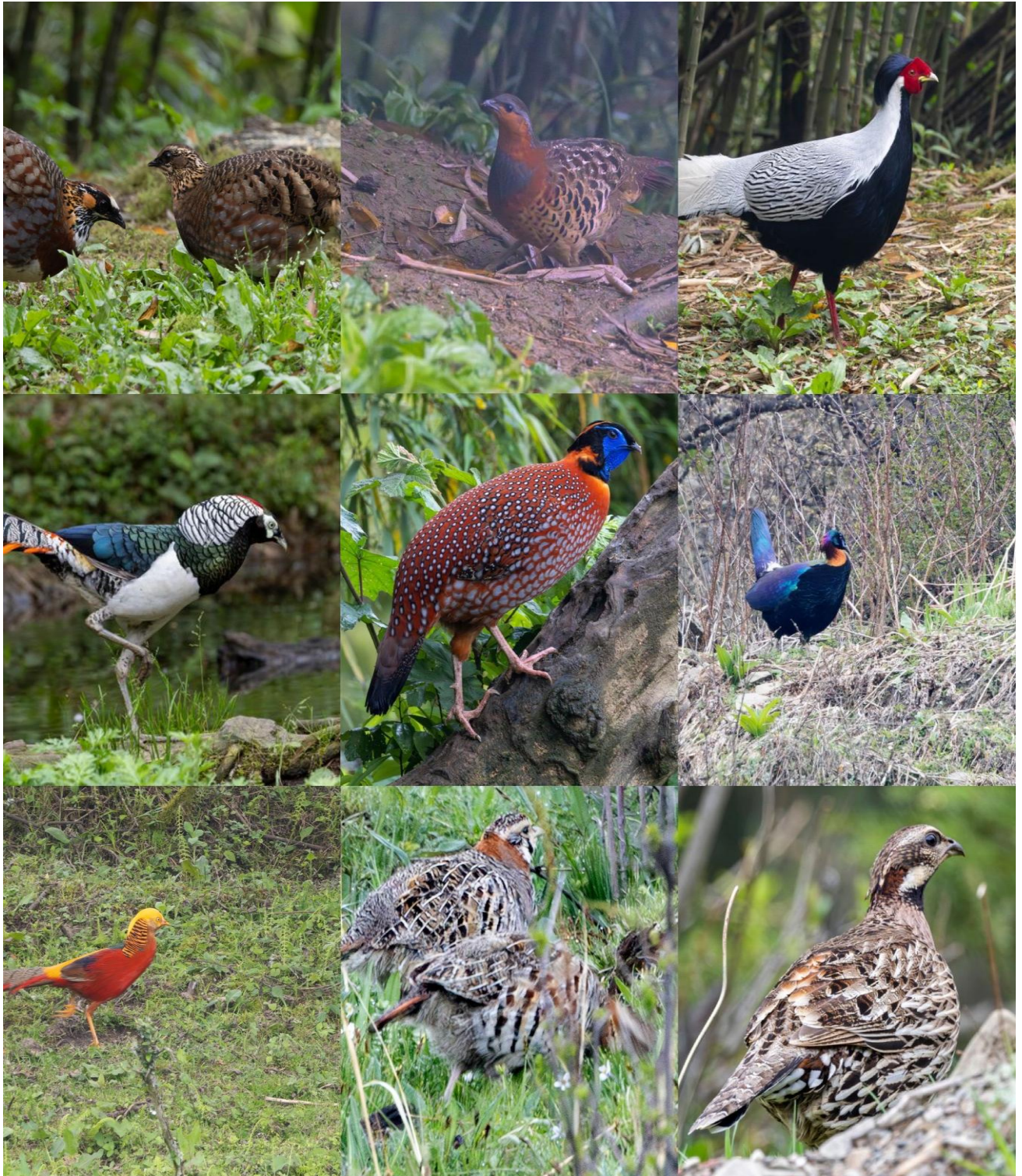
9 van de 17 hoenderachtigen die we deze reis zagen! Van linksboven naar rechts beneden: Sichuan Partridge, Chinese Bamboo-partridge, Silver Pheasant, Lady Amherst Pheasant, Temminck's Tragopan, Chinese Monal, Golden Pheasant, Tibetan Partridge & Koklass Pheasant.