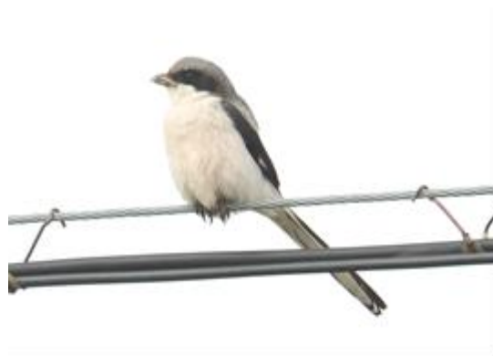
Het Tibetaans Plateau: dé plek voor Black-necked Crane en Giant Grey Shrike, door Pablo Verduyse.

Bij een eerste stop treffen we een soort die door sommigen wordt beschouwd als een van de mooiste zangvogels van Azië: de White-browed Tit-warbler . Paars, blauw, grijs, roze, oranje: het zit allemaal op dit kleine vogeltje geplakt. Verder zien we o.a. Aziatische Roodborsttapuit , White-bellied & Hodgson's Redstart , en de grijze tibetanus ondersoort van de Ringmus . Bij een volgende stop zien we Zwarte Ooievaars , Casarca's , zingende Oriental Skylarks , nog meer Black-necked Cranes en ook de fraaie calcarata -ondersoort (met geheel zwarte rug) van de Citroenkwikstaart .