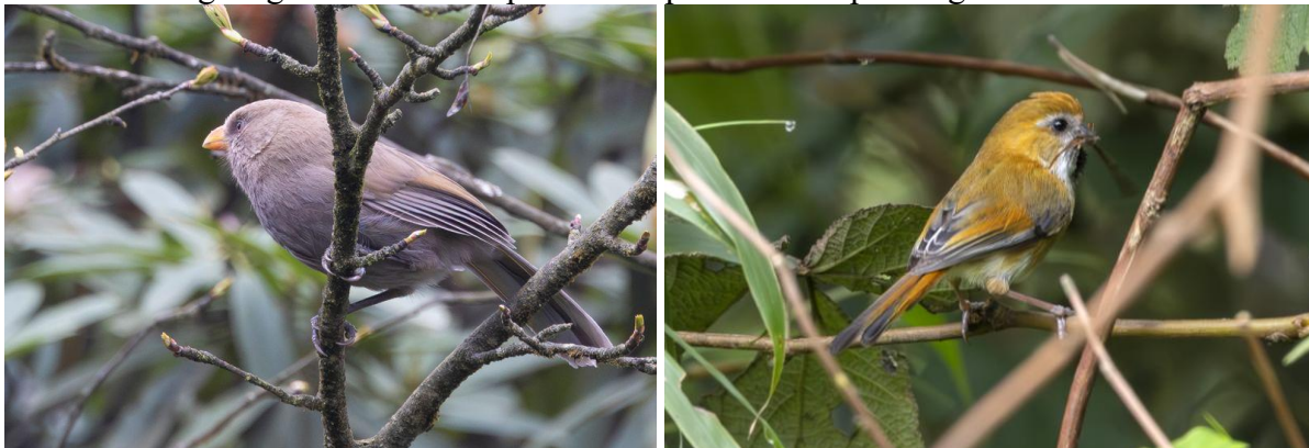
Giant en Golden Parrotbill, De grootste en kleinste van de 10 soorten Parrotbills die we zagen, Foto Bauke Kortleve.

het moment dat we weer een nieuwe soort aan het bewonderen zijn, Hodgson's Treecreeper , informeert een fotograaf ons dat er ongeveer een kilometer verderop een Firethroat is gezien. De groep snelt naar de plek en we positioneren ons op een vlinderbrug. We weten eigenlijk niet of we ver weg of dichtbij moeten zoeken, maar plots zien we bijna ónder ons iets bewegen. Volledig vrij hipt op enkele meters aan de waterkant een mannetje Firethroat! Hij laat zich minutenlang van alle kanten bekijken en begint ook nog eens sfeerverhogend te zingen. Na al deze successen strijken we tevreden neer bij een meertje waar we van een noedel- of dumplinglunch genieten. Na deze pauze vervolgen we onze rondwandeling en genieten we volop van deze plek met z'n prachtige soorten.