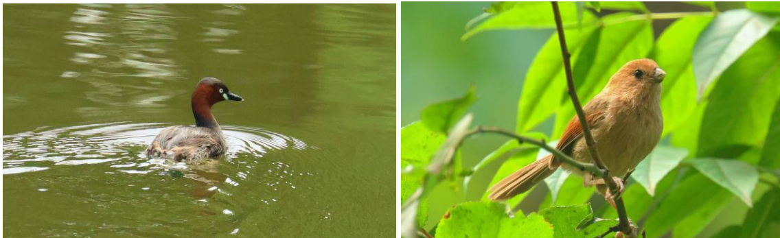
Dodaars (ondersoort capensis) en de 10e parrotbill van deze reis: Vinous-throated Parrotbill door Pablo Vercruysse.

Onze laatste uurtjes in China! Maar onze vluchten vertrekken pas om 19.00 uur vanavond dus hebben we nog een paar uur de tijd voor urban birding. En in deze heel andere setting pakken we toch nog een hoop mooie vogels mee. Als we uit de bus stappen zien we al snel een aantal kleinere gierzwaluwen met witte stuitjes vliegen, het zijn de eerste House Swifts van deze trip. We slenteren tussen de tai chi-ende en joggende Chinezen langs een grote Kwakken -kolonie, en krijgen Rufous-faced Warbler en Chinese Grosbeak voor het eerst deze reis echt mooi in beeld. Ook zien we al snel een paartje White-rumped Munia en vinden we na wat zoeken ook de tweede Sunbird-soort van deze trip, de Fork-tailed Sunbird . En even later botsen we ook nog op tegen de 10 e en laatste parrotbill-soort: de Vinous-throated Parrotbill . Het is gewoon lekker relaxed vogels kijken op de laatste uurtjes van deze mooie reis. We zien baltsende Crested Goshawks , een fraai mannetje Chinese Sparrowhawk , een Dodaars van de ondersoort capensis (met een opvallende lichte iris) en als allerlaatste soort - de 305 e van deze reis! - pikken we nog een Ashy Drongo mee.