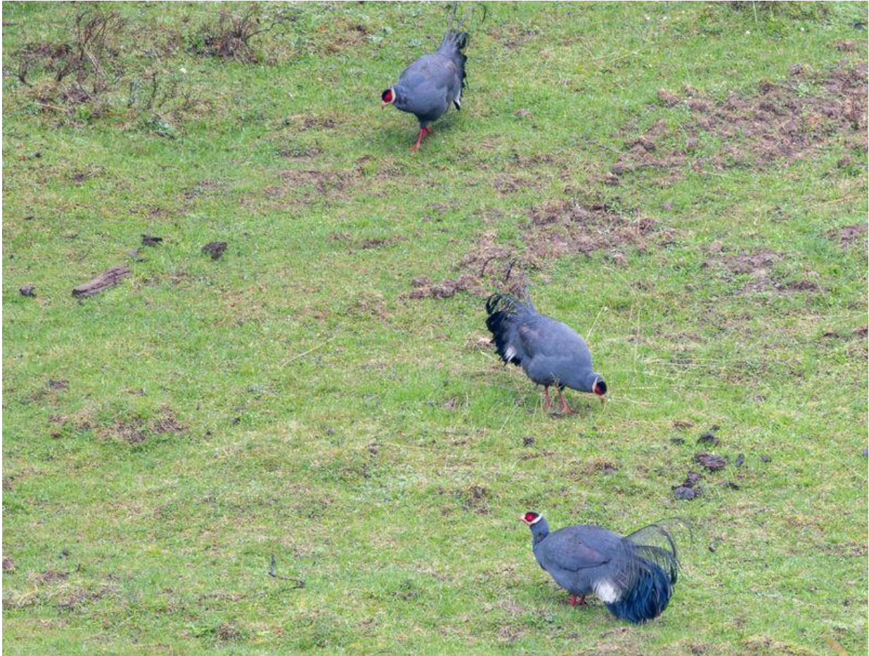
Blue Eared Pheasant door Bauke Kortleve

Laughingtrush die zich onbespied waant en die we daardoor fraai door de telescoop kunnen bestuderen. En ook de laatste soort Laughingtrush krijgen we uiteindelijk in beeld, de Snowy-checked Laughingtrush . “The best bird of the trip?” vraagt Jay zich hardop af, waarmee hij verwijst naar het ontstellend kleine verspreidingsgebied van deze endem. Ondertussen blijven we ook de graslanden in het dal afspeuren want we hopen ook hier op hoenders. En ja hoor! Zomaar uit het niets lopen er opeens drie prachtige Blue Eared Pheasants rustig op een grasveldje te pikken en krijgen we even later meer dan verwacht wanneer we ook twee Blood Pheasants snel een stuk grasland over zien rennen naar de dekking van een volgend bosje.