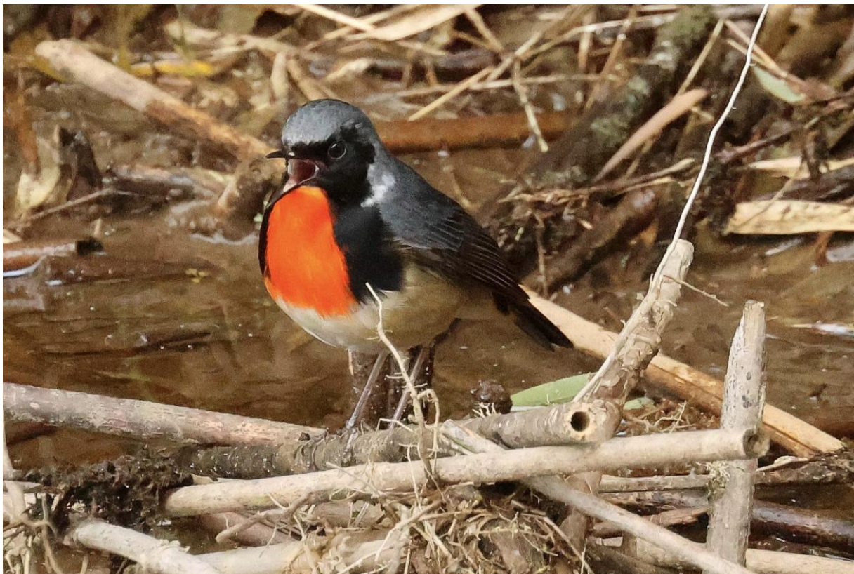
Zingend mannetje Firethroat, mei 2026, Wawushan, door Pablo Verduyck