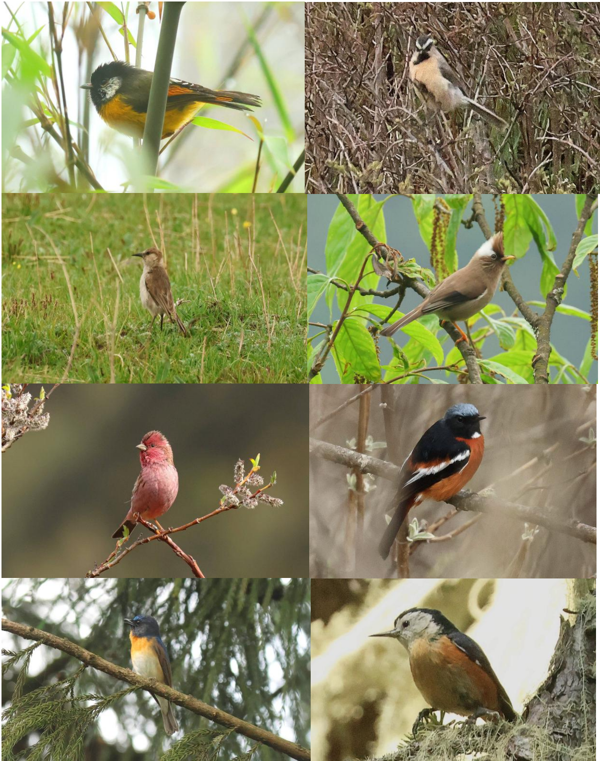
Een kleine selectie van enkele van de soorten die we zagen, Van boven naar beneden van links naar rechts: Golden-breasted Fulvetta, White-browed Tit, Groundtit, White-collared Yuhina, Himalayan Beautiful Rosefinch, White-throated Redstart, Chinese Blue Flycatcher, Przevalski's Nuthatch.