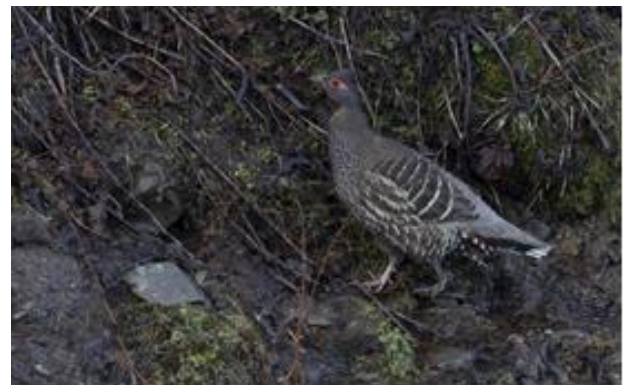
Collared Grosbeak en Chestnut-throated Monal-partridge (Bauke Kortleve).

We beleven een bijzondere lunch/kookworkshop in het veld: iedereen krijgt van Jay een ‘self-heating meal’. Ja mensen, China streeft ons ook op het lunch-segment voorbij! Het pakketje bestaat uit bakjes en zakjes die als een stoombak in elkaar passen. Als je alles op de juiste volgorde doet - een uitdaging voor de reisleader - en je giet water op een soort compressgaasje dat onderop ligt dan begint het allemaal te sissen, te pruttelen en te stomen. En dan heb je na 10 minuten een warme maaltijd, I kid you not! Het lukt sommigen inderdaad om op deze wijze een smakelijke warme rijstschotel te maken, bij anderen blijft de rijst wat aan de krakerige kant, maar uiteindelijk kijken we met een mengeling van verwondering en bewondering op deze lunch terug.