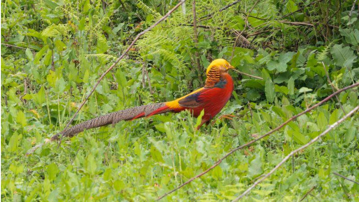
Golden Pheasant, door Bauke Kortleve

het veld op loopt. Na een beetje rondkijken vindt ie het wel mooi en met een sprintje zoekt hij weer de dekking, maar alle deelnemers hebben meer dan genoeg tijd gekregen om deze iconische soort te zien.