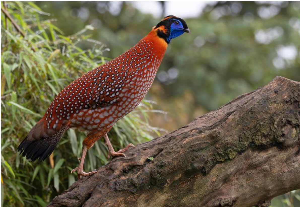
Mannetje Temmincks Tragopan, door Bauke Kortleve.