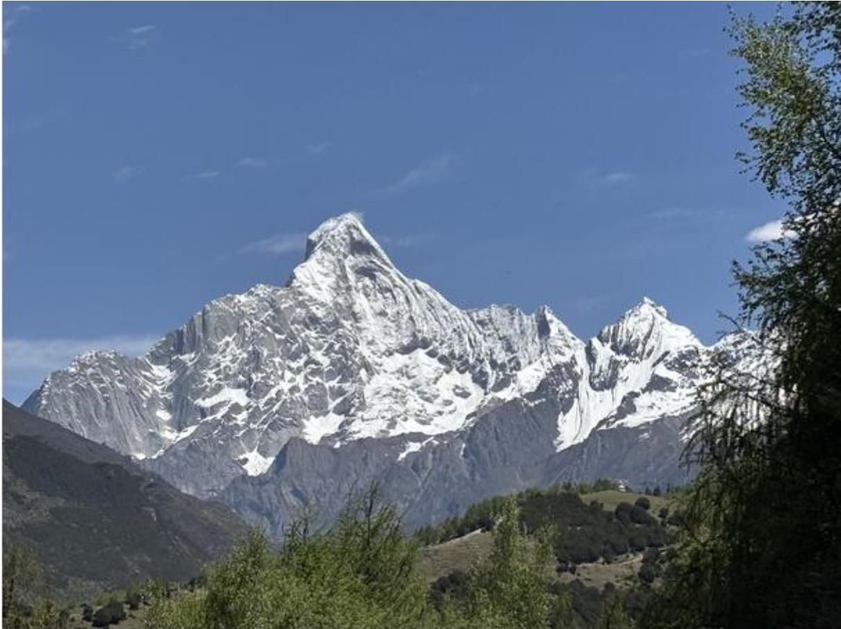
We hadden prachtig zicht op de 6250 meter hoge top van de Mount Singuniang,