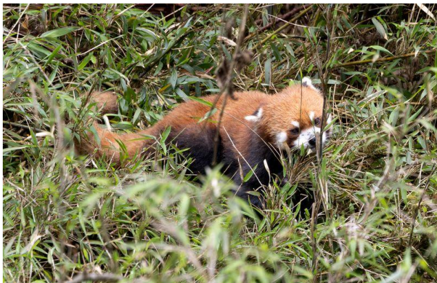
Chinese Red Panda