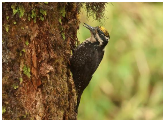
Eurasian Three-toed Woodpecker, Pablo Verduyts