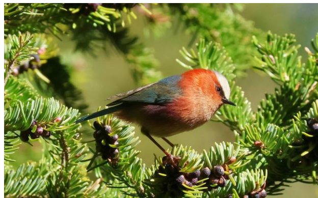
Sichuan Jay, Crested Tit Warbler (Pablo Vercruyse)