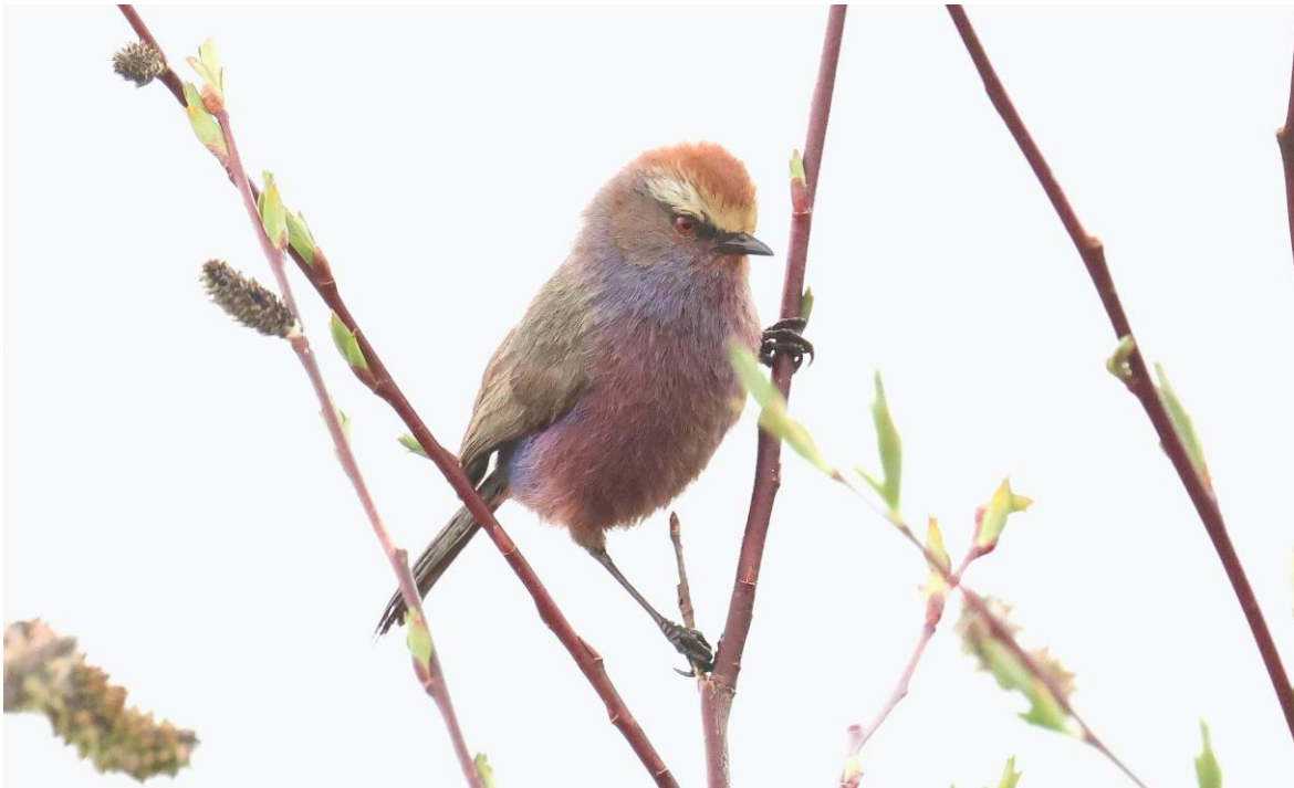
Moeders mooiste: White-browed Tit-warbler door Pablo Vercruyse

Na de lunch vervolgen we onze reis en stoppen we bij meertjes en mooie uitzichtpunten waar we enkele prachtige soorten zien. Zoals een stuk of 8 Giant Grey Shrikes , (recent gesplit van de Chines Grey Shrike en gepromoveerd tot endem), 2 Sakervalken , Daurian Jackdaws , Indische ganzen en op veel plaatsten zien we de curieuze Groundtit . En ook de zoogdierliefhebbers komen aan hun trekken: Asian Badger , Sichuan Sita Deer , Tibetan en Red Fox en werkelijk overal Himalayan Marmotten en Plateau Pica's . Maar de beste vogelsoort wordt voor het laatst bewaard: we stoppen bij een kleine vallei met scrub en hier horen we hem al snel zingen: een Przevalski's Pinktail : een unieke soort, enig lid van z'n eigen familie, als een kruising tussen gors en roodmus. De soort zit op enige afstand maar laat zich in de telescoop prachtig zien.