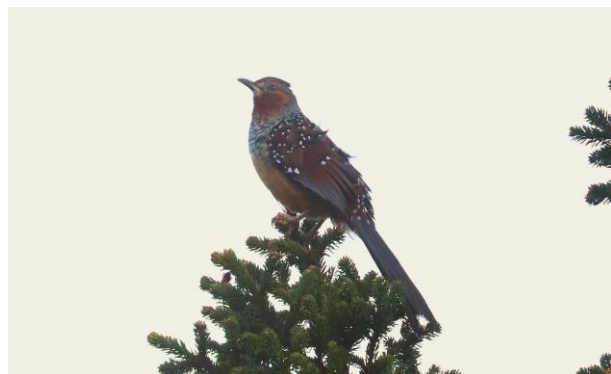
Przevalski's Pinktail en Giant Laughingtrush door Pablo Vercruyse.