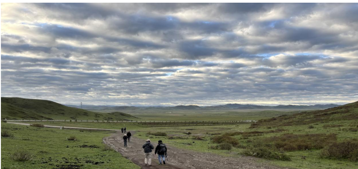
China Sichuan-reis 2026: vogelen in de mooiste landschappen