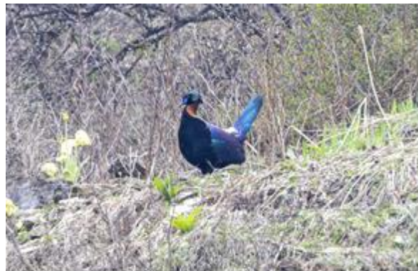
Snowpigeon en Chinese Monal zijn karaktersoorten van deze locatie, foto's Bauke Kortleve.